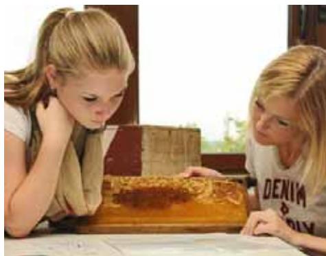
Am Ursprungsort: Eine Bienenwabe als Anschauungsobjekt gehört zum Experiment.