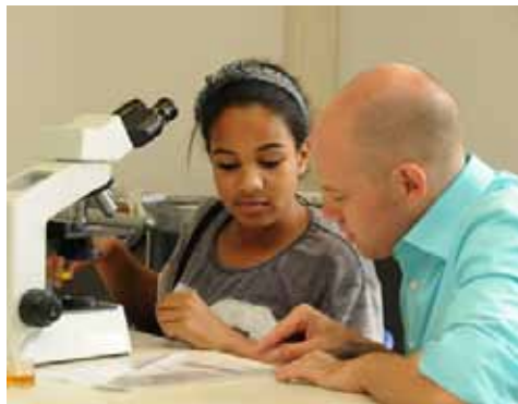
Süßes Objekt: Unter dem Mikroskop lässt sich sehen, welche Honigsorte im Glas ist.