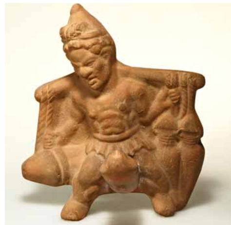
Der Lastenträger, eine Tonfigur aus der aktuellen Ausstellung im Martin-von-Wagner-Museum.

Die Figuren erlauben Einblicke in die populäre Alltagskunst Ägyptens in der Zeit nach der Eroberung durch Alexander den Großen und unter den römischen Kaisern. Damals lebte am Nil ein Völkergemisch aus Griechen, Römern und Ägyptern – und damit eine der frühesten multikulturellen Gesellschaften der Menschheit.