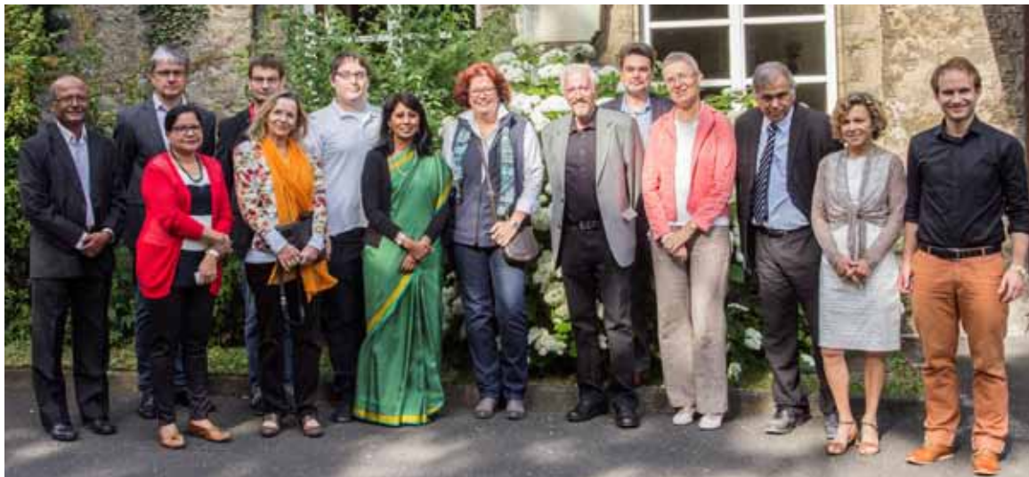
Referenten, Organisatoren und Gäste der Tagung „Exploring Emerging India“.