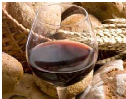
Brot zum Wein anstelle einer geweihten Hostie? In der katholischen Kirche ist das undenkbar. Andere Konfessionen sehen das entspannter.

Immer am Pfingstmontag lädt die evangelisch-lutherische Salvatorgemeinde Untersiemau zu einem „Wirtshausgottesdienst“ ein. Der Gottesdienst findet an den Tischen statt, die Teilnehmer bestellen sich vor Beginn ihre Getränke. Passend dazu stand die Predigt im vergangenen Jahr unter der Überschrift: „Wer isst, der sündigt nicht“. Zum Gottesdienst in die Kneipe? Das gibt es immer öfter. Denn Essen und Trinken spielen zunehmend eine Rolle in Kirchen und in Gottesdiensten.