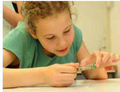
Biene im Käfig: Eine Schülerin erforscht das Fressverhalten einer Honigbiene.