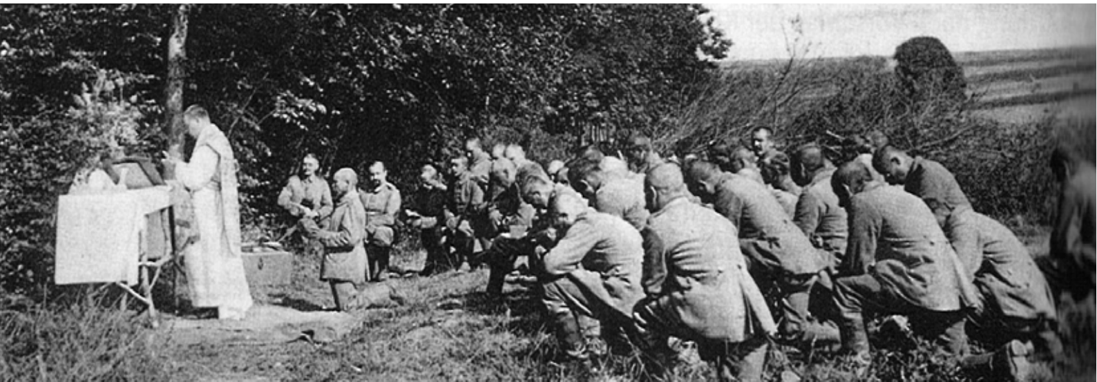
Soldaten bei einem katholischen Feldgottesdienst. Das Bild stammt von einer Postkarte, die im April 1916 als Ostergruß verschickt wurde. Aus: „Glaubenssache Krieg“, herausgegeben von Heidrun Alzheimer