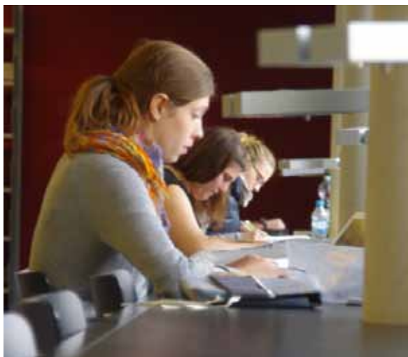
Lernen in der Bibliothek: An der Uni Würzburg ist der Studienbeginn auch zum Sommersemester in vielen Fächern möglich.

Ob Mathematik, Geschichte, Germanistik oder anderes: Ab sofort können sich Studienanfänger für zahlreiche zulassungsfreie Studiengänge einschreiben. Für viele Erstsemester gibt es ab 23. März spezielle Vorkurse, um den Start ins Studium zu erleichtern.