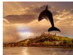
Das Thema „Meere und Ozeane“ ist zu Gast in Würzburg; Motiv vom Veranstaltungsplakat der Stadt.

Meere und Ozeane faszinieren die Menschen aufgrund ihrer Weite, Vielfalt, Schönheit und ihres Reichtums. Sie bedecken drei Viertel der Erde und sind ein riesiges zusammenhängendes Ökosystem, das Lebensraum für über 300.000 bekannte Arten von Lebewesen darstellt. Zugleich sind sie Nahrungsquelle und Wirtschaftsraum für die Menschheit.