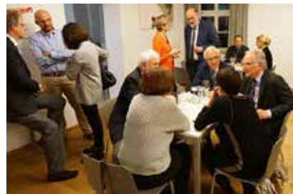
Begegnungen beim SCIAS-Forum im Welzhaus.

Die nächste Veranstaltung aus der Reihe „SCIAS-Forum für Interdisziplinarität“ findet am Mittwoch, 19. Juli 2017, statt und wird sich thematisch mit Philipp Franz von Siebold und seiner Bedeutung für Würzburg und Japan befassen.