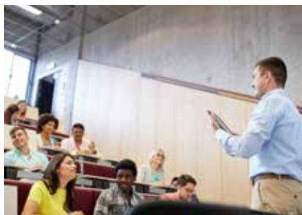
Im Juni startet die Veranstaltungsreihe „Internationalisierung der Hochschuldidaktik“ mit Workshops, Seminaren und Vorträgen.

ProfiLehre – der Bereich Hochschuldidaktik am „Servicezentrum für innovatives Lehren und Studieren“ (ZiLS) – bietet Dozierenden damit vielfältige Möglichkeiten, ihre Lehre mit Blick auf die Herausforderungen der Internationalisierung zu optimieren.