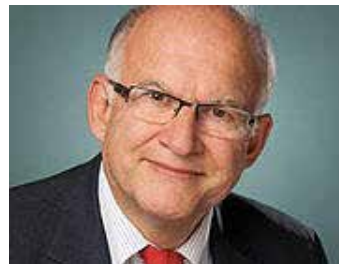
Peter Schaar, Bundesbeauftragter für den Datenschutz und die Informationsfreiheit a.D.

Sind Algorithmen durch ihre technischen Rechenvorschriften eigentlich neutral? Sollte nicht alles objektiver werden, wenn wir ihnen Entscheidungen im Einstellungsprozess oder bei Versicherungen überlassen? Sind die Zeiten von Diskriminierung endlich vorbei? Leider nein, sagt Peter Schaar.