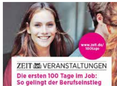
Motiv vom Plakat zur Veranstaltungsreihe.