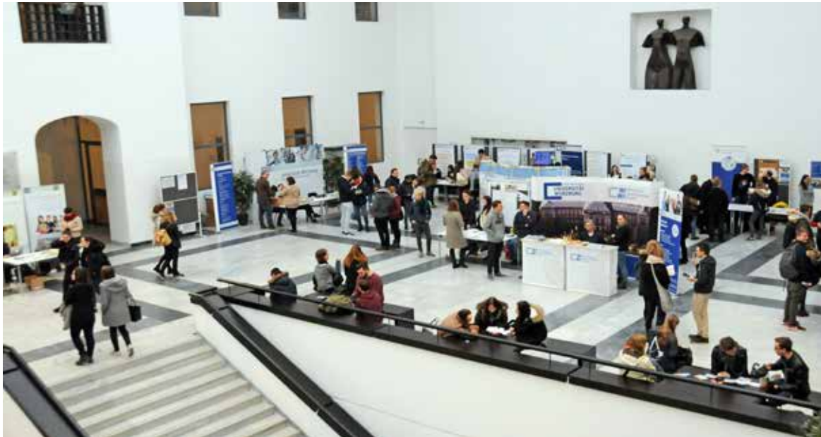
Am Studien-Info-Tag an der Universität Würzburg konnten Interessierte sich über ihr Wunschstudium informieren.