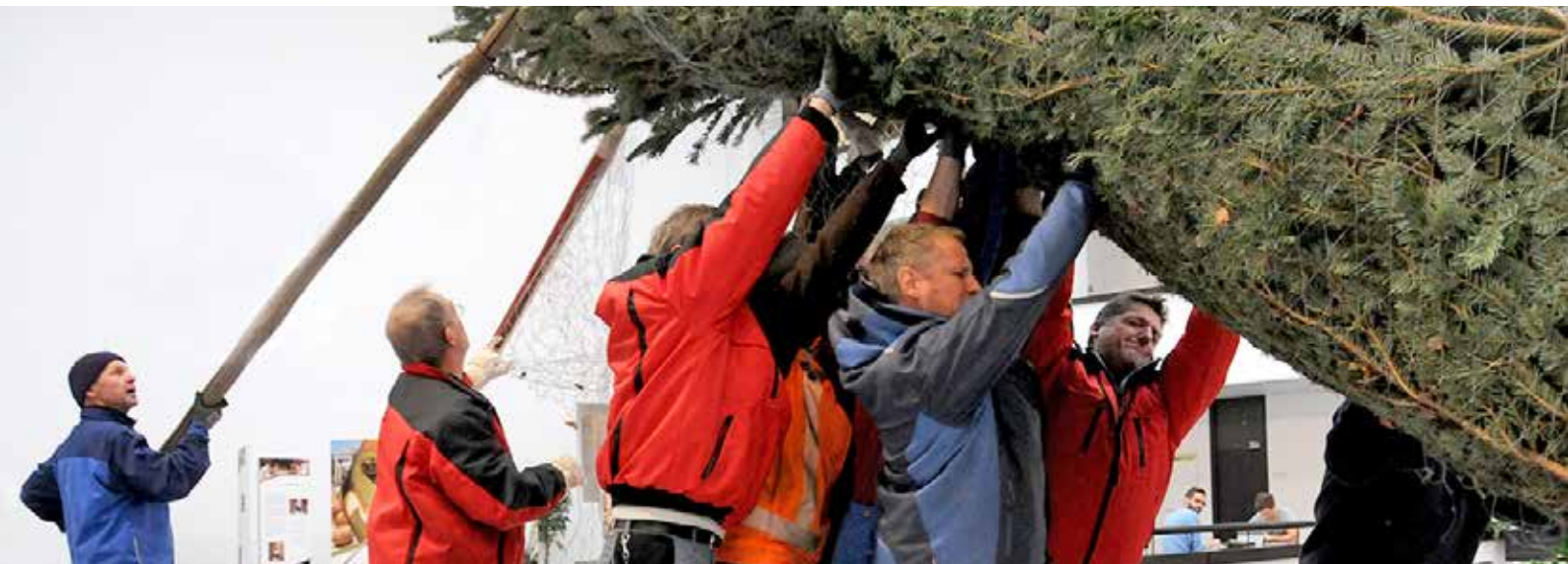
Kraftakt im Lichthof: das Aufstellen des Weihnachtsbaums.