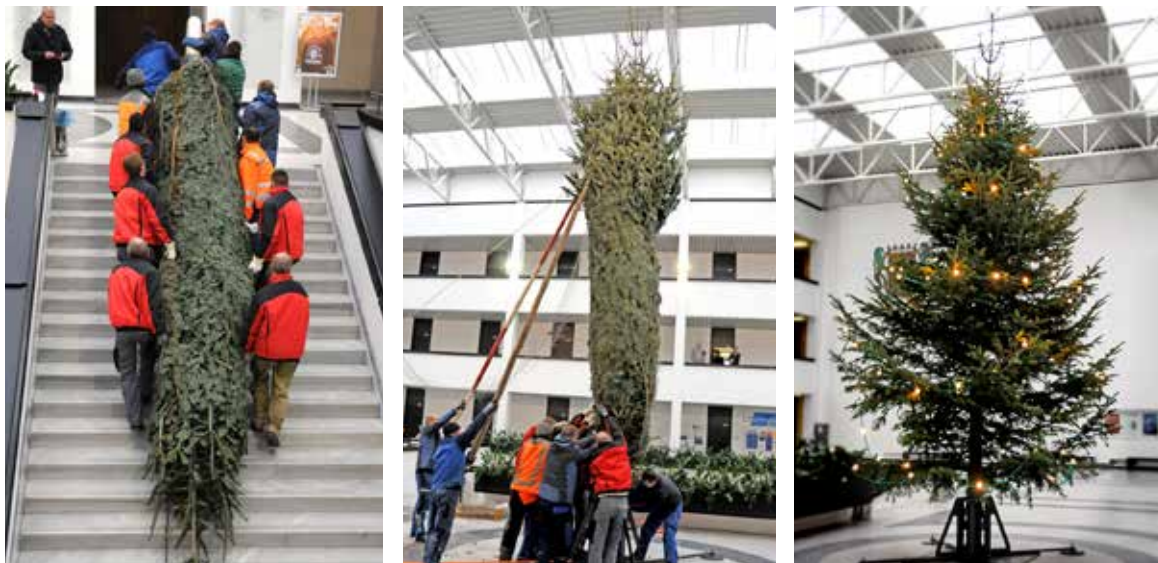
Eine Fußballmannschaft plus Trainer: So viele Kräfte waren in diesem Jahr nötig, um den Weihnachtsbaum an seinem Standplatz im Lichthof der Uni am Sanderring sicher, stabil und lotrecht aufzustellen.