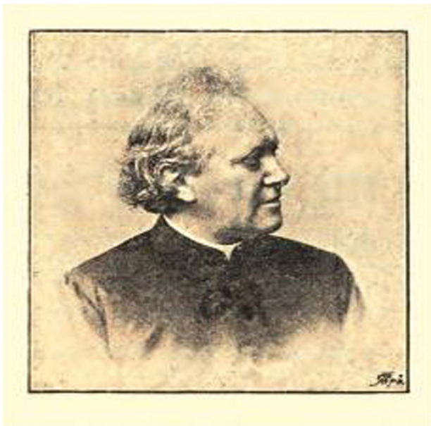
Das erste Foto in der Academia | 1891

auf der letzten Seite eine Anzeige des Ludwigsbads Wipfeld in Unterfranken beigegeben. 19 Die Zahl dieser Annoncen wurde von Ausgabe zu Ausgabe mehr, wobei in graphischer Hinsicht auffällt,