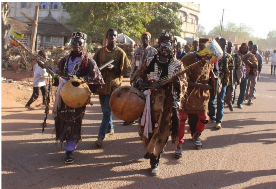
Abb. 2: Dozo bei der Parade anlässlich des Festivals Bobo Mandaré in Bobo-Dioulasso

Eine regionalspezifische Variante lokaler Sicherheitskräfte sind in den mandesprachigen Gebieten Westafrikas Jäger (in Bambara/Dioula dozo oder donso ), die überlokale Vereinigungen bilden können. Jagen erfordert die Fähigkeit, sich vor einer Kraft ( nyama ) in der Natur schützen zu können. Durch eine Initiation erwerben die Jäger Wissen über die entsprechenden Objekte, Formeln und Heilmittel, mit dem sie auch ihre jeweiligen Lokalgemeinschaften schützen. Initiierte Jäger sind an einem besonderen, mit Amuletten verzierten Gewand und Mützen zu erkennen. Die heutigen Jäger-Bewegungen stützen sich auf eine 1000 Jahre alte Tradition in Westafrika. So standen Jäger im Dienst von Königen und mächtigen Wahrsagern der Region, die ab dem 13. Jahrhundert das Herz des Mali-Reiches bildeten (Thoyer 1995).