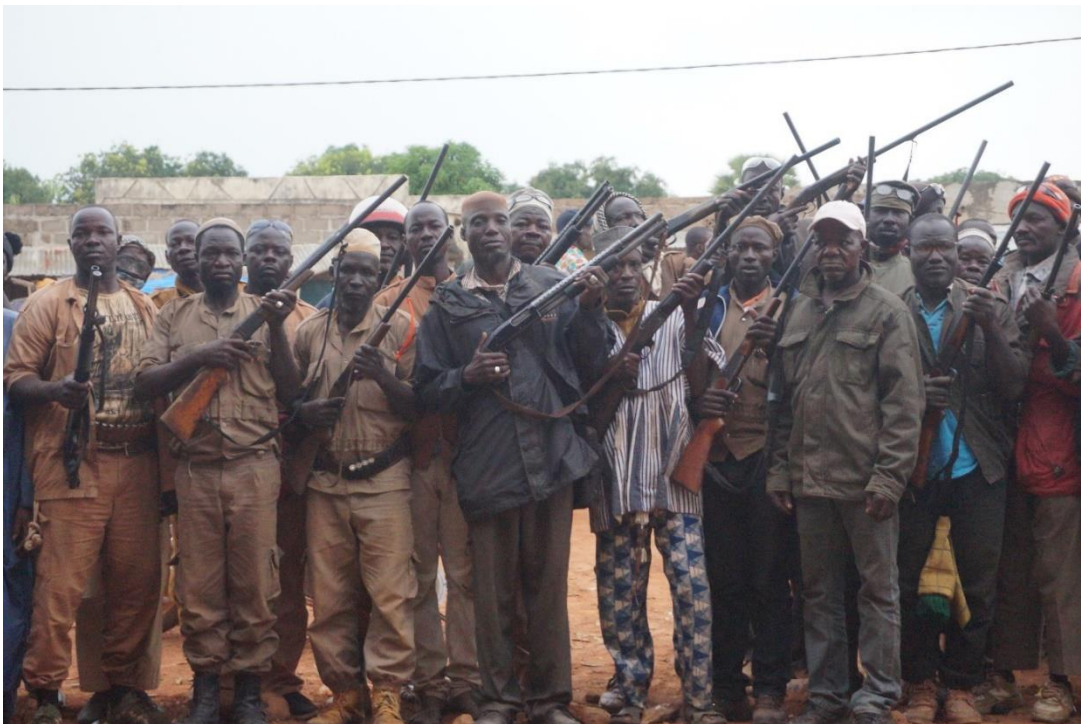
Abb. 6: Gruppenfoto der Koglwéogo -Chefs vor einem Antiterrorereinsatz in der Gemeinde Nobéré

Die Datenerhebung wurde durch die Sicherheitslage in Burkina Faso und die ständige Waffenpräsenz im Feld erschwert. Während Zantés Feldforschung wurden vier Koglwéogo in seinem Forschungsgebiet aufgrund ihrer Aktivitäten in der Terrorismusbekämpfung von Terroristen getötet. Das Sammeln von Daten unter diesen Bedingungen erwies sich als äußerst schwierig und barg das Risiko, selbst ins Visier zu geraten.