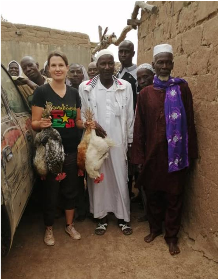
Abb. 5: Verabschiedung nach einem Treffen mit Koglwéogo in Sieno

Zanté konnte hier weiterhelfen. Ein Koglwéogo -Chef in seinem Forschungsgebiet, der an der Gründung der Koglwéogo in Karangasso-Vigué beteiligt war, konnte Tiegna die Telefonnummer des Koglwéogo -Chefs in Karangasso-Vigué verschaffen und so konnte ein erstes Treffen arrangiert werden.