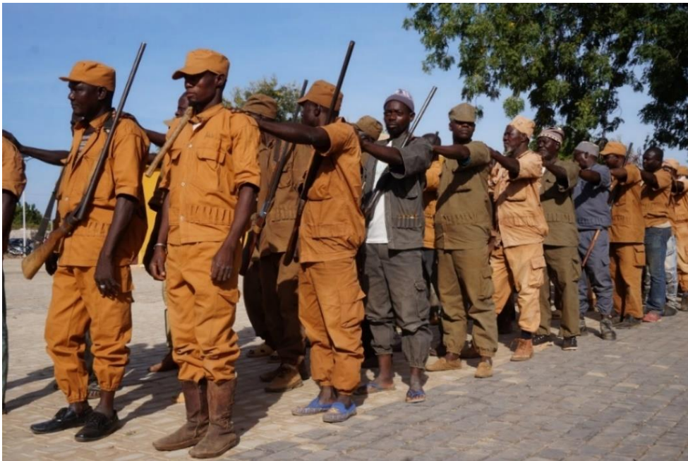
Abb. 1: Koglwéogo in ihrer Uniform

Seit 2015 formte sich eine neue Form der Koglwéogo -Gruppen. Sie verschreiben sich dem „Schutz des Lebensumfeldes“ ihrer Gemeinden. Sie werden oft als Miliz im Sold der Ethnie der Mossi (Moose), als Selbstverteidigungsgruppe und manchmal sogar als Terroristen gesehen. Koglwéogo erschienen in der burkinischen Sicherheitslandschaft als Reaktion auf die Verschlechterung der Sicherheitslage und auf die Schwierigkeit des Staates, effektiv auf Sicherheitsprobleme zu reagieren – insbesondere in ländlichen Gebieten (Hagberg et al. 2017, Bojsen/Compaoré 2019; Leclercq/Matagne 2020). Das Gefühl der Unsicherheit und das vom Staat hinterlassene Vakuum haben dazu geführt, dass sich die ländliche Bevölkerung selbst organisiert und die staatlichen Sicherheitskräfte (Polizei und Gendarmerie 1 ) zum Teil ablöst (Asha 2018).