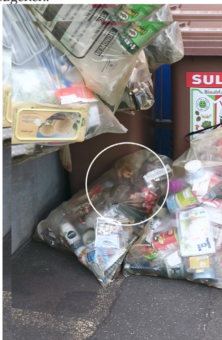
Abb. 5: Zwei Ratten in Gelbem Sack, 27. Mai 2020, Foto: Pearl-Sue Carper.

eigentlich durch Mülltonnen „aus dem Blickfeld genommen“ wird und den normalerweise „keiner haben, sehen oder riechen möchte“ (Franzelin/Winkler 2010: 158). So werden in Gelben Säcken, unter Mülltonnen, nahe Restaurants, aber auch im städtischen Gebüsch hinter der Imbissbude Lebewesen sichtbar, die die Abfälle anderer Lebewesen wieder in Wert setzen. Doch mehr noch: darüber hinaus wird über Ratten auch eine Gesellschaft sichtbar, die unaufhaltsam Müll produziert, ohne diesen selbst umfassend erneut in Wert setzen zu können (Weber 2014: 157). Über Ratten kann somit nicht nur das gegenwärtige Konsumverhalten einer Gesellschaft sichtbar werden (Holmberg 2019: 5), sondern darüber hinaus auch die Mentalität einer Wegwerfgesellschaft beobachtet werden. Für den Graffiti-Künstler Thomas stellen Ratten somit ein Indikator dar: Gehe es den Ratten gut, gehe es auch den Menschen gut, die augenscheinlich die Möglichkeit haben, unachtsam mit Ressourcen umzugehen. 183