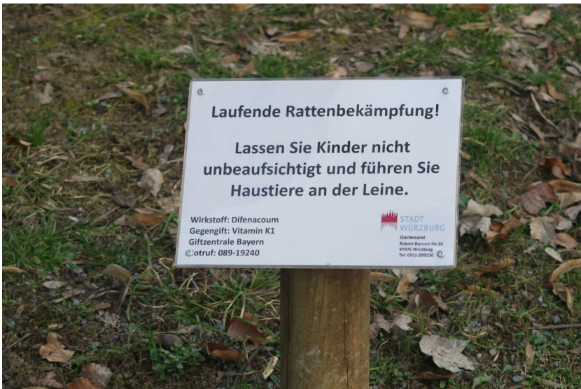
Abb. 3: Warnhinweisschild zur Rattenbekämpfung im Würzburger Ringpark, 26. Februar 2019, Foto: Pearl-Sue Carper.

fer Herr Beck eigentlich verbieten. Es gäbe aber keine Alternative. 140 Auch Gabriela Jarzebowska diskutiert diesen „there-is-no-alternative“-Diskurs: Zum einen erschwert die durch die EU organisierte Gesetzgebung eine Etablierung anderer Bekämpfungsmittel. Zum anderen liege es nicht im Interesse der Entscheidungsträger*innen, mit den Akteur*innen zu kooperieren, die sich mit der Erforschung von Ratten in urbanen Lebensräumen und deren Erkenntnissen auseinandersetzen (Jarzebowska 2018: 9-10). Nicht nur Schädlingsbekämpfer*innen und Wissenschaftler*innen, sondern auch weitere meiner Forschungspartner*innen problematisieren die Gefahr des Einsatzes von Giftstoffen mit Blick auf andere Lebewesen. Dies führt entweder zur Vermeidung des Einsatzes von Rattengift zum Schutz weiterer Lebewesen, 141 zumindest aber z.B. im öffentlichen Bereich zur Anbringung von Warnhinweisen, die den Schutz auf Kinder und Haustiere begrenzen, wie dies auch im Würzburger Ringpark der Fall war (Abb. 3). Erneut wird hier eine Privilegierung bestimmter Lebewesen sichtbar.