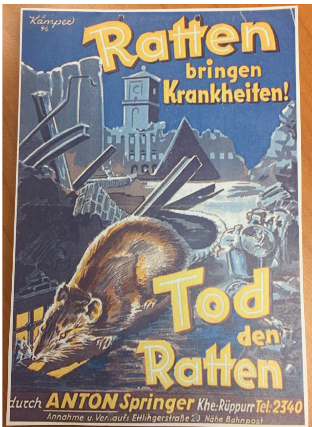
Abb. 2: Werbung Schädlingsbekämpfung 1946, 11. Oktober 2019, Foto: Pearl-Sue Carper.

Betrachtet man also den Umgang mit Ratten, so funktioniert dieser aus menschlicher Perspektive in Form der Bekämpfung in erster Linie als ein Akt der Wiederherstellung von Ordnungssystemen, innerhalb derer grundlegend zwischen Menschen und Tieren unterschieden wird. Dabei gründet sich die Kategorisierung von „Mensch“ und „Tier“, wie die Historikerin Anne-Charlotte Trepp zusammenfasst, unter anderem in einer bereits seit Aristoteles existierenden Vorstellung, „einer linear abgestuften Abfolge aller Lebewesen“ (Trepp 2020: 25), innerhalb derer „Pflanzen und Tiere [...] für den Menschen“ existieren (ebd.).