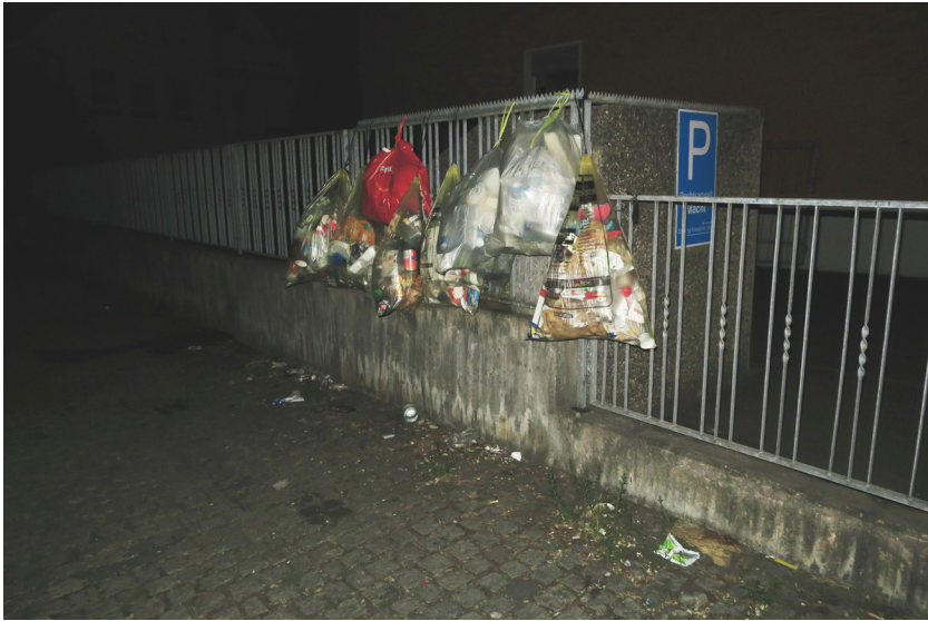
Abb. 4: Hängende Gelbe Säcke im Stadtteil Sanderau, 21. Mai 2020, Foto: Pearl-Sue Carper.

anderen Vorrichtungen aufgehängt. Für Nager, die, so die Schädlingsbekämpferin Tanja, sehr gut klettern können, 179 stellt dies jedoch meist kein Hindernis dar. So kann man nicht nur in der Nacht raschelnde und nagende Geräusche aus hängenden und sich bewegenden Gelben Säcken vernehmen (Abb. 4), 180 sondern auch tagsüber Ratten in Gelben Säcken auf der Suche nach etwas Essbarem beobachten (Abb. 5).