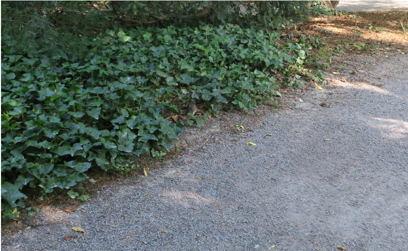
Abb. 1: Mensch-Ratten-Begegnung im Würzburger Ringpark, 22. August 2019, Foto: Pearl-Sue Carper.

Als ich auf Höhe des Lindahlbrunnens den Weg Richtung Ottostraße entlangspazierte, zuckte ich zusammen und bleibe wie angewurzelt stehen, als plötzlich in einer immensen Schnelligkeit etwas kleines braunes Felliges meinen Weg kreuzt. So schnell, wie es über den Schotterweg lief, wusste ich kurz nicht, um welches Lebewesen es sich hier wohl handeln würde, bis ich den Schwanz erblickte und sich die Ratte am Wegesrand, aber doch im Schutz des Dickichts, niedersetzte und kurz innehielt. Mit etwa zwei Metern Abstand voneinander verharrten wir mit angespannten Körpern für eine kurze Weile. Bis ich jedoch eine kurze Bewegung zu viel machte und sie mit einem Sprung im Dickicht verschwand. 63