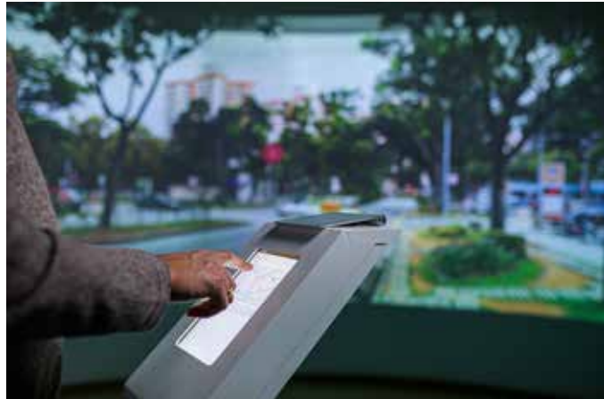
Ein Bedienfeld in der Mitte der Rotunde ermöglicht über eine berührungsempfindliche Oberfläche und Gestensteuerung die Interaktion mit den dargestellten Daten.