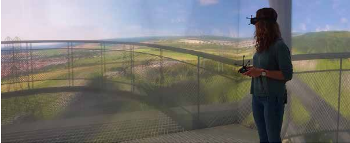
Virtuelles Training gegen Höhenangst im CAVE, dem 3D Multisensoriklabor des Lehrstuhls für Psychologie

„Bislang konnten wir mit Freude feststellen, dass sich die Teilnehmerinnen und Teilnehmer deutlich verbessert haben. Durch den Einsatz einer computersimulierten Welt kann die Angst überwunden werden.“ Inwiefern die Hirnstimulation Aufwind gibt, kann das Studienteam noch nicht sagen, da die Studie doppelblind ist, sie also erst am Ende wissen, wer tatsächlich eine Hirnstimulation erhalten hat.