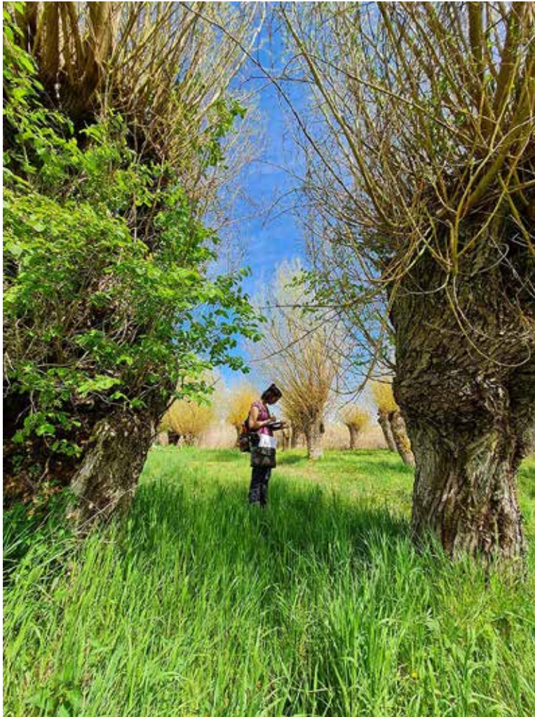
Landschaftsarchitektin auf Spurensuche in einer unterfränkischen Kopfweidenlandschaft: Dieses preisgekrönte Foto entstand in den Haßbergen.

anschließend ihrem Mann nach Berlin und arbeitete dort als freiberufliche Journalistin, Fotografin, Grafikdesignerin, Moderatorin, Lektorin und Projektleiterin diverser Medien- und Kulturveranstaltungen. Nach der Geburt des ersten Kindes kehrte das Paar in die Heimat zurück und ist seitdem hier freiberuflich im Einsatz, unter anderem für Tageszeitungen der Region.