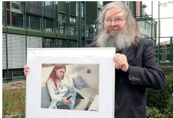
Beim Wettbewerb des Bezirks Unterfranken „Pressefoto Unterfranken 2022“ hat Wolf-Dietrich Weißbach in der Kategorie „Universität & Wissenschaft“ mit seinem Foto „Still-Assistent“ den 1. Platz belegt.

So lautet die Bildunterschrift zu dem Foto, das jetzt beim Wettbewerb „Pressefoto Unterfranken“ erfolgreich war. Darauf zu sehen ist eine junge Frau, die scheinbar einen kleinen Roboter stillt und dabei konzentriert auf ihr Smartphone blickt. Fotograf Wolf-Dietrich Weissbach konnte sich mit dieser Aufnahme in der Kategorie „Universität & Wissenschaft“ gegen zahlreiche Gegner durchsetzen; er erhielt den mit 500 Euro dotierten Preis verliehen. Die Kategorie war 2017 neu in den Wettbewerb eingeführt worden; das Preisgeld stellt seitdem die Julius-Maximilians-Universität Würzburg zur Verfügung.