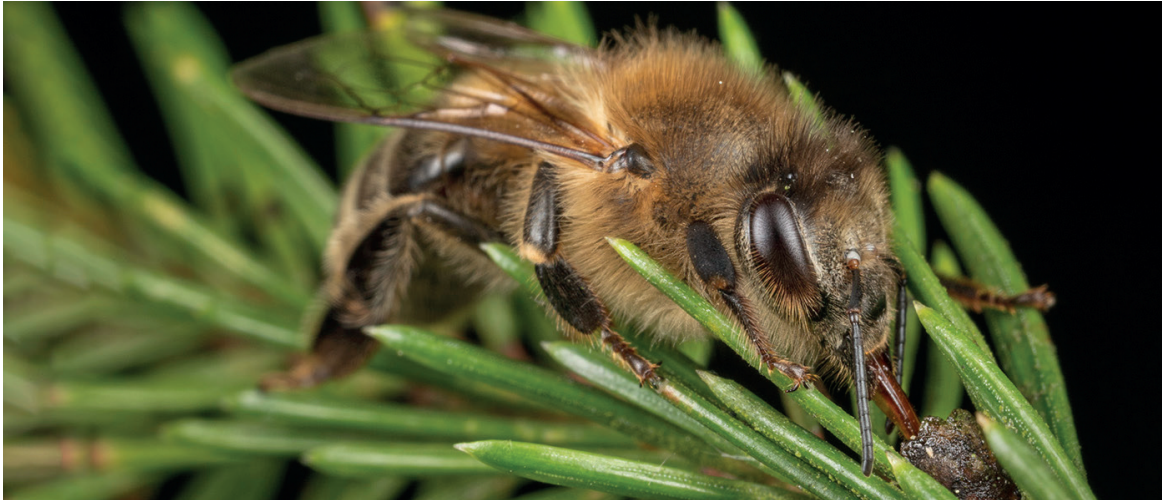
Eine Honigbiene ( Apis mellifera ) sammelt Honigtau auf einer Tanne. Die Studie zeigt, dass der von Buchen dominierte Steigerwald den Honigbienen nur unzureichende Nahrungsressourcen bietet.

so Rutschmann. Einer der Hauptgründe dafür sei die Buche, die im Steigerwald über 40 Prozent des Baumbestands ausmacht: „Buchenwälder sind dunkel, da wächst nicht viel am Boden. Kaum eine Pflanze kommt nach dem Kronenschluss mit den Lichtverhältnissen in Buchenwäldern klar, also fehlt die so wichtige diverse Krautschicht,“ so der Biologe.