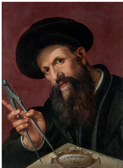
Links: Bernardino Licinios Porträt von Sebastiano Serlio (um 1530) gehörte zu den frühesten Erwerbungen des „Ästhetischen Attributs der Universität Würzburg“. Rechts: Für sein Serlio-Porträt (um 1570) orientierte sich Bartolomeo Passerotti wahrscheinlich am Gemälde Licinios. Seit 2019 gehört es dem Martin von Wagner Museum.