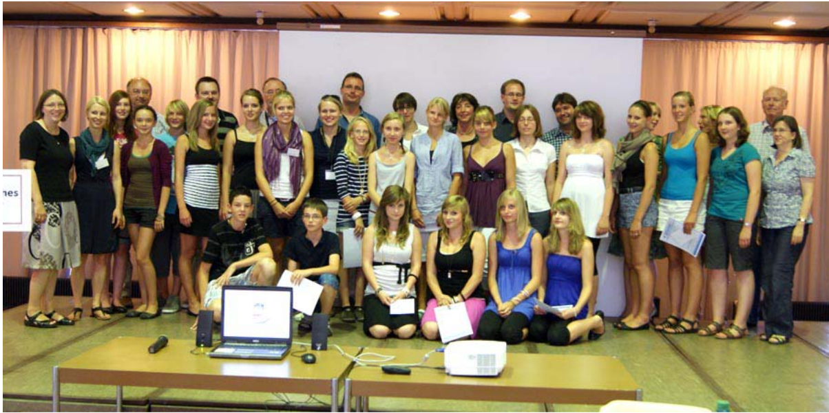
Die Teilnehmer des diesjährigen Wettbewerbs samt Jurymitgliedern

Wer spricht stärker Dialekt: Männer oder Frauen? Katholiken oder Protestanten? Dorfbewohner oder Städter? Solche Fragen haben Schüler der 8. Klasse aus unterfränkischen Gymnasien ein Jahr lang untersucht. Die besten Arbeiten wurden im Rahmen eines Mini-Kongresses des Unterfränkischen Dialektinstituts der Universität Würzburg ausgezeichnet.