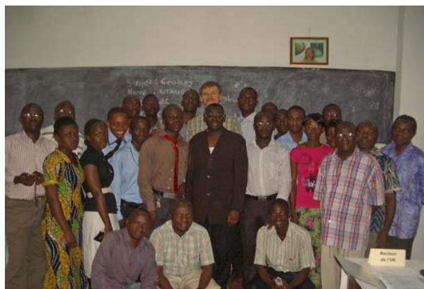
Glücklich über die Verlängerung ihrer Stipendien: Das Bild zeigt 15 der inzwischen über 30 Exzellenz-Stipendiaten an den Würzburger Partnerunis Kinshasa und Butembo und die Mitglieder des Prüfungskomitees im „eigenen“ Seminarraum.

Alle 31 Stipendiaten bekommen nicht nur finanzielle Unterstützung, sondern auch Förderung durch Seminare und Tutoren. „Erstmals zeichnet sich das gesamte Exzellenzprogramm jetzt in all seinen vier Stufen ab“, freut sich Professor Bringmann. Die vier Stufen sind: Förderung von Bachelor- und