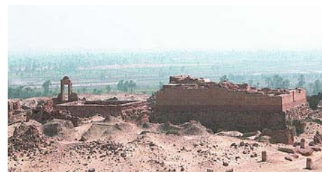
Die ägyptische Oase Fayum steht im Mittelpunkt einer Tagung, die der Lehrstuhl für Ägyptologie der Uni Würzburg Anfang Mai im Kloster Bronnbach veranstaltet.

Zwei Gründe gibt es dafür. Zum einen war das Fayum in der Antike über lange Zeit kontinuierlich besiedelt, denn