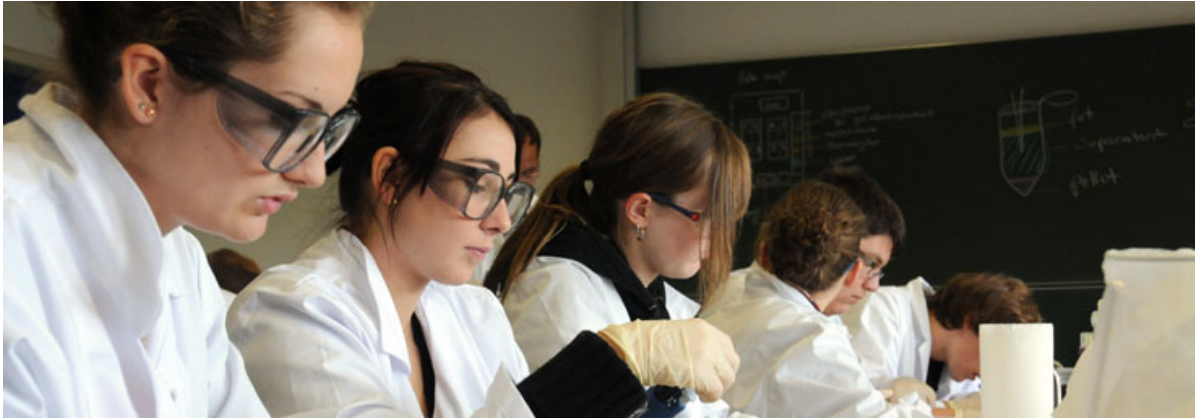
Schüler aus Haßfurt beim Experimentieren im MIND-Center.