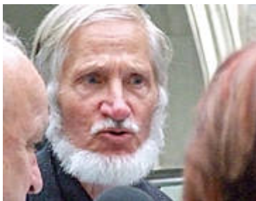
Rupert Neudeck bei einer öffentlichen Veranstaltung im Jahr 2007.

Auch 50 Jahre nach seinem Tod lebt der Geist des Politikers Patrice Lumumba in der Demokratischen Republik Kongo fort. Zu seinen Lebzeiten wurde Lumumba im Kalten Krieg von den Westmächten dämonisiert; schließlich fiel er einer tödlichen Verschwörung zum Opfer. Heute wird er als Märtyrer verehrt, der für die Freiheit seines Landes gestorben ist. Der Mythos Lumumba ist mit seinen vielen Facetten allgegenwärtig. Bis heute beeinflusst er das politische Tagesgeschehen in Kongos Hauptstadt Kinshasa. In dem vom Bürgerkrieg gebeutelten Land stellt sich die Frage nach dem politischen Erbe des Kämpfers, da Politiker den Mythos zu populistischen Zwecken missbrauchen. Aus Literatur, Kunst und Alltagskultur ist Lumumba nicht wegzudenken, denn im kongolesischen Bewusstsein steht er als Zeichen der Hoffnung im Kampf gegen die Auswirkungen des Neokolonialismus.