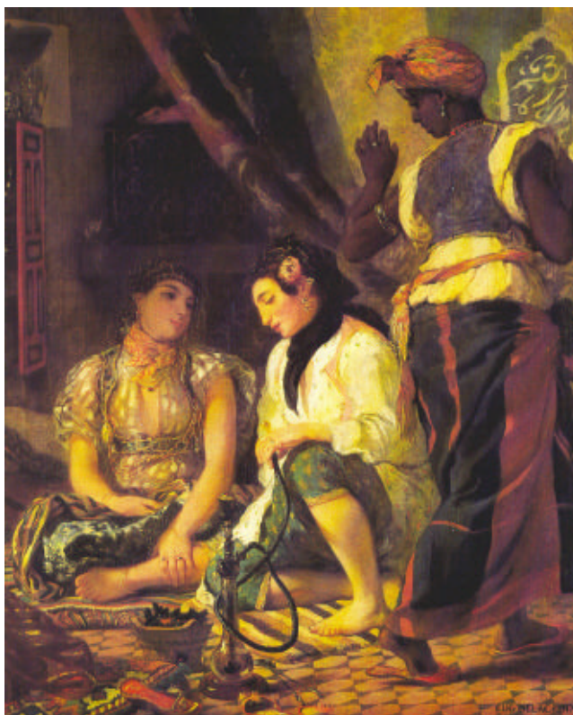
Femmes d'Alger dans leur appartement Eugène Delacroix 1834 (Detail)