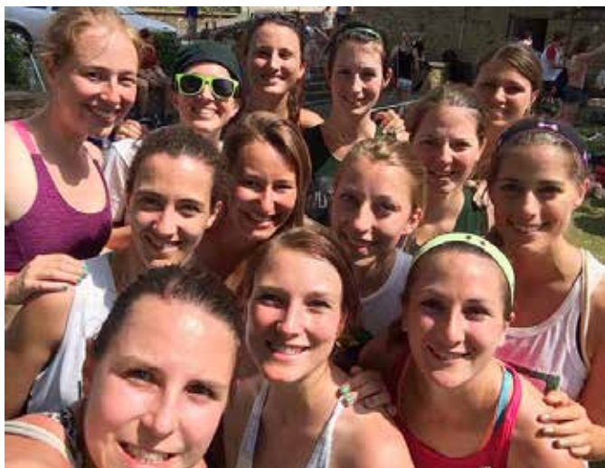
Die kaum weniger erfolgreichen Damen.