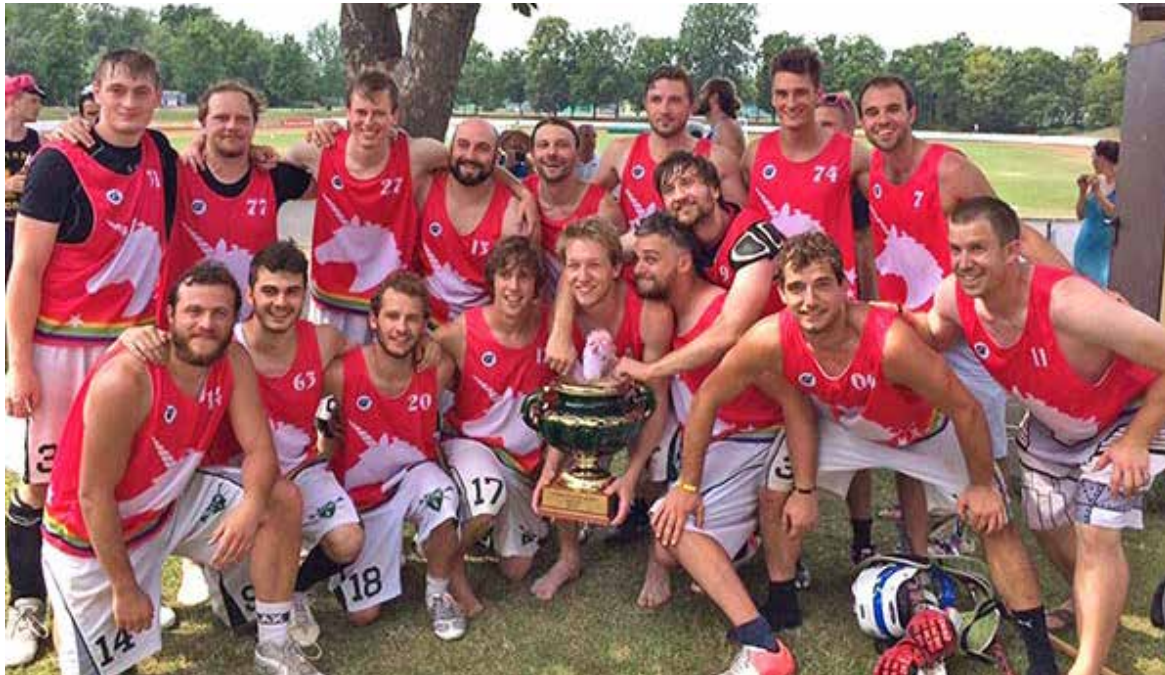
Das siegreiche Team der Männer.