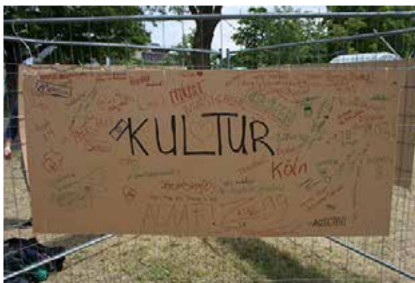
Holztafeln boten Raum für freie Assoziationen zu den Begriffen Heimat, Kultur und Identität.