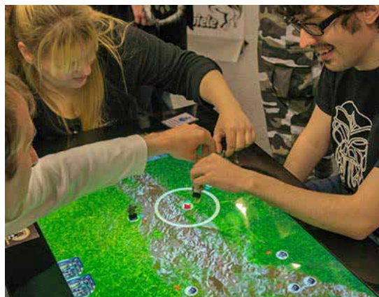
Der aktuelle Prototyp des Projekts XRoads: Ein Mixed-Reality Echtzeit-Brettspiel.

Beeinflussen die Flimmerfrequenzen von LEDs unsere Leistung? Wie können wir Büroarbeitskräfte mit und ohne den Einsatz von Technologie zu mehr Bewegung während der Arbeitszeit animieren? Können wir Menschen mit Sehbeeinträchtigung bei der Navigation in Gebäuden unterstützen? Beeinflusst das Farbschemata für ein sektorloses Radardisplay die Leistung von Fluglotsen? Bei den Abschlussarbeiten von Studierenden des Bachelor-Studiengangs Mensch-Computer-Systeme und des Master-Studiengangs Human-Computer-Interaction ist die Bandbreite der Themen groß.