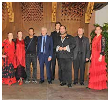
Mit Musikanten und Tänzern.