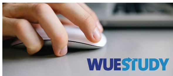
Geht im Sommersemester an den Start: WueStudy.

Am 8. Januar sollte das neue Campus-Managementsystem (CMS) „WueStudy“ in Betrieb gehen. Der Systemstart wurde in den zurückliegenden drei Wochen intensiv vorbereitet und getestet, SB@Home wurde deaktiviert. Nun ist jedoch klar: WueStudy 1.0 hat trotz der Anstrengungen des Projektteams nicht die Stabilität erreicht, die eine unwiderrufliche Umstellung auf das neue System vertretbar macht.