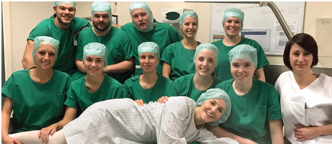
Die „OTA-Filmcrew“ am Set eines ihrer neuen Lehrvideos.