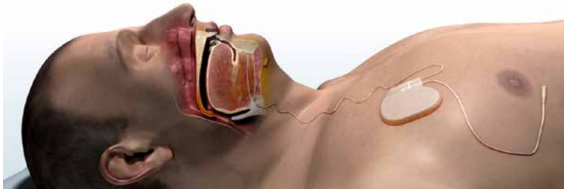
Ein Zungenschrittmacher hält im Schlaf die Atemwege offen.