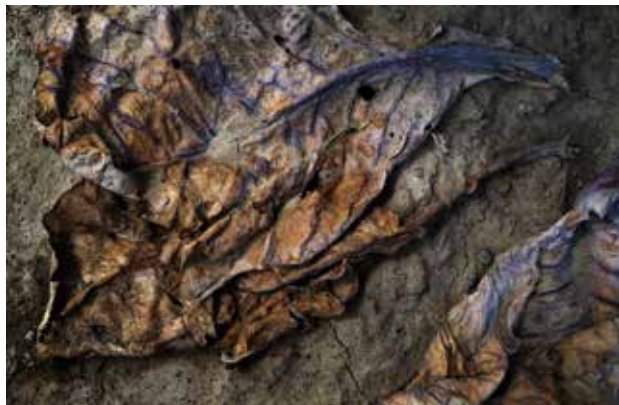
Vertrocknete Blaukrautblätter liegen im Hitzesommer 2018 auf dem ausgedörrten Boden eines Ackers.

Auch im Journalismus ist die Klimaveränderung ein großes Thema, das es immer wieder zu bebildern gilt. Ein brennender Wald, ausgetrocknete Flußbetten oder Menschen und Tiere, die unter der Hitze leiden – all das sind mögliche Motive, mit denen sich der Klimawandel fotografisch darstellen lässt.