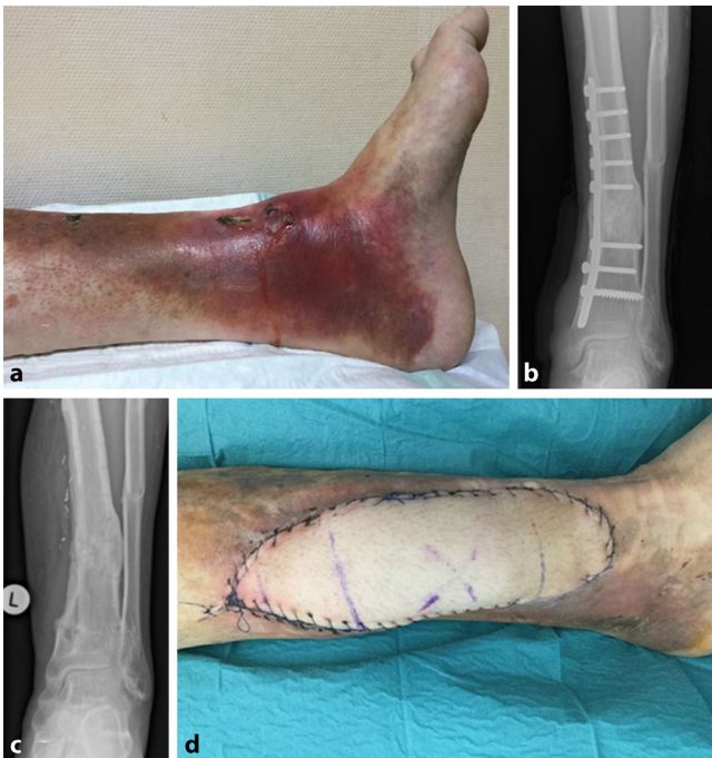
Abb. 3 ◀ Dokumentation einer chronischen Osteomyelitis (a, b; Fall Nr. 27), welche mit Débridement, Metallentfernung und Lappenplastik behandelt wurde. Defektgröße und Lappenindikation werden hiermit belegt (c, d)

gab es bei der Archivierung und Qualität der Fotos immer wieder Probleme. Wichtig ist eine konstante Qualität der Fotodokumentation, welche in Zukunft durch eine standardisierte Verfahrensanweisung weiter gesteigert werden kann [4, 5]. Hierfür ist die Entwicklung einer „standard operating procedure“ (SOP) mit definierten technischen Kriterien denkbar, wie z. B. gleichbleibendem Abstand und Winkel zum Objekt sowie einheitlicher Beleuchtung und abgebildeter Größenreferenz. Eine solche SOP wäre die Grundlage für die Anwendung einer automatisierten Auswertung (künstliche Intelligenz) und könnte die Abrechnung durch automatisierte Aus-