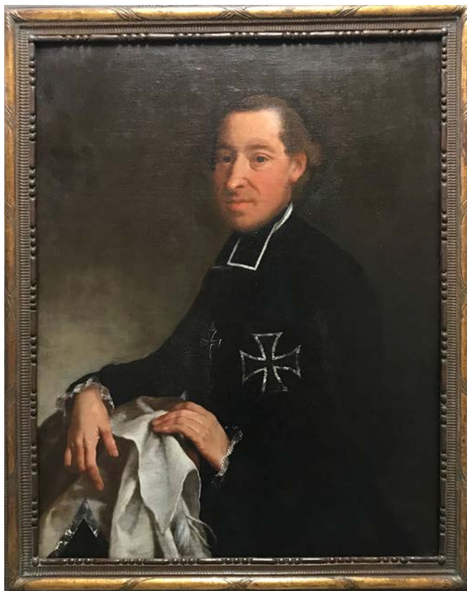
Wer mag dieser Deutschordenspriester gewesen sein? Dies versucht die Forschungsstelle Deutscher Orden jetzt herauszufinden.

https://www.uni-wuerzburg.de/forschung/deutscher-orden/startseite/