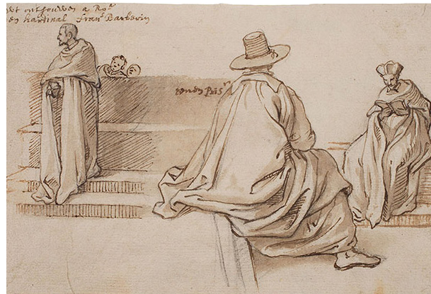
Darstellung des Kardinals Francesco Barberini.

Die Tagung in Würzburg befasst sich zum einen mit Peter van Lint als exemplarischem Fall der Künstlermigration zwischen den südlichen Niederlanden und Italien in der ersten Hälfte des 17. Jahrhunderts. Zum anderen untersucht sie die kulturell bedingten Faktoren der Stil- und Themenwahl seiner Zeichnerkollegen, zum Beispiel Marktmechanismen und Patronage.