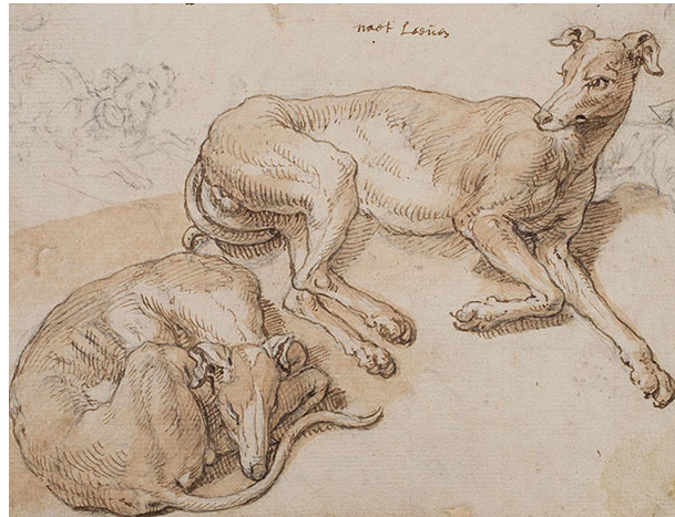
Zeichnerische Studie von zwei Hunden.

Tatsächlich sollte es van Lint als einer der wenigen flämischen Künstler seiner Zeit gelingen, eine ganze Kapelle in einer der bedeutendsten Kirchen Roms, Santa Maria del Popolo, auszumalen. Das tat er im Stil des damals modischen italienischen Barockklassizismus. Schon weil er dafür die Technik des Freskierens beherrschen musste, wären die meisten seiner niederländischen Kollegen dafür nicht in Frage gekommen.