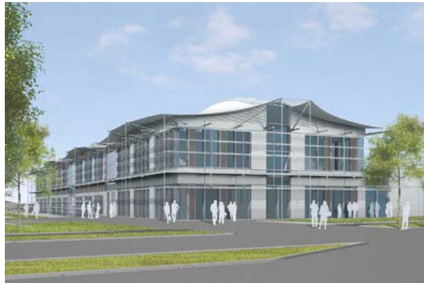
Das Energy Efficiency Center.