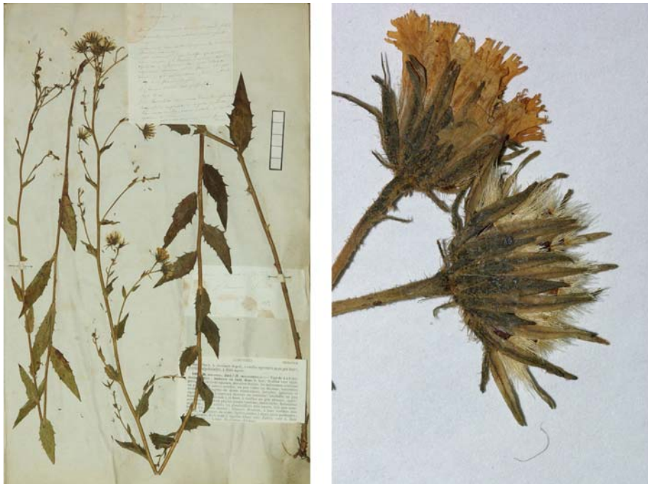
Fig. 98 Hieracium insuetum JORD. ex BOREAU, Fl. Centre France, ed. 3, 2: 396 (1857) – Ind. loc.: „Loire. St-Etienne (Jordan)“, Lectotypus, hoc loco designatus : „de St-Etienne (Loire), récolté dans mon jardin, 19 jul. 1853“, leg. et det. A. Jordan sub: Hieracium insuetum , ANG-Hb.Boreau.