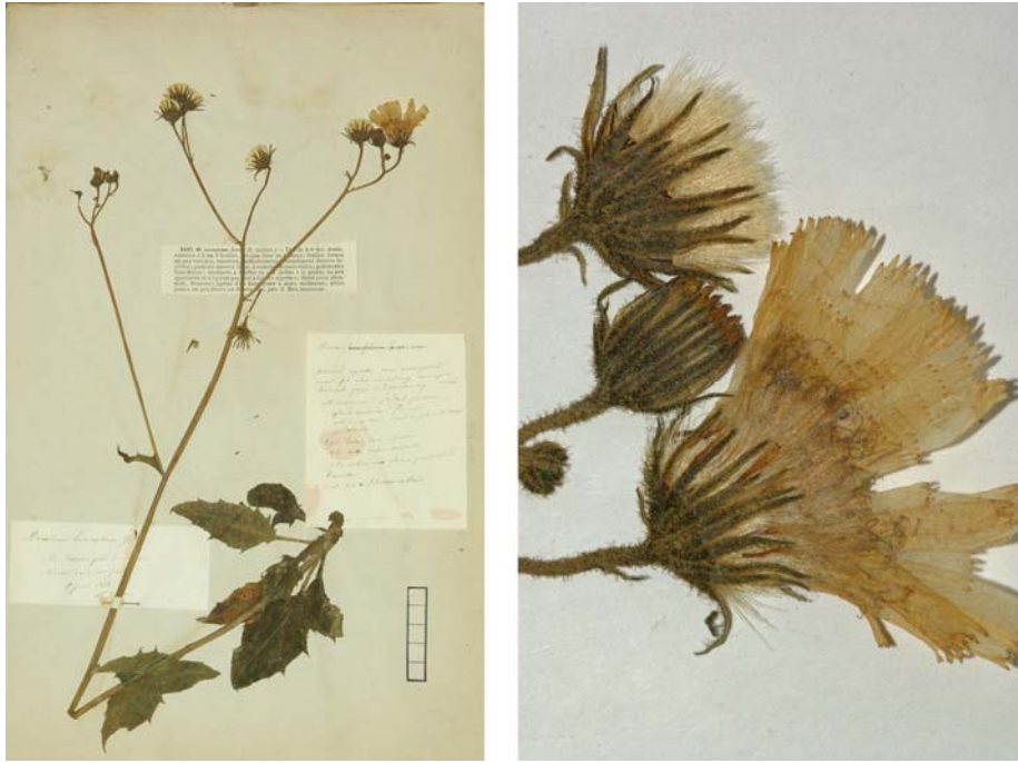
Fig. 103 Hieracium laceratum JORD. ex BOREAU, Fl. Centre France, ed. 3, 2: 406 (1857) – Ind. loc.: „Bois montueux“, Lectotypus, hoc loco designatus : „de Tassin près de Lyon, récolté dans mon jardin, 8 juin 1854“, leg. et det. A. Jordan sub: Hieracium laceratum , ANG-Hb.Boreau. ≡ Hieracium divisum [subsp. laevifrons ] var. laceratum (JORD. ex BOREAU) SUDRE, Hierac. Centre France, 66 (1902) ≡ Hieracium maculatum subsp. laceratum (JORD. ex BOREAU) ZAHN in ENGLER, Pflanzenr. 76: 514 (1921)