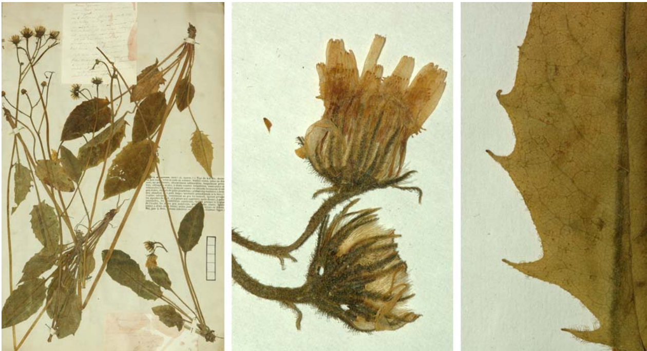
Fig. 174 Hieracium murorum [subsp. murorum mg. macrodon ] var. sparsum JORD. ex SUDRE, Hierac. Centre France, 73 (1902) – Ind. loc.: „Saint-Germain, près Lyon! (Jordan); Yonne, Mont-Dore, Vosges, Tarn; Maine-et-Loire: Saumur“, Lectotypus, hoc loco designatus: „de St-Germain près Lyon, récolté dans mon jardin, 8 juin [18]52“, leg. et det. A. Jordan sub: Hieracium sparsum , ANG-Hb.Boreau.