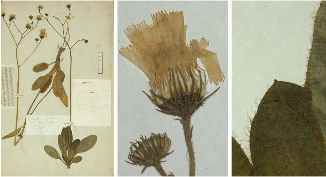
Fig. 19 Hieracium aspreticola JORD. ex BOREAU, Fl. Centre France, ed. 3, 2: 418 (1857) „ aspreticulum “ – Ind. loc.: „Bois montagneux“, Lectotypus, hoc loco designatus : „de Dardilly près Lyon, récolté dans mon jardin, juin 1853“, leg. et det. A. Jordan sub: Hieracium aspreticulum , ANG-Hb.Boreau.

≡ Hieracium verlotii var. aspreticola (JORD. ex BOREAU) ARV.-TOUV., Bull. Soc. Dauph. Éch. Pl. 1880: 287 (1880) „ aspreticulum “