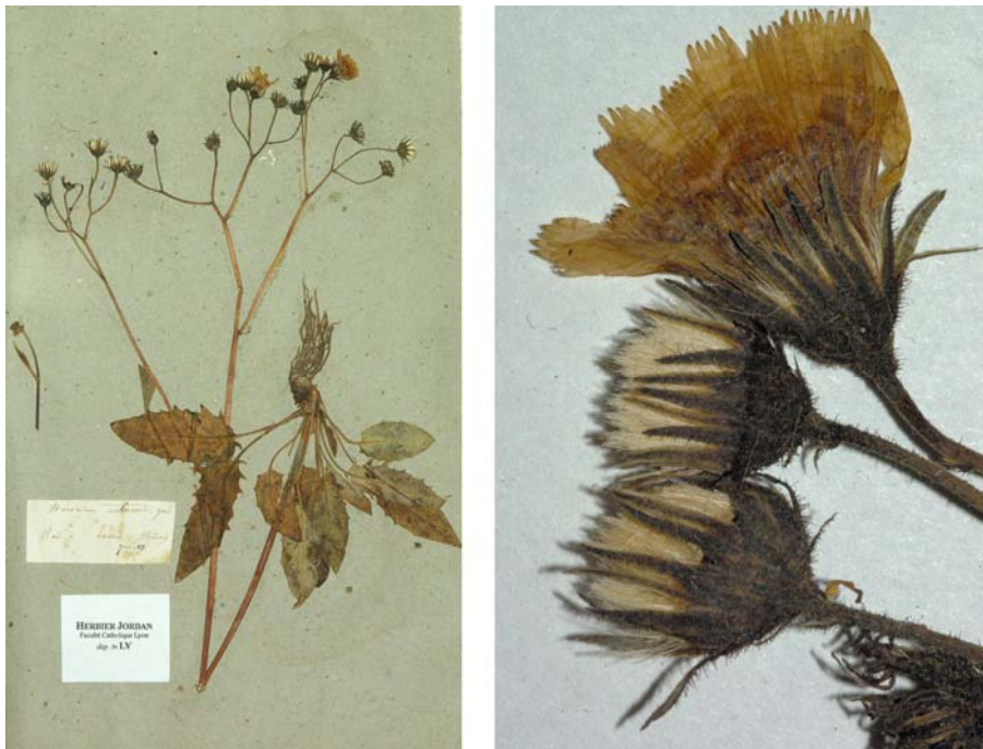
Fig. 165 Hieracium praecox [subsp. ovalifolium mg. vernum ] var. rubescens JORD. ex SUDRE, Hierac. Centre France, 83 (1902) – Ind. loc.: „Tassin, près de Lyon (Jordan)“, Lectotypus, hoc loco designatus : „Lyon à Tassin (Rhône), 9 juin 1851“, leg. et det. A. Jordan sub: Hieracium rubescens , ANG-Hb.Boreau.

≡ Hieracium fragile var. rubescens JORD. ex NYMAN, Suppl. Syll. Fl. Eur., 9 (1865), nom. nud.