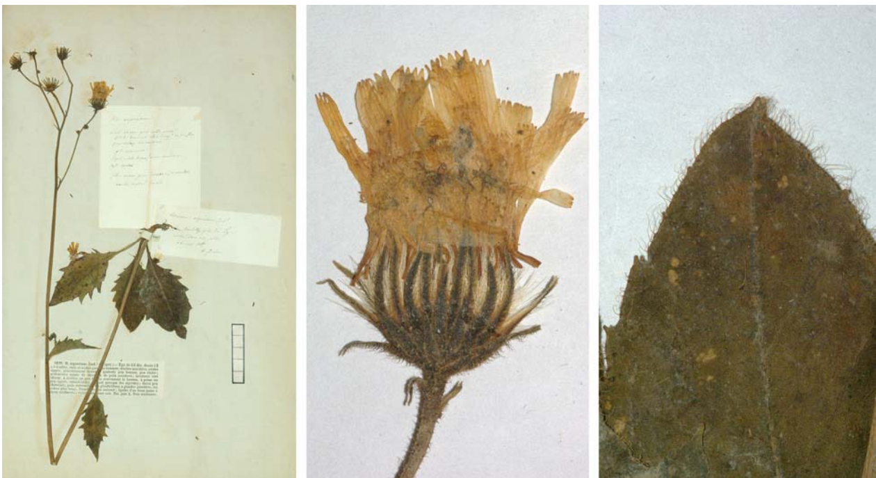
Fig. 16 Hieracium asperatum JORD. ex BOREAU, Fl. Centre France, ed. 3, 2: 406 (1857) – Ind. loc.: „Bois montueux”, Lectotypus, hoc loco designatus : „de Dardilly près de Lyon, récolté dans mon jardin, 24 mai 1855”, leg. et det. A. Jordan sub: Hieracium asperatum , ANG-Hb.Boreau. ≡ Hieracium vulgatum var. asperatum (JORD. ex BOREAU) ARV.-TOUV., Bull. Soc. Dauph. Éch. Pl. 1880: 288 (1880) ≡ Hieracium divisum [subsp. divisum ] mg. asperatum (JORD. ex BOREAU) SUDRE, Hierac. Centre France, 70 (1902) ≡ Hieracium murorum „forme“ asperatum (JORD. ex BOREAU) ROUY, Fl. France 9: 342 (1905) ≡ Hieracium maculatum subsp. asperatum (JORD. ex BOREAU) ZAHN in ENGLER, Pflanzenr. 76: 514 (1921)