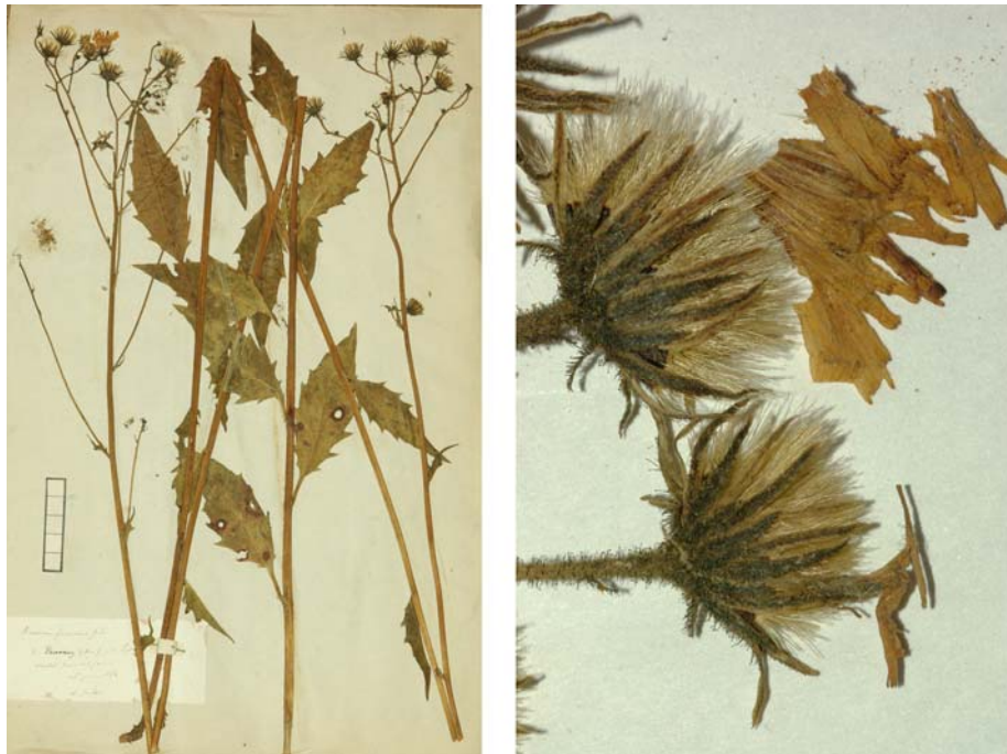
Fig. 86 Hieracium vulgatum [subsp. acuminatum ] subvar. fuscescens JORD. ex SUDRE, Hierac. Centre France, 53 (1902) – Ind. loc.: „Environs de Lyon (Jordan); Cher: forges de Vierzon (Déséglise); Cantal: Aurillac (Malvezin)“, Lectotypus, hoc loco designatus : „De Tramoy (Ain) près Lyon, récolté dans mon jardin, 25 juin 1854“, leg. et det. A. Jordan sub: Hieracium fuscescens , ANG-Hb.Boreau.