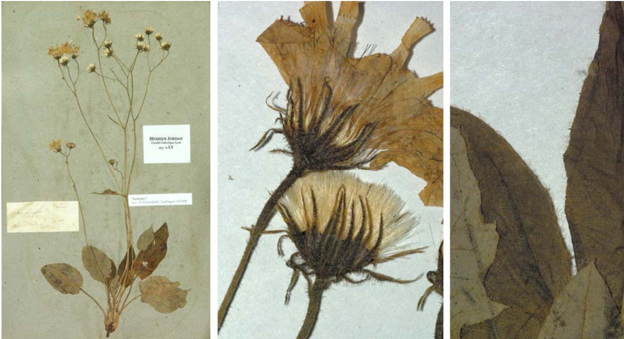
Fig. 127 Hieracium ovalifolium JORD., Obs. Pl. Crit. 7: 33 (1849) – Ind. loc.: „aux environs de Lyon“, Neotypus, hoc loco designatus : „Lyon à Ecully, 2 juin 1850“, leg. M. Timeroy, det. A. Jordan sub: Hieracium ovalifolium , LY-Hb.Jordan.

≡ Hieracium murorum var. ovalifolium (JORD.) GREN. & GODR., Fl. France, 373 (1850)