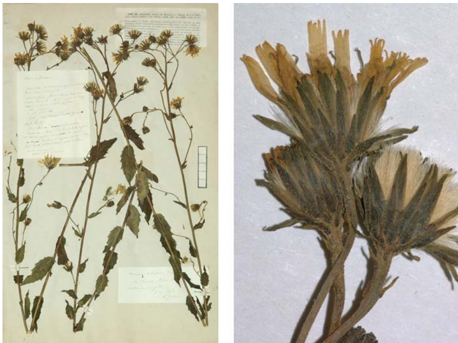
Fig. 184 Hieracium subrectum JORD. ex BOREAU, Fl. Centre France, ed. 3, 2: 387 (1857) – Ind. loc.: „Rhône. Tarare (Jordan)“, Lectotypus, hoc loco designatus : „de Tarare (Rhône), récolté dans mon jardin, 6 sept. 1854“, leg. et det. A. Jordan sub: Hieracium subrectum , ANG-Hb.Boreau.

≡ Hieracium praecox [subsp. cinerascens ] subvar. subolidum (JORD. ex BOREAU) ZAHN in ASCHERSON & GRAEBNER, Syn. Mitteleur. Fl. 12/2: 299 (1931)