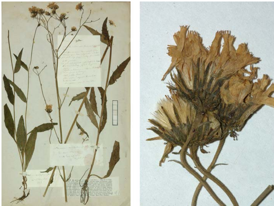
Fig. 22 Hieracium auristylum JORD. ex BOREAU, Fl. Centre France, ed. 3, 2: 393 (1857) – Ind. loc.: „Loire. Mont-Pilat (Jordan)“, Lectotypus, hoc loco designatus : „de Mont-Pilat (Loire), récolté dans mon jardin, 20 jul 1854“, leg. et det. A. Jordan sub: Hieracium auristylum , ANG-Hb.Boreau.

≡ Hieracium maculatum [subsp. divisum ] var. aurelianense (JORD. ex BOREAU) ZAHN in ENGLER, Pflanzenr. 76: 516 (1921)