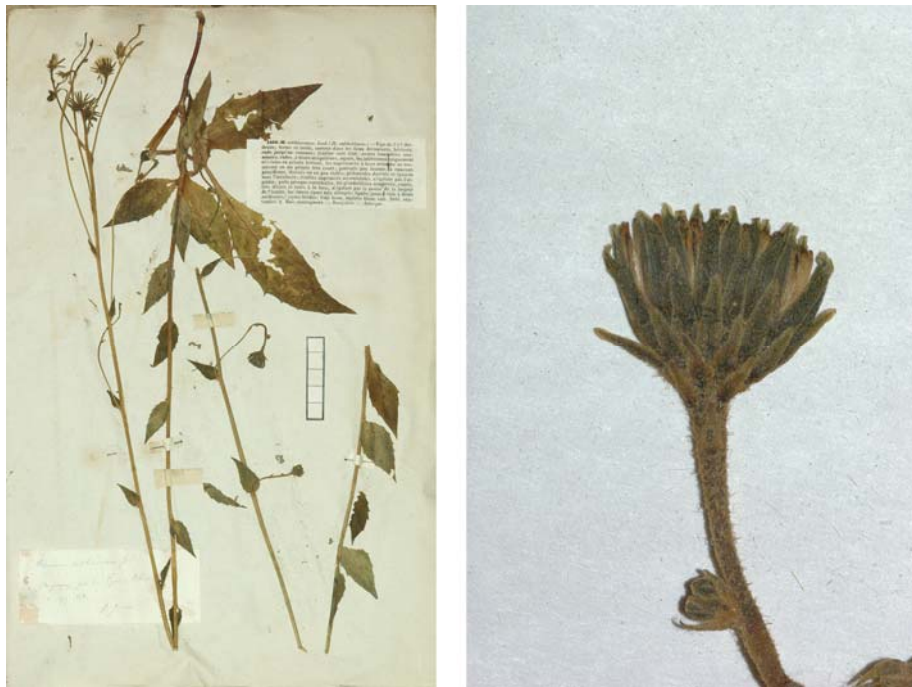
Fig. 181 Hieracium subhirsutum JORD. ex BOREAU, Fl. Centre France, ed. 3, 2: 384 (1857) – Ind. loc.: „Beaujolais. Auvergne“, Lectotypus, hoc loco designatus: „Vaugneray près de Lyon (Rhône), 9 sept. 1852“, leg. et det. A. Jordan sub: Hieracium subhirsutum , ANG-Hb.Boreau.