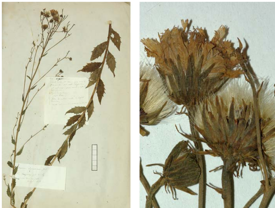
Fig. 20 Hieracium boreale [subsp. quercetorum ] var. aspretorum JORD. ex SUDRE, Hierac. Centre France, 29 (1902) – Ind. loc.: „Vaugneray, près Lyon (Jordan); Tarn: Mazamet, vallée de l’Arnette“, Lectotypus, hoc loco designatus : „de Vaugneray près de Lyon, récolté dans mon jardin, 9 sept. 1854“, leg. et det. A. Jordan sub: Hieracium aspretorum , ANG-Hb.Boreau.

≡ Hieracium murorum subsp. aspreticola (JORD. ex BOREAU) ZAHN in ENGLER, Pflanzenr. 76: 324 (1921) „ aspreticulum “