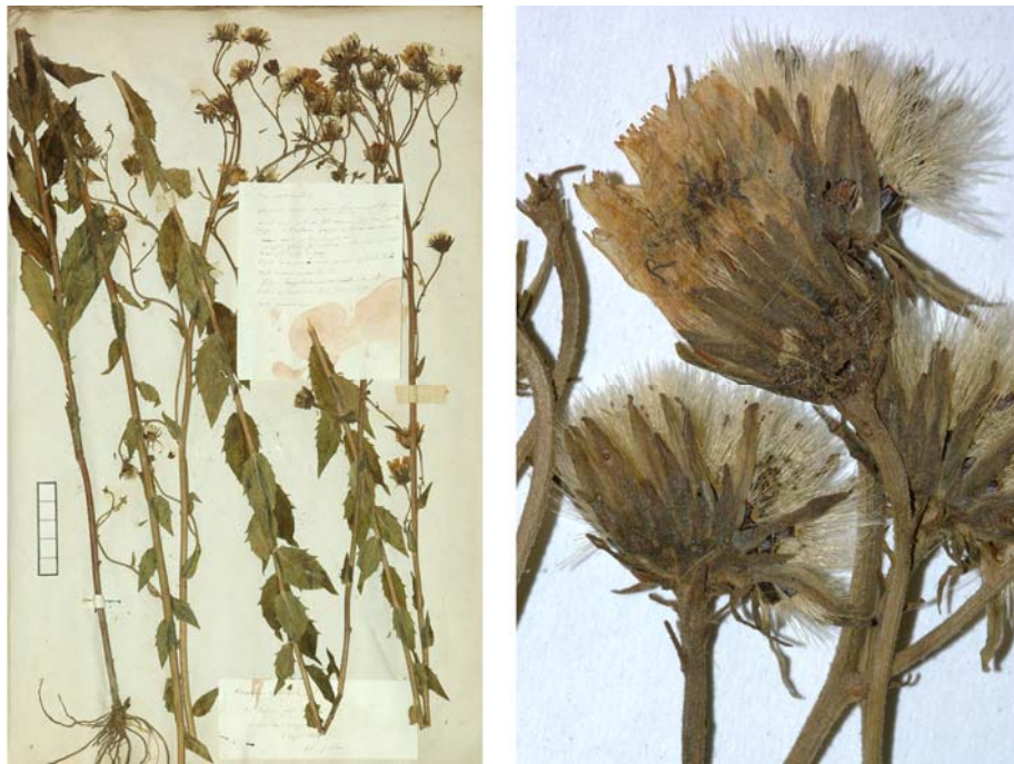
Fig. 157 Hieracium boreale [subsp. virgultorum mg. eminens ] var. recticaule JORD. ex SUDRE, Hierac. Centre France, 26 (1902) – Ind. loc.: „Néron, près Lyon (Jordan)“, Lectotypus, hoc loco designatus : „de Néron près de Lyon, récolté dans mon jardin, 2 sept. 1854“, leg. et det. A. Jordan sub: Hieracium recticaule , ANG-Hb.Boreau. ≡ Hieracium sabaudum [subsp. lugdunense ] var. recticaule (JORD. ex SUDRE) ZAHN in ENGLER, Pflanzenr. 79: 948 (1922)