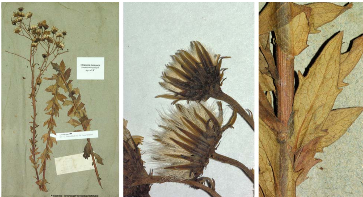
Fig. 94 Hieracium umbellatum subsp. ilicetorum JORD. ex SUDRE, Hierac. Centre France, 13 (1902) – Ind. loc.: „Gard: Lieux arides, à Jonquières (Jordan), à Saint-Romans (Perrier in herb. Sudre), etc.“, Neotypus, hoc loco designatus : „de Jonquière, m.j. [mon jardin], 3 oct. 1855“, leg. et det. A. Jordan sub: „ Hier. [unreadable, not ilicetorum ]“, LY-Hb.Jordan.

≡ Hieracium sabaudum [subsp. occitanicum ] var. hypselocaulon (JORD. ex SUDRE) ZAHN in ASCHERSON & GRAEBNER, Syn. Mitteleur. Fl. 12/3: 538 (1938)