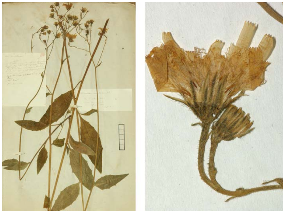
Fig. 100 Hieracium vulgatum [subsp. deductum ] subvar. inumbratum JORD. ex SUDRE, Hierac. Centre France, 57 (1902) – Ind. loc.: „Isère: Pontchéri (Jordan); Loire“, Lectotypus, hoc loco designatus: „de Pontchéri (Isère), récolté dans mon jardin, 25 juin 1854“, leg. et det. A. Jordan sub: Hieracium inumbratum , ANG-Hb.Boreau.

≡ Hieracium maculatum subsp. intersitum (JORD. ex BOREAU) GREUTER, Willdenowia 37: 165 (2007)