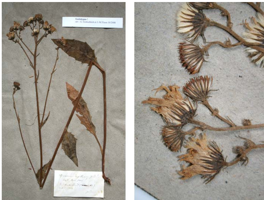
Fig. 14 Hieracium argillaceum JORD., Cat. Graines Jard. Bot. Grenoble, 17 (1849) – Ind. loc.: „Vaugneray, Montriblout etc., prope Lyon”, Lectotypus, hoc loco designatus : „de Montriblout (Ain), cult. 1849“, leg. et det. A. Jordan sub: Hieracium argillaceum , LY-Hb.Jordan.