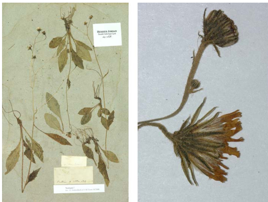
Fig. 58 Hieracium divisum JORD., Cat. Gr. Jard. Dijon, 21 (1848) – Ind. loc.: „in nemorosis et rupestribus graniticis prope Lyon: Oullins! Francheville! etc.“ Neotypus, hoc loco designatus : „Oullins, 9 octobre 1849“, leg. et det. A. Jordan sub: Hieracium divisum , LY-Hb.Jordan.

≡ Hieracium praecox [subsp. ovalifolium ] subvar. divergens (JORD. ex BOREAU) ZAHN in ENGLER, Pflanzenr. 75: 235 (1921)