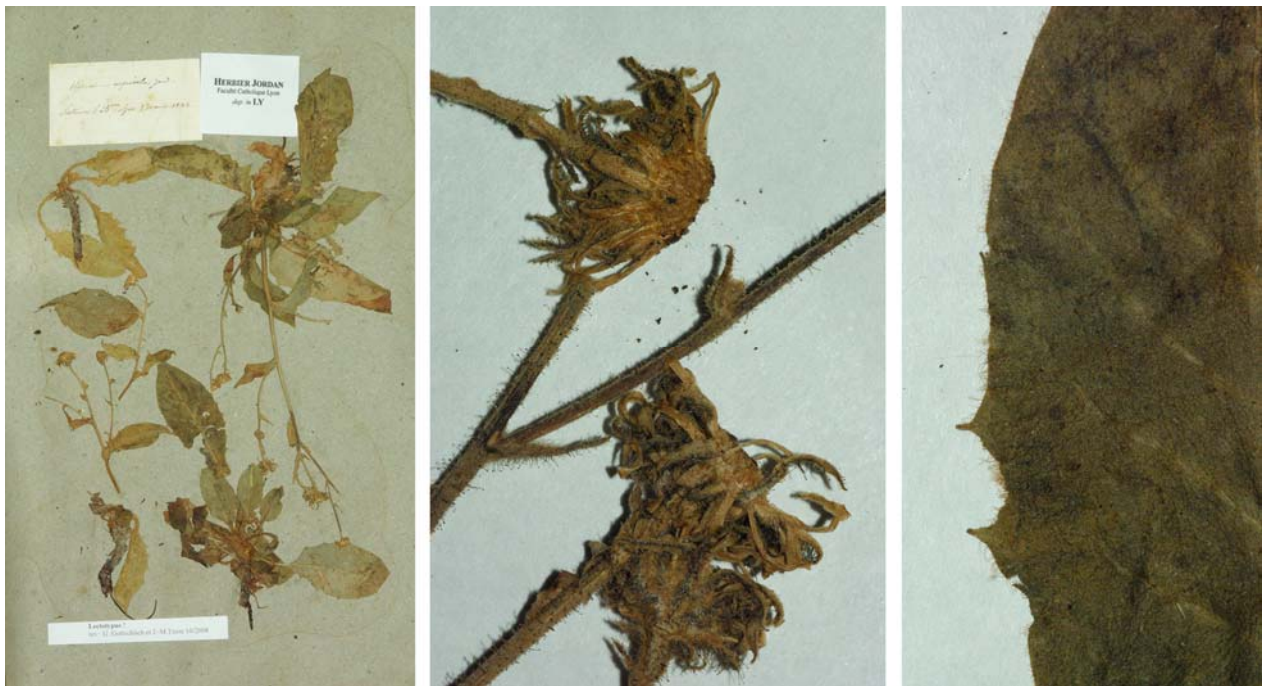
Fig. 166 Hieracium rupicola JORD., Cat. Gr. Jard. Dijon, 24 (1848) – Ind. loc.: „in rupestribus calcareis Galloprovinciae prope Sisteron. (Basses-Alpes)“, Lectotypus, hoc loco designatus : „Sisteron (Basses-Alpes), 30 août 1845“, leg. et det. A. Jordan sub: Hieracium rupicola , LY-Hb.Jordan.

= Hieracium praecox subsp. gougetianum (GREN. & GODR.) ZAHN in ENGLER, Pflanzenr. 76: 232 (1921)