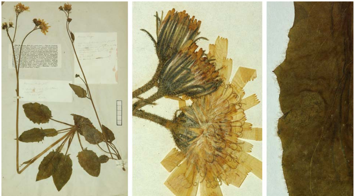
Fig. 31 Hieracium brevipes JORD. ex BOREAU, Fl. Centre France, ed. 3, 2: 412 (1857) – Ind. loc.: „Mont-Dore. Le Cher? Deux-Sèvres“ Lectotypus, hoc loco designatus: „de Charbonnière près de Lyon (Rhône), récolté dans mon jardin, mai 1855“, leg. et det. A. Jordan sub: Hieracium brevipes , ANG-Hb.Boreau.

≡ Hieracium praecox [subsp. ovalifolium mg. vernum ] var. brevipes (JORD. ex BOREAU) SUDRE, Hierac. Centre France, 82 (1902)