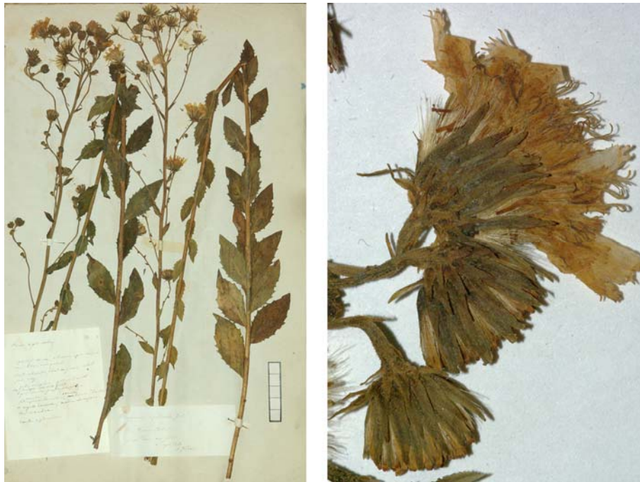
Fig. 162 Hieracium boreale [subsp. virgultorum mg. vagum ] var. rigidicaule JORD. ex SUDRE, Hierac. Centre France, 28 (1902) – Ind. loc.: „Isère: Voiron (Jordan)“, Lectotypus, hoc loco designatus : „de Voiron (Isère), récolté dans mon jardin, 2 sept. 1854“, leg. et det. A. Jordan sub: Hieracium rigidicaule , ANG-Hb.Boreau.

= Hieracium laevigatum subsp. laevigatum sensu ZAHN in ENGLER, Pflanzenr. 7: 893 (1922)