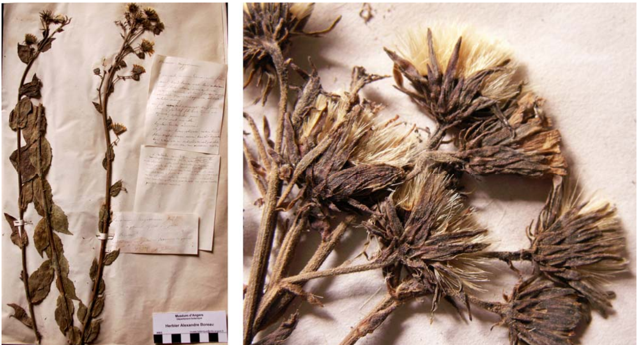
Fig. 192 Hieracium boreale [subsp. dumosum ] var. tergestinum JORD. ex SUDRE, Hierac. Centre France, 16 (1902) – Ind. loc.: „Trieste (Jordan)“, Lectotypus, hoc loco designatus: „in nemorosis circa Tergestum“, leg. et det. M. Tommasini sub: Hieracium sabaudum , rev. A. Jordan sub: Hieracium tergestinum , ANG-Hb.Boreau.

≡ Hieracium murorum [subsp. neosparsum ] var. tenuipes (JORD. ex SUDRE) ZAHN in ENGLER, Pflanzenr. 76: 312 (1921)