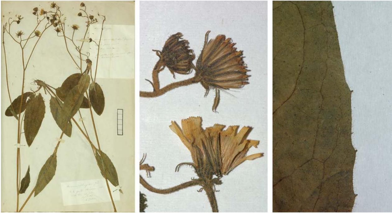
Fig. 121 Hieracium vulgatum [subsp. argillaceum mg. festinum var. erubescens ] subvar. oblongatum JORD. ex SUDRE, Hierac. Centre France, 56 (1902) – Ind. loc.: „Isère: Grande-Chartreuse (Jordan)“, Lectotypus, hoc loco designatus: „de la grande Chartreuse (Isère), récolté dans mon jardin, 5 juin 1854“, leg. et det. A. Jordan sub: Hieracium oblongatum , ANG-Hb.Boreau.