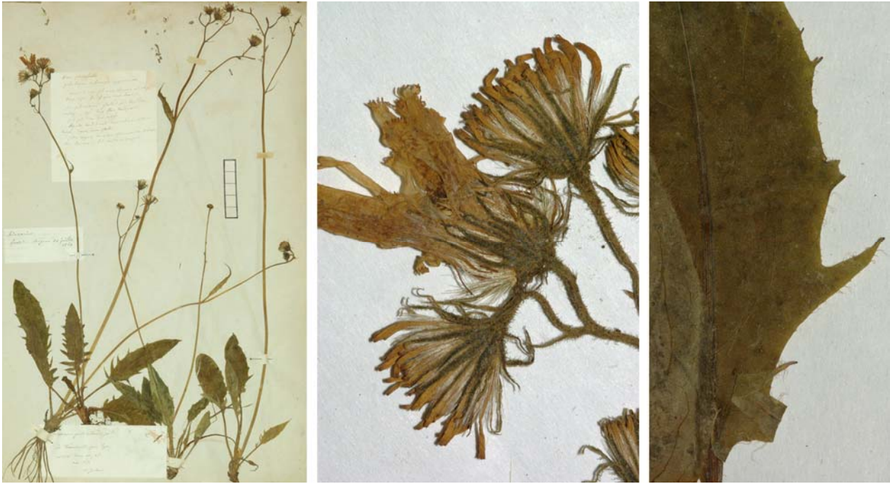
Fig. 145 Hieracium praecox [subsp. fragile mg. glaucinum ] var. pinicola JORD. ex SUDRE, Hierac. Centre France, 86 (1902) „ piniculum “ – Ind. loc.: „Francheville, près Lyon (Jordan); forêt du Mézenc; Loire: Pierre-sur-Haute, Saint-Etienne, etc.“, Lectotypus, hoc loco designatus : „de Francheville près Lyon, récolté dans mon jardin, mai 1854“, leg. et det. A. Jordan sub: Hieracium piniculum , ANG-Hb.Boreau.

≡ Hieracium fragile var. pinicola (JORD. ex SUDRE) ROUY, Fl. France 9: 332 (1905) „ piniculum “