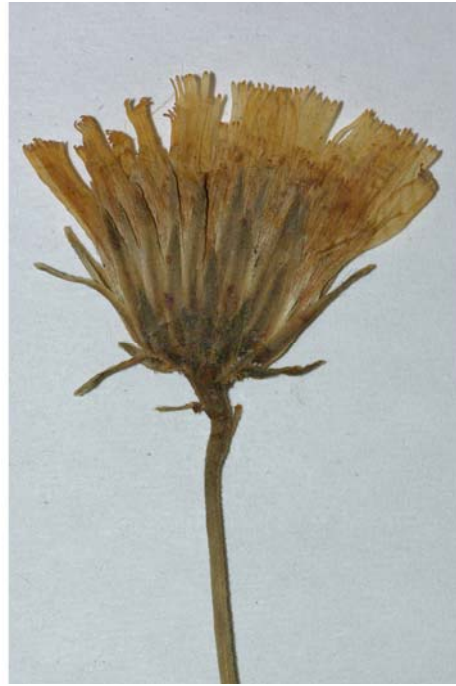
Fig. 133 Hieracium rigidum [subsp. tridentatum mg. gracilipes var. lotharingum ] subvar. patulum JORD. ex SUDRE, Hierac. Centre France, 37 (1902) – Ind. loc.: „Vosges: Hoheneck“, Lectotypus, hoc loco designatus : „du Mt Honeck (Vosges), récolté dans mon jardin, jul. [18]54“, leg. et det. A. Jordan sub: Hieracium patulum , ANG-Hb.Boreau.