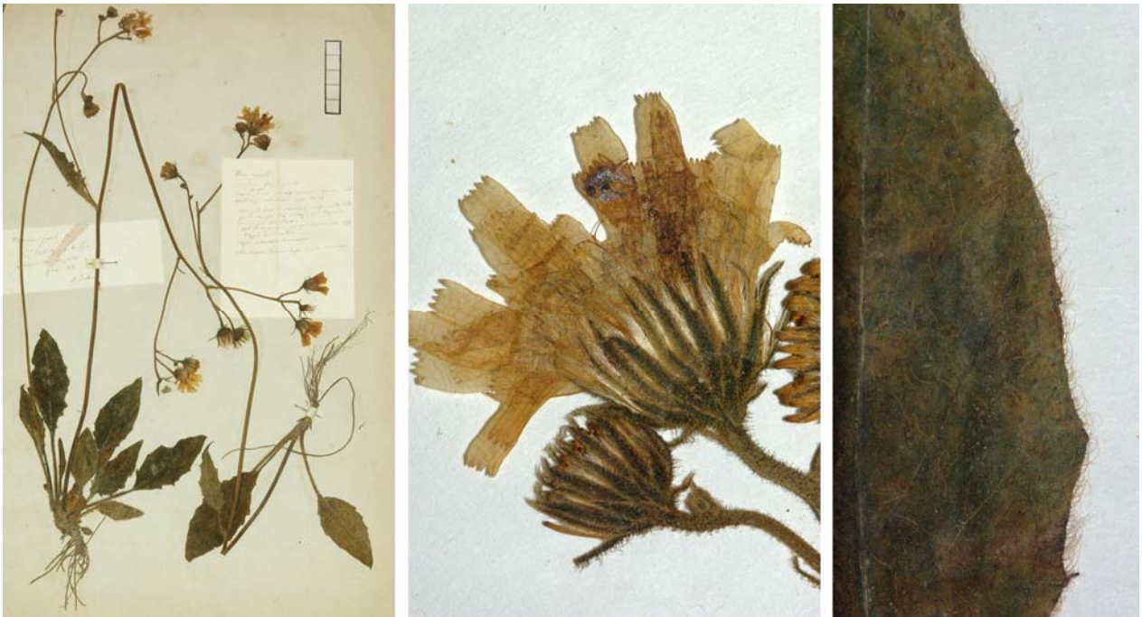
Fig. 130 Hieracium praecox [subsp. ovalifolium mg. bounophilum ] subvar. parile JORD. ex SUDRE, Hierac. Centre France, 84 (1902) – Ind. loc.: „Dardilly, près Lyon (Jordan)“, Lectotypus, hoc loco designatus : „de Dardilly près de Lyon, récolté dans mon jardin, mai 1854“, leg. et det. A. Jordan sub: Hieracium parile , ANG-Hb.Boreau.