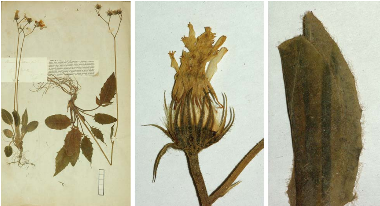
Fig. 84 Hieracium furcillatum JORD. ex BOREAU, Fl. Centre France, ed. 3, 2: 413 (1857) – Ind. loc.: „Bois“, Lectotypus, hoc loco designatus : „Lyon à Dardilly, 9 juin 1851“, left specimen (bearing Jordan’s label), leg. et det. A. Jordan sub: Hieracium furcillatum , ANG-Hb.Boreau. [The choice of a particular specimen is necessary since the two plants attached on the sheet belong to two distinct taxa [left (bearing Jordan’s label) = H. cinerascens , right = H. glaucinum ]. Taking in account the place of the label, features given in the protologue (leaves hairy...) and further specimens sent by A. Jordan himself to C. Arvet-Touvet (GRM-Arv.-Touv.!), Jordan’s view of the taxon indeed fits with H. cinerascens .]

≡ Hieracium maculatum [subsp. arrectarium ] var. funerum (JORD. ex SUDRE) ZAHN in ENGLER, Pflanzenr. 76: 520 (1921)