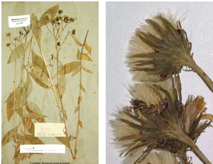
Fig. 160 Hieracium rigens JORD., Cat. Graines Jard. Bot. Grenoble 20 (-21) (1849) – Ind. loc.: „in sylvaticis montium graniticarum: Francheville! Soucieux! etc., prope Lyon“, Lectotypus, hoc loco designatus : „Bonand [currently Beaunant, in the city of Francheville], 9 octobre 1849“, leg. et det. A. Jordan sub: Hieracium rigens , LY-Hb.Jordan.