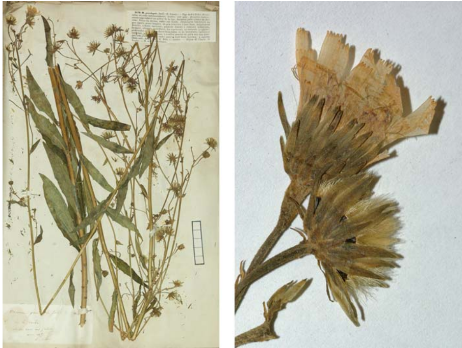
Fig. 149 Hieracium pseudopsis JORD. ex BOREAU, Fl. Centre France, ed. 3, 2: 390 (1857) – Ind. loc.: „Région de l’Ouest, la Vendée. M[aine]-et-L[oire] Chalennes“, Lectotypus, hoc loco designatus : „de la Vendée, récolté dans mon jardin, août 1855“, leg. et det. A. Jordan sub: Hieracium pseudopsis , ANG-Hb.Boreau. ≡ Hieracium aestivale subsp. pseudopsis (JORD. ex BOREAU) NYMAN, Suppl. Syll. Fl. Eur., 8 (1865) = Hieracium umbellatum var. pubescens SUDRE, Hierac. Centre France, 12 (1902) p. p.