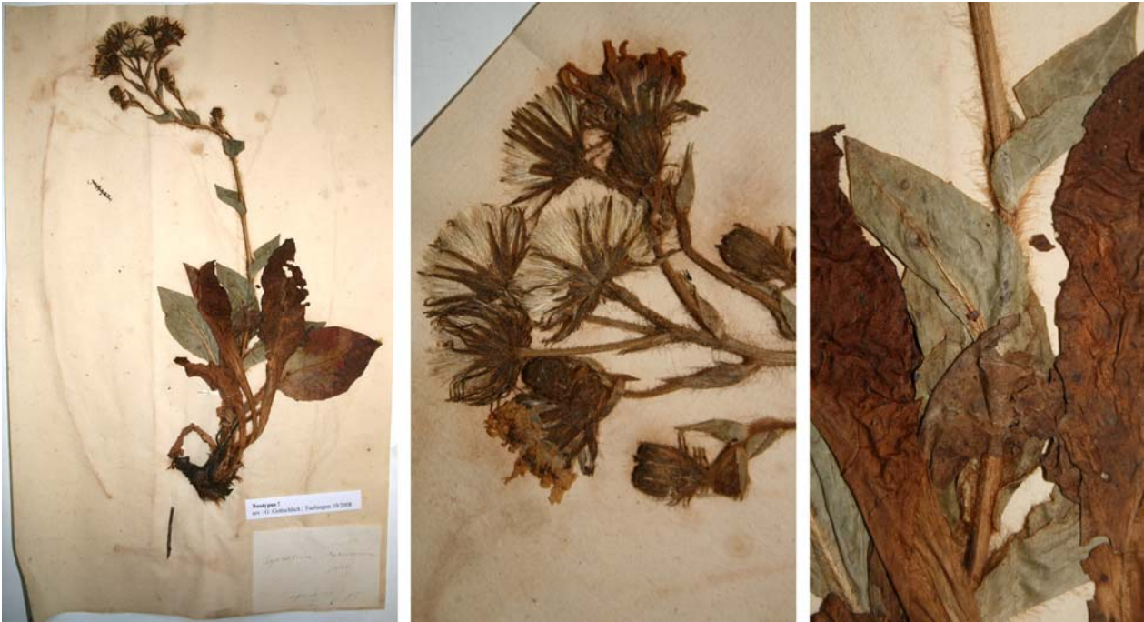
Fig. 151 Hieracium pyrenaicum JORD., Obs. Pl. Crit. 7: 37 (1849) nom. illeg. [non L. 1753] – Ind. loc.: „à St-Sauveur, à Barrèges, à Bagnères-de-Bigorre et aux Eaux-Bonnes“, Neotypus, hoc loco designatus : „Bagn de B“ [date unreadable], LY-Hb.Jordan.

= Hieracium nobile GREN. & GODR., Fl. France, 376 (1850)