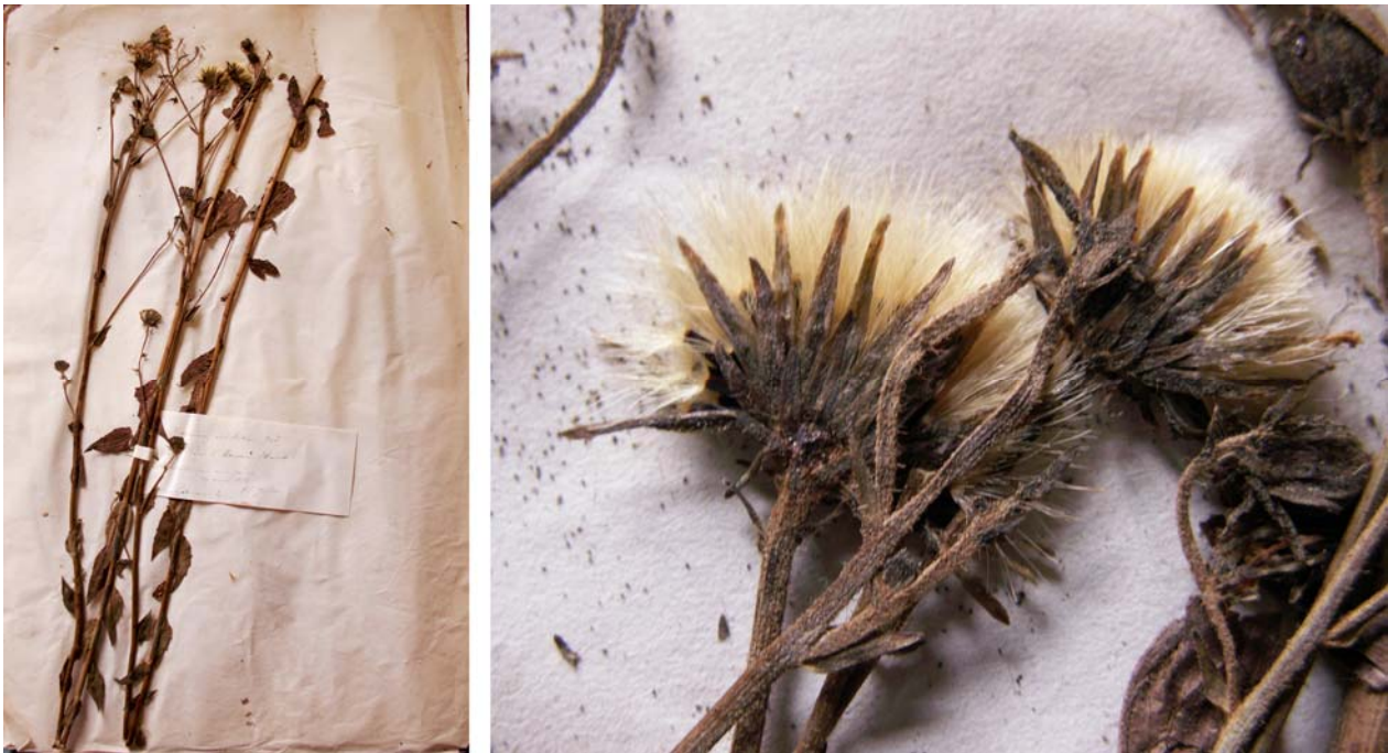
Fig. 96 Hieracium indolatum JORD. ex BOREAU, Fl. Centre France, ed. 3, 2: 385 (1857) – Ind. loc.: „Ind[re]. Coteaux de la Creuse“, Lectotypus, hoc loco designatus : „de Pont-à-Mousson (Meurthe), récolté dans mon jardin, 29 août 1854, vient également à Lyon“, leg. et det. A. Jordan sub: Hieracium indolatum , ANG-Hb.Boreau.