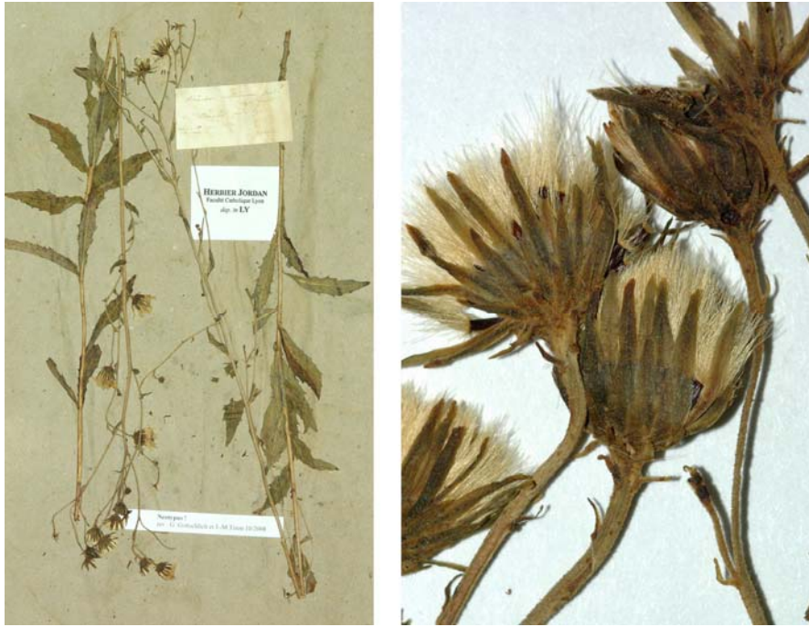
Fig. 43 Hieracium concinnum JORD., Cat. Graines Jard. Bot. Grenoble, 17 (-18) (1849) – Ind. loc.: „in sylvaticis collium praesertim graniticarum: Francheville! etc., prope Lyon“ Neotypus, hoc loco designatus: „de Bonand près Lyon, colui ex semin., 2 sept. 1852”, leg. et det. A. Jordan sub: Hieracium concinnum , LY-Hb.Jordan.

≡ Hieracium boreale var. concinnum (JORD.) GREN. & GODR., Fl. France, 385 (1850)