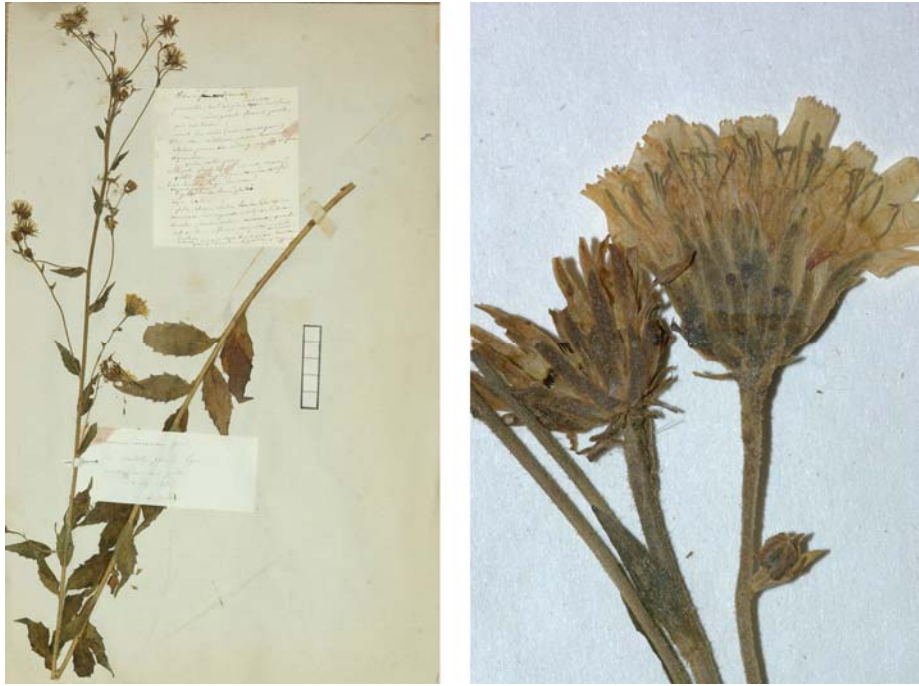
Fig. 25 Hieracium boreale [subsp. virgultorum mg. vagum var. vagum ] subvar. aviorum JORD. ex SUDRE, Hierac. Centre France, 28 (1902) – Ind. loc.: „Dardilly, près Lyon (Jordan)“, Lectotypus, hoc loco designatus: „de Dardilly près de Lyon, récolté dans mon jardin, 2 sept. 1854“ „leg. et det. A. Jordan sub: Hieracium aviorum “, ANG-Hb.Boreau. ≡ Hieracium sabaudum [subsp. vagum ] f. aviorum (JORD. ex SUDRE) ZAHN in ENGLER, Pflanzenr. 79: 953 (1922) ≡ Hieracium sabaudum [subsp. vagum ] subvar. aviorum (JORD. ex SUDRE) ZAHN in ASCHERSON & GRAEBNER, Syn. Mitteleur. Fl. 12/3: 553 (1938)