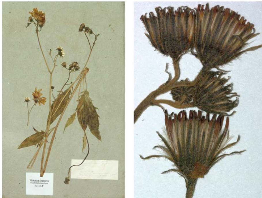
Fig. 47 Hieracium cruentum JORD., Cat. Graines Jard. Bot. Grenoble, 18 (1849) – Ind. loc.: „in nemorosis et rupestribus montium graniticarum: Charbonnière! Soucieux! Alix! etc. prope Lyon, in Valesia (Thomas)“ Neotypus, hoc loco designatus : „de Charbonnière, 20 mai [18]56“, leg. et det. A. Jordan sub: Hieracium cruentum , LY-Hb.Jordan. ≡ Hieracium vulgatum var. cruentum (JORD.) ARV.-TOUV., Bull. Soc. Dauph. Éch. Pl. 1880: 288 (1880) ≡ Hieracium sylvaticum var. cruentum (JORD.) GREN. & GODR., Fl. France, 375 (1850) ≡ Hieracium divisum [subsp. laevifrons ] mg. cruentum (JORD.) SUDRE, Hierac. Centre France, 67 (1902) ≡ Hieracium divisum var. cruentum (JORD. ex BOREAU) ROUY, Fl. France 9: 345 (1905) ≡ Hieracium divisum subsp. cruentum (JORD. ex BOREAU) ZAHN in SCHINZ & KELLER, Fl. Schweiz, ed. 2, 2: 288 (1905) ≡ Hieracium maculatum subsp. cruentum (JORD. ex BOREAU) ZAHN in ENGLER, Pflanzenz. 76: 518 (1921)