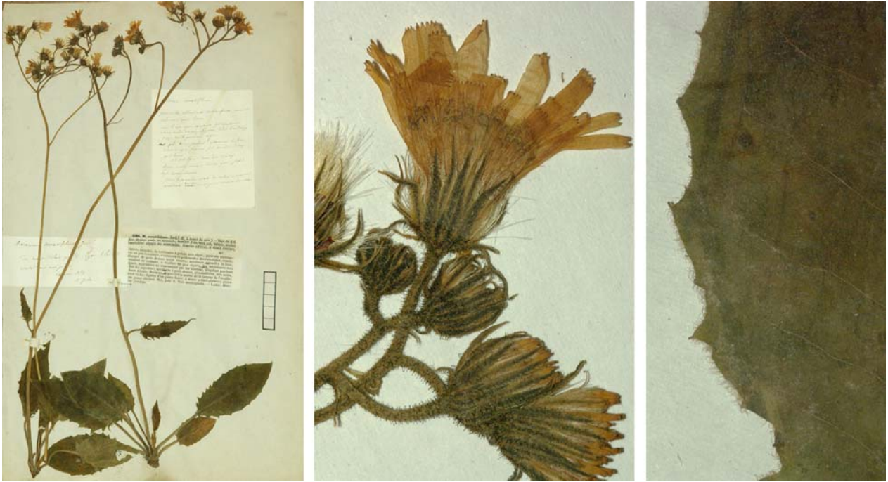
Fig. 171 Hieracium serratifolium JORD. ex BOREAU, Fl. Centre France, ed. 3, 2: 417 (1857) – Ind. loc.: „Loire. Mont-Pilat (Jordan)“, Lectotypus, hoc loco designatus : „du Mont Pilat près de Lyon (Loire), récolté dans mon jardin, 16 mai 1854“, leg. et det. A. Jordan sub: Hieracium serratifolium , ANG-Hb.Boreau.

≡ Hieracium murorum var. serratifolium (JORD. ex BOREAU) ARV.-TOUV., Bull. Soc. Dauph. Éch. Pl. 1880: 287 (1880)