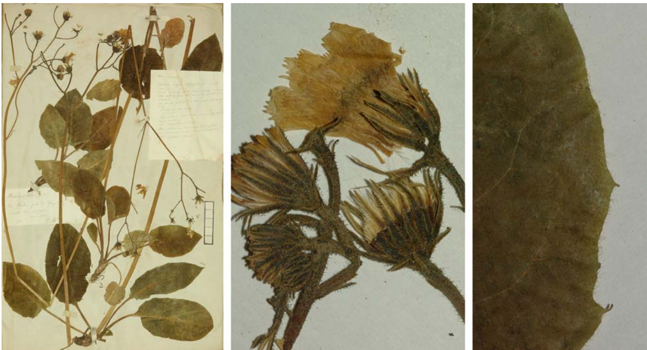
Fig. 202 Hieracium murorum [subsp. exotericum mg. cardiophyllum ] var. virens JORD. ex SUDRE, Hierac. Centre France, 75 (1902) – Ind. loc.: „Rabou! près Gap (Jordan); Cher: Chapelle Saint-Ursin (sub nom H. prasinifolii non Jord!)“, Lectotypus, hoc loco designatus : „de Rabou près Gap (H tes . Alp.), récolté dans mon jardin, mai 1853“, leg. et det. A. Jordan sub: Hieracium virens , ANG-Hb.Boreau.