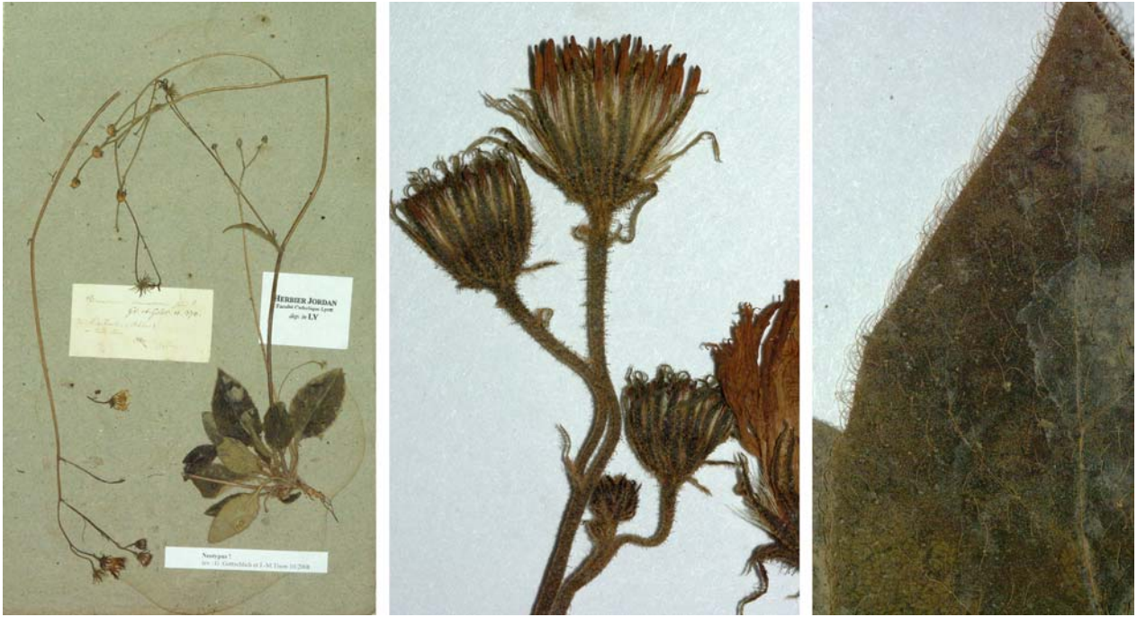
Fig. 39 Hieracium cinerascens JORD., Cat. Graines Jard. Bot. Grenoble, 17 (1849) – Ind. loc.: „in silvis montosis regionum graniticarum: l'Arbresle! etc. prope Lyon“ Neotypus, hoc loco designatus: „de L'arbresle (Rhône), in hort. lect.“, s.d., leg. et det. A. Jordan sub: H. cinerascens , LY-Hb.Jordan.