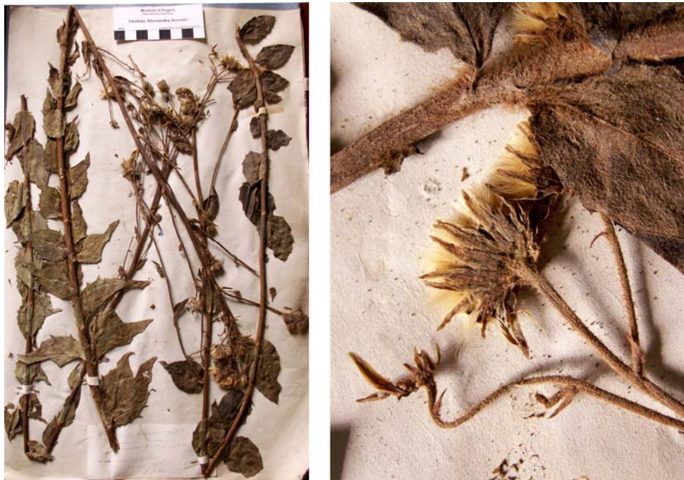
Fig. 68 Hieracium boreale [subsp. dumosum ] var. erythrocaulon JORD. ex SUDRE, Hierac. Centre France, 16 (1902) – Ind. loc.: „Patrie inconnue“, Lectotypus, hoc loco designatus : „récolté dans mon jardin, 12 sept. 1853“, leg. et det. A. Jordan sub: Hieracium erythrocaulon , ANG-Hb.Boreau.

≡ Hieracium levicaule subsp. erubescens (JORD. ex BOREAU) GREUTER, Willdenowia 37: 162 (2007)