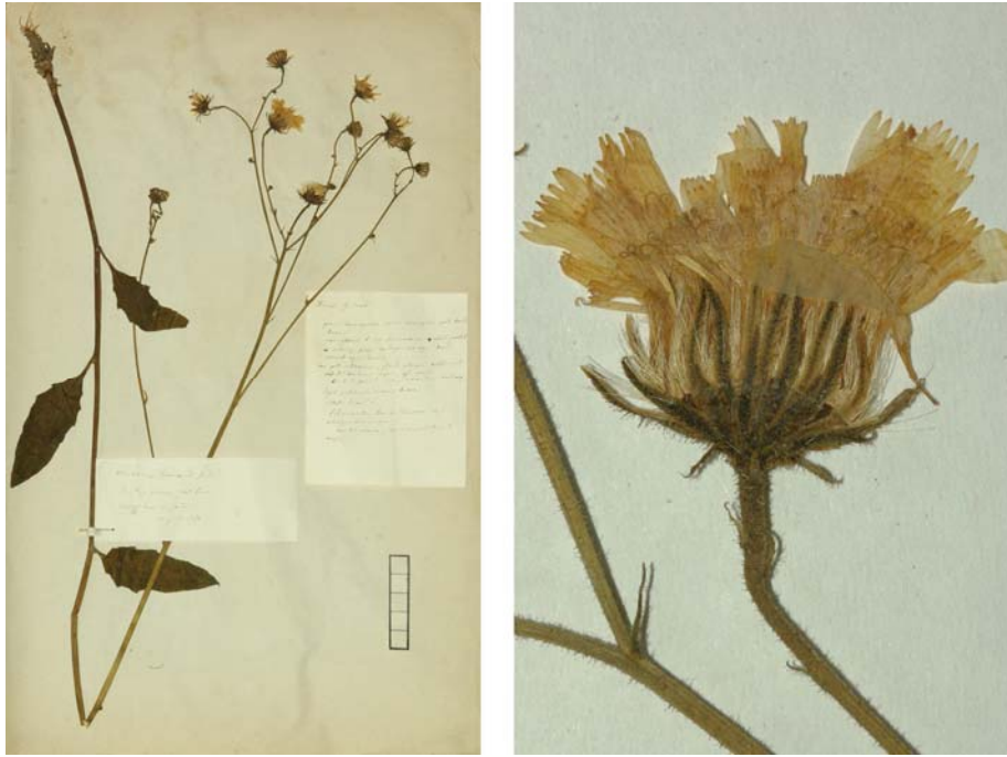
Fig. 91 Hieracium vulgatum [subsp. deductum mg. aurulentum var. paucifoliatum ] subvar. guinandii JORD. ex SUDRE, Hierac. Centre France, 58 (1902) „ guinaudi “ – Ind. loc.: „Pyrénées-Orientales: Montlouis (Jordan); Tarn“, Lectotypus, hoc loco designatus : „des Pyr. orient. Mt. Louis, récolté dans mon jardin, 11 jul. 1854“, leg. et det. A. Jordan sub: Hieracium Guinaudi , ANG-Hb.Boreau.

≡ Hieracium vulgatum var. guinandii (JORD. ex SUDRE) ROUY, Fl. France 9: 359 (1905) „ guinandii “