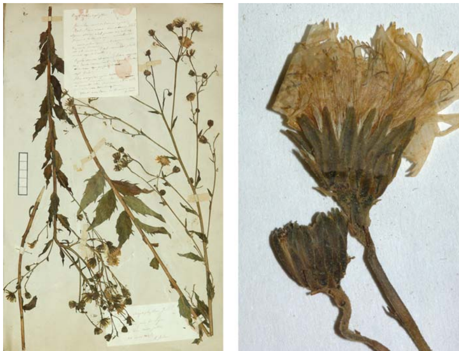
Fig. 178 Hieracium boreale [subsp. virgultorum mg. dispalatum var. anceps ] subvar. streptophyllum JORD. ex SUDRE, Hierac. Centre France, 24 (1902) – Ind. loc.: „Environs de Lyon (Jordan); Tarn: Saint-Urcisse“, Lectotypus, hoc loco designatus: „de Tassin près de Lyon, récolté dans mon jardin, 25 août 1854“, leg. et det. A. Jordan sub: Hieracium streptophyllum , ANG-Hb.Boreau.

≡ Hieracium laevigatum [subsp. subgracilipes ] subvar. stenocladum (JORD. ex BOREAU) ZAHN in ENGLER, Pflanzenr. 79: 878 (1922)