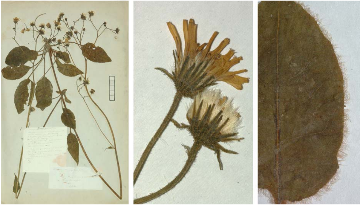
Fig. 113 Hieracium murorum [subsp. murorum mg. gentile ] var. microspilon JORD. ex SUDRE, Hierac. Centre France, 72 (1902) – Ind. loc.: „Isère: Bourg d’Oisans (Jordan); Haute-Vienne: Saint-Martin, Saint-Léonard (s. n. H. ovalifolii): Tarn“, Lectotypus, hoc loco designatus : „de Bourg d’Oisans (Isère), récolté dans m. jard., 1854“, leg. et det. A. Jordan sub: Hieracium microspilon , ANG-Hb.Boreau.

≡ Hieracium murorum subsp. microspilon (JORD. ex SUDRE) ZAHN, Hierac. Alp. Mar., 158 (1916)