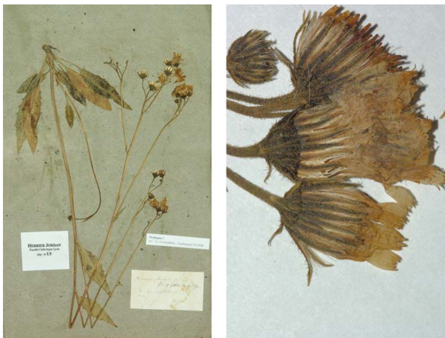
Fig. 106 Hieracium levicaule JORD., Cat. Graines Jard. Dijon, 23 (1848) – Ind. loc.: „in sylvaticis argillosis montium lugdunensium; Chenellette! Monsol! Alix! (Rhône)“, Neotypus, hoc loco designatus : „de Monsol (Rhône), cult.“, leg. et det. A. Jordan sub: Hieracium levicaule , LY-Hb.Jordan. ≡ Hieracium fragile var. levicaule (JORD.) NYMAN, Consp. Fl. Eur. 2: 444 (1879) „ laevicaule “ ≡ Hieracium divisum subsp. levicaule (JORD.) SUDRE, Hierac. Centre France, 64 (1902) ≡ Hieracium divisum „forme“ levicaule (JORD.) ROUY, Fl. France 9:347 (1905) „ laevicaule “