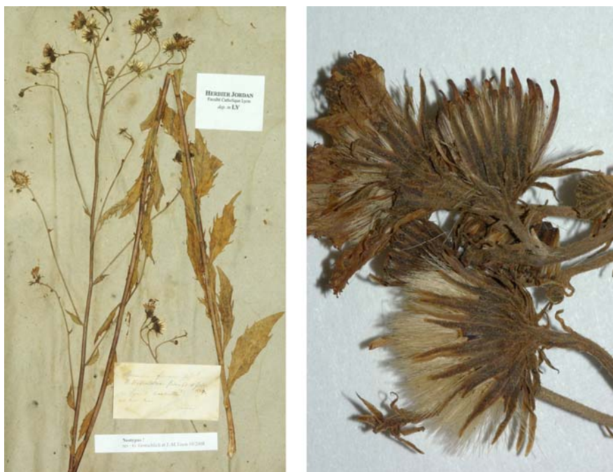
Fig. 78 Hieracium firmum JORD., Cat. Gr. Jard. Dijon, 22 (1848) – Ind. loc.: „in sylvaticis argillosis prope Lyon“, Neotypus, hoc loco designatus : „de Lyon à Montrouge, in hort. lect.“, s.d., leg. et det. A. Jordan sub: Hieracium firmum , LY-Hb.Jordan.

= Hieracium laevigatum [subsp. rigidum ] var. hirsutum ZAHN in ENGLER, Pflanzenr. 79: 886 (1922), nom. superfl.