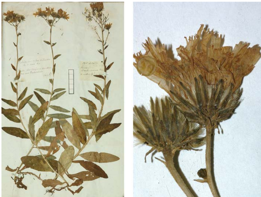
Fig. 50 Hieracium umbellatum var. dantecianum BOREAU ex SUDRE, Hierac. Centre France, 13 (1902) – Ind. loc.: „Palaise, sous le fort de Lanveau (Le Dantec)“, Lectotypus, hoc loco designatus : „Palaise, sous le fort de Lanveau, 3 août 1870“, leg. ??, det. A. Boreau sub: Hieracium dantecianum , ANG-Hb.Boreau.