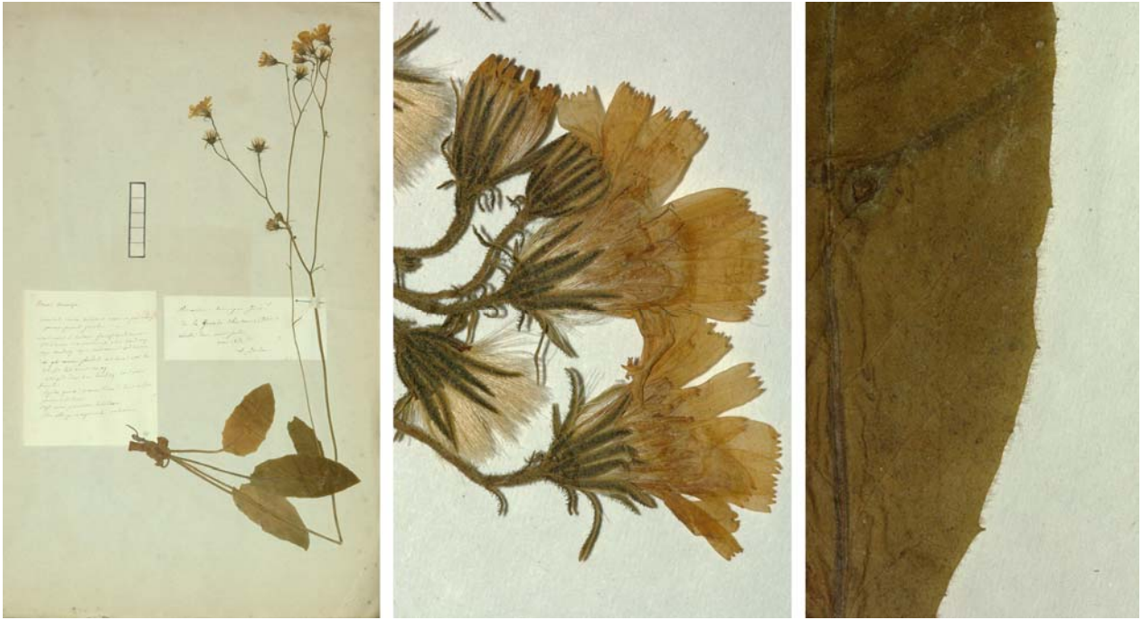
Fig. 191 Hieracium murorum [subsp. murorum mg. macrodon var. sparsum ] subvar. tenuipes JORD. ex SUDRE, Hierac. Centre France, 74 (1902) – Ind. loc.: „Isère: Grande-Chartreuse! (Jordan); Tarn“, Lectotypus, hoc loco designatus: „de la Grande Chartreuse (Isère), récolté dans mon jardin, mai 1854“, leg. et det. A. Jordan sub: Hieracium tenuipes , ANG-Hb.Boreau.

≡ Hieracium murorum [subsp. neosparsum ] var. tenuipes (JORD. ex SUDRE) ZAHN in ENGLER, Pflanzenr. 76: 312 (1921)