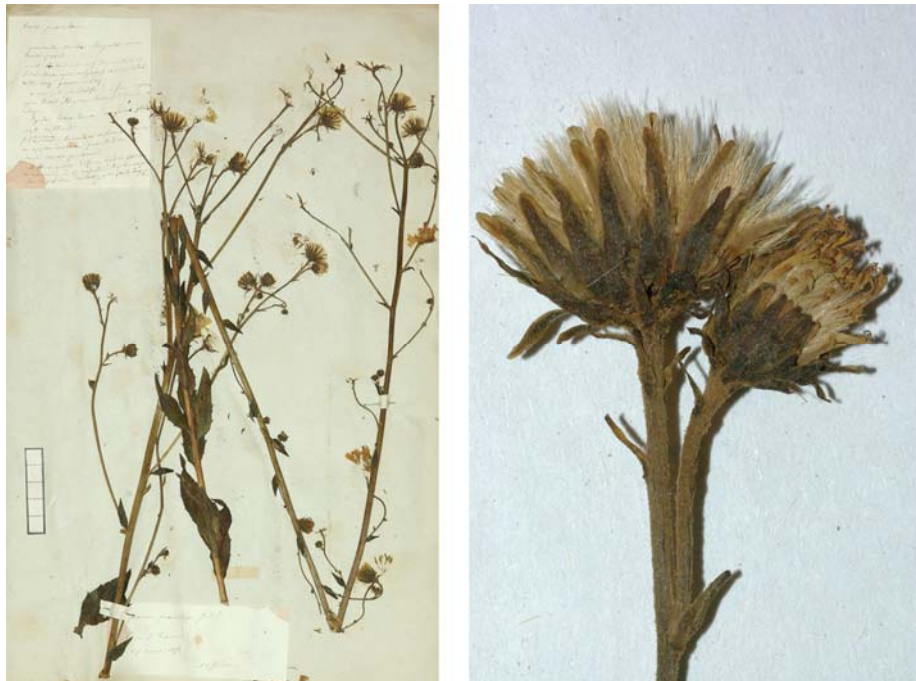
Fig. 146 Hieracium boreale [subsp. virgultorum mg. eminens var. vivariense ] subvar. praecelsum JORD. ex SUDRE, Hierac. Centre France, 27 (1902) – Ind. loc.: „Tassin, près Lyon! (Jordan); Tarn: forêt de Lacabarède“, Lectotypus, hoc loco designatus : „Lyon à Tassin, 25 août 1851“, leg. et det. A. Jordan sub: Hieracium praecelsum , ANG-Hb.Boreau.

≡ Hieracium glaucinum subsp. subpinicola (ZAHN) O. BOLÒS & VIGO, Fl. Països Catalans 3: 1053 (1996), nom. superfl.