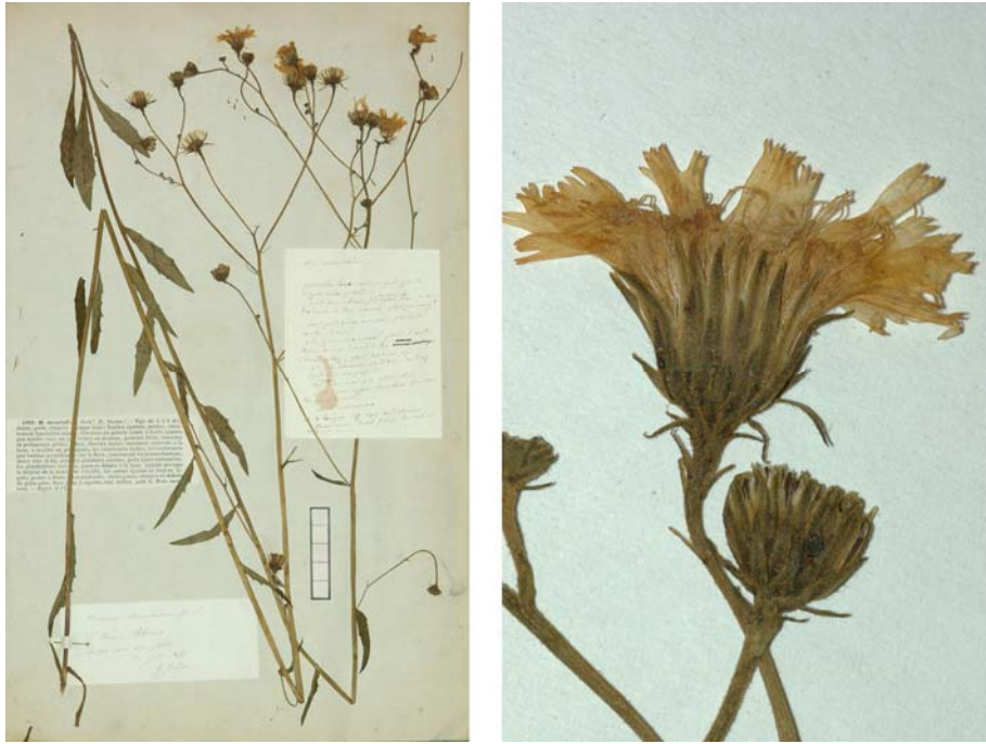
Fig. 177 Hieracium stenocladum JORD. ex BOREAU, Fl. Centre France, ed. 3, 2: 393 (1857) – Ind. loc.: „Région de l’Est“, Lectotypus, hoc loco designatus: „d’Iseron (Rhône), récolté dans mon jardin, 31 jul. 1854“, leg. et det. A. Jordan sub: Hieracium stenocladum , ANG-Hb.Boreau.

≡ Hieracium conspicuum [taxon] stenocladum (JORD. ex BOREAU) NYMAN, Suppl. Syll. Fl. Eur., 8 (1865)