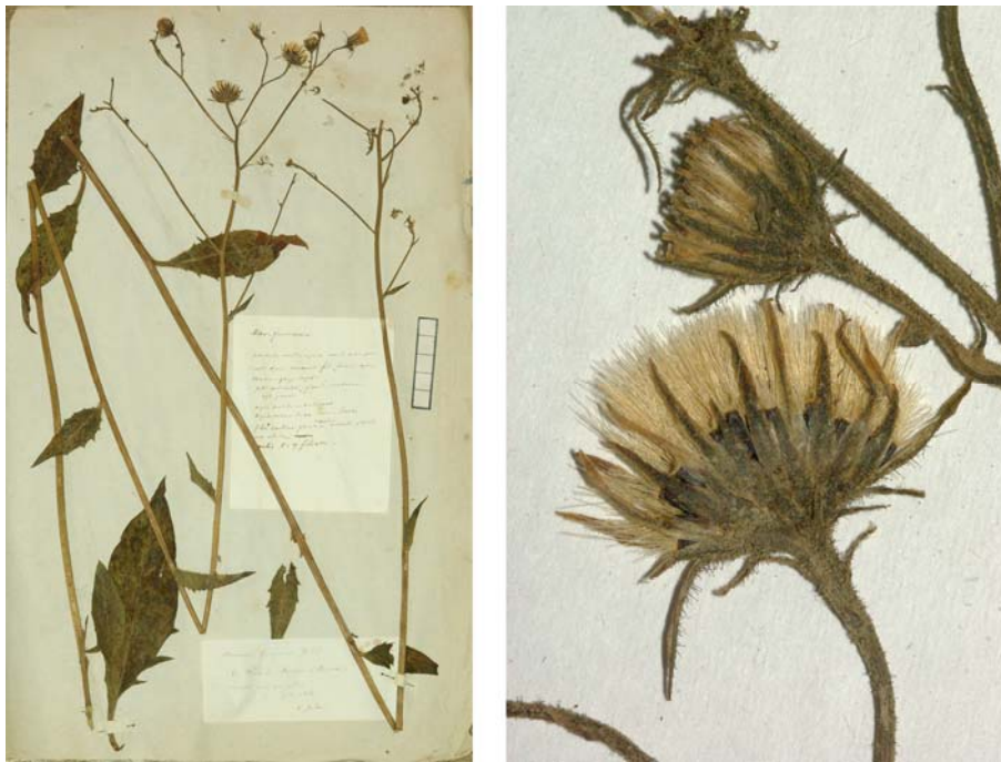
Fig. 83 Hieracium vulgatum [subsp. approximatum mg. arrectariicaule ] var. funereum JORD. ex SUDRE, Hierac. Centre France, 61 (1902) – Ind. loc.: „Pont-à-Mousson (Jordan); Vosges: ruines du château de Rouvoir (Boulay); Haute-Saône: La Nouvelle-les-Scey (Bertrand in herb. Sudre, sub nom. H. inquinati ); Haute-Vienne: Limoges (Lamy)“, Lectotypus, hoc loco designatus : „de Pont-à-Mousson (Meurthe), récolté dans mon jardin, juin 1854“, leg. et det A. Jordan sub: Hieracium funereum , ANG-Hb.Boreau.

≡ Hieracium maculatum [subsp. arrectarium ] var. funerum (JORD. ex SUDRE) ZAHN in ENGLER, Pflanzenr. 76: 520 (1921)