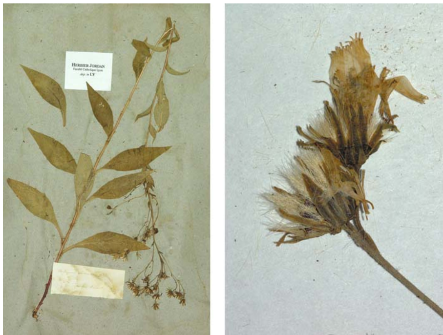
Fig. 124 Hieracium occitanicum JORD., Obs. Pl. Crit. 7: 36 (1849) – Ind. loc.: „les bois et les rocailles des terrains calcaires jurassiques du Haut-Languedoc [...] à la Séranne près de Ganges (Hérault), et à Anduze (Gard)“, Lectotypus, hoc loco designatus : „la Séranne Hérault, 3 sept. 1849“, leg. et det. A. Jordan sub: Hieracium occitanicum , LY-Hb.Jordan. ≡ Hieracium boreale var. occitanicum (JORD.) GREIN. & GODR., Fl. France, 386 (1850) ≡ Hieracium boreale [subsp. virgultorum ] mg. occitanicum (JORD.) SUDRE, Hierac. Centre France, 22 (1902) ≡ Hieracium virgultorum var. occitanicum (JORD.) ROUY, Fl. France 9: 390 (1905) ≡ Hieracium sabaudum subsp. occitanicum (JORD.) ZAHN in ENGLER, Pflanzenr. 79: 946 (1922)