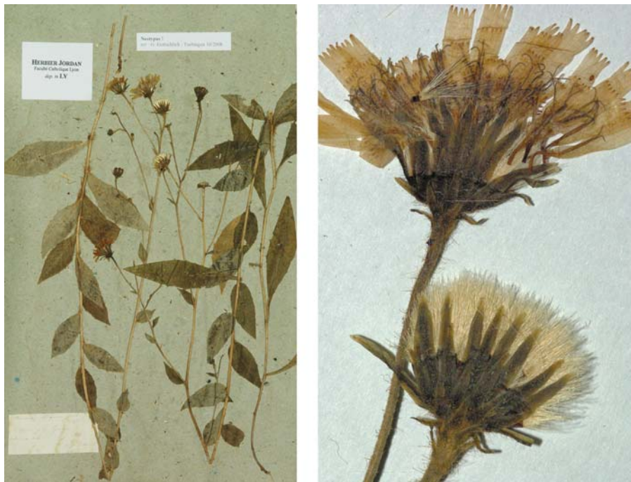
Fig. 120 Hieracium obliquum JORD., Cat. Gr. Jard. Dijon, 23 (1848) – Ind. loc.: „in nemorosis praesertim regionum graniticarum prope Lyon“, Neotypus, hoc loco designatus: „d'Yvoir près Lyon, colui ex semin., août 1851“, leg. et det. A. Jordan sub: Hieracium obliquum , LY-Hb.Jordan.

≡ Hieracium sabaudum subsp. nemorivagum (JORD. ex BOREAU) ZAHN, Neue Denkschr. Allg. Schweiz. Ges. Gesamten Naturwiss. 40: 691 (1906)