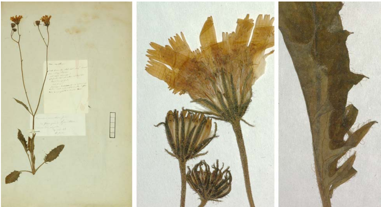
Fig. 109 Hieracium praecox [subsp. ovalifolium mg. bounophilum ] subvar. macellum JORD. ex SUDRE, Hierac. Centre France, 84 (1902) – Ind. loc.: „Rhône: Givors (Jordan)“, Lectotypus, hoc loco designatus: „de Givors près de Lyon (Rhône), récolté dans mon jardin, 29 mai 1854“, leg. et det. A. Jordan sub: Hieracium parile , ANG-Hb.Boreau. ≡ Hieracium praecox [subsp. bounophilum ] f. macellum (JORD.ex SUDRE) ZAHN in ENGLER, Pflanzenr. 75: 235 (1921) ≡ Hieracium praecox [subsp. pseudobounophilum ] var. macellum (JORD. ex SUDRE) ZAHN in ASCHERSON & GRAEBNER, Syn. Mitteleur. Fl. 12/2: 284 (1934)