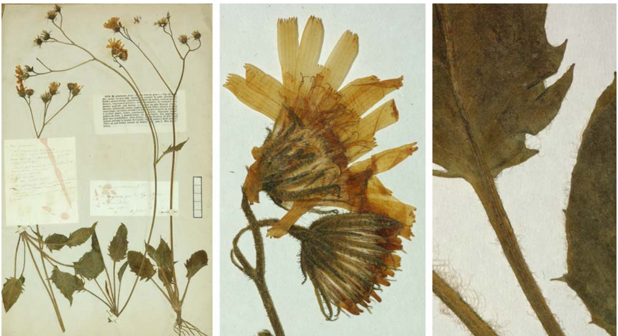
Fig. 144 Hieracium pinetorum JORD. ex BOREAU, Fl. Centre France, ed. 3, 2: 414 (1857) – Ind. loc.: „bois montagneux“, Lectotypus, hoc loco designatus : „de Vaugneray près de Lyon (Rhône), in hort. meo lectum, mai 1852“, leg. et det. A. Jordan sub: Hieracium pinetorum , ANG-Hb.Boreau.