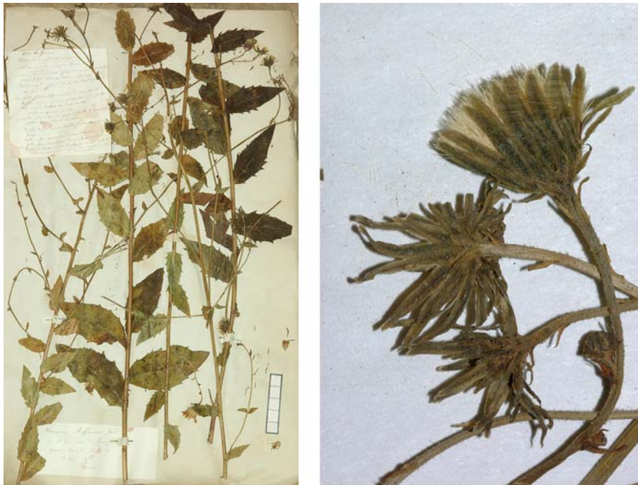
Fig. 164 Hieracium boreale [subsp. virgultorum mg. eminens ] var. roffavieri JORD. ex SUDRE, Hierac. Centre France, 26 (1902) – Ind. loc.: „Saint-Cyr, près Lyon (Jordan); Haute-Savoie: Méry (Déséglise)“, Lectotypus, hoc loco designatus : „de St-Cyr près de Lyon, récolté dans mon jardin, 4 sept. 1854“, leg. et det. A. Jordan sub: Hieracium roffavieri , ANG-Hb.Boreau.

≡ Hieracium sabaudum [subsp. concinnum ] var. rigidulum (JORD. ex BOREAU) ZAHN in ENGLER, Pflanzenr. 79: 952 (1922)