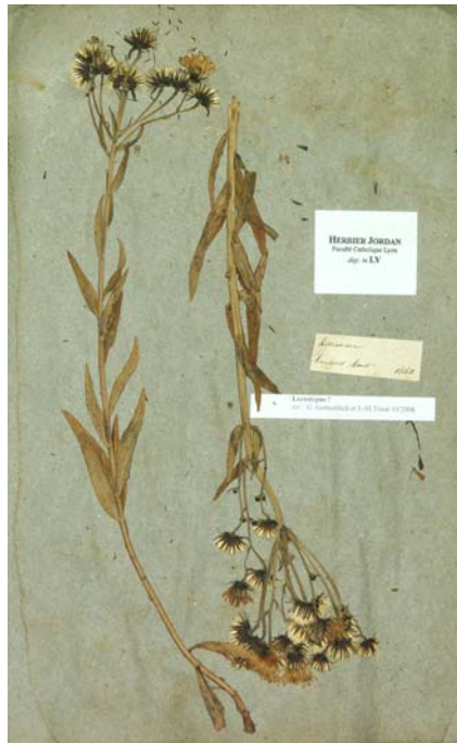
Fig. 114 Hieracium monticola JORD., Cat. Graines Jard. Bot. Grenoble, 20 (1849) – Ind. loc.: „in Alpium Delphinatus pascuis et sylvulis: Col du Lautaret (Hautes-Alpes)“, Lectotypus, hoc loco designatus : „Lautaret Août 1842“, leg. et det. A. Jordan sub: Hieracium monticola , LY-Hb.Jordan.

≡ Hieracium microspilon (JORD. ex SUDRE) SCHLJAKOV, Cvelev, Fl. Evr. Časti SSSR 8: 261 (1989)