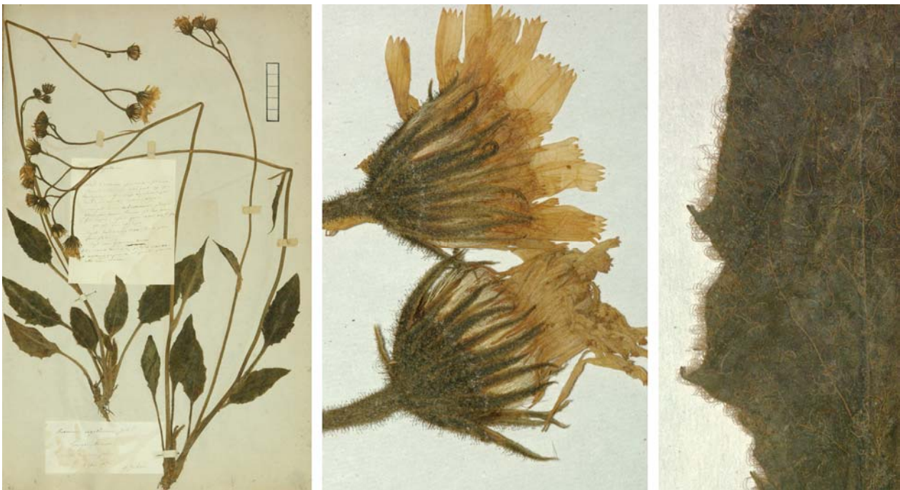
Fig. 70 Hieracium praecox [subsp. cinerascens ] var. expallescens JORD. ex SUDRE, Hierac. Centre France, 78 (1902) – Ind. loc.: „Hérault: Ganges (Jordan)“, Lectotypus, hoc loco designatus : „de Ganges (Hérault), récolté dans mon jardin, 5 juin 1852“, leg. et det. A. Jordan sub: Hieracium expallescens , ANG-Hb.Boreau.

≡ Hieracium sylvaticum subsp. exotericum (JORD. ex BOREAU) ZAHN in SCHINZ & KELLER, Fl. Schweiz, ed. 2, 2: 282 (1905)