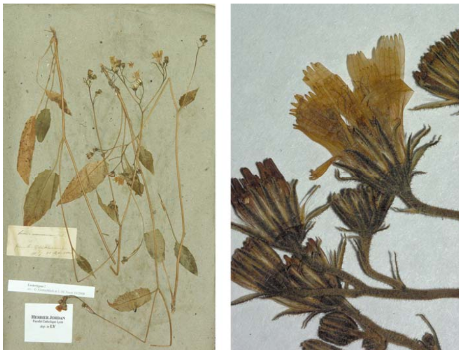
Fig. 118 Hieracium nemorense JORD., Cat. Gr. Jard. Dijon, 23 (1848) – Ind. loc.: „in sylvis montosis Delphinatus; Grande-Chartreuse (Isère)“, Lectotypus, hoc loco designatus : „de la Chartreuse, 13 mai 1846“, leg. et det. A. Jordan sub: Hieracium nemorense , LY-Hb.Jordan.

= Hieracium lachenalii subsp. lachenalii sensu ZAHN in ENGLER, Pflanzenr. 76: 362 (1921)