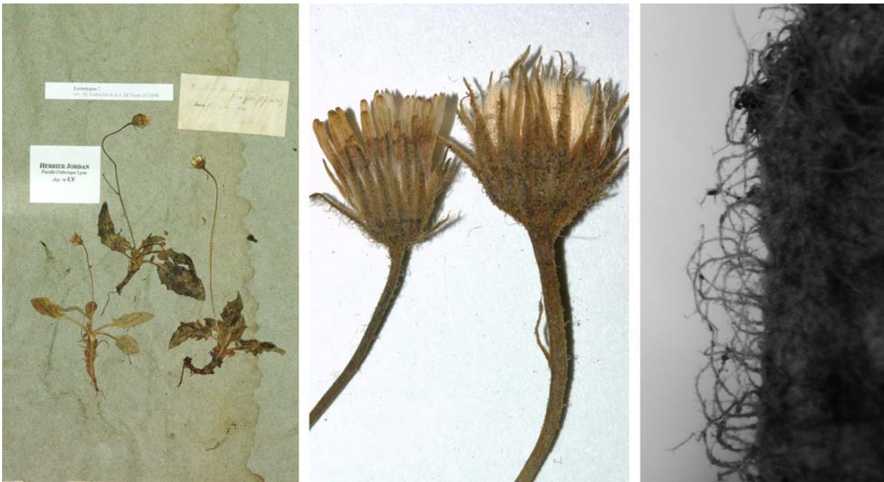
Fig. 73 Hieracium farinulentum JORD., Cat. Gr. Jard. Dijon, 21 (1848) – Ind. loc.: „ad rupes calcareas montium Beugesi; Roussillon (Ain)“, Lectotypus, hoc loco designatus : „Roussillon (Ain) 1848“, leg. et det. A. Jordan sub: Hieracium farinulentum , LY-Hb.Jordan.

≡ Hieracium pictum subsp. farinulentum (JORD.) ZAHN, Neue Denkschr. Allg. Schweiz. Ges. Gesamten Naturwiss. 40: 502 (1906)