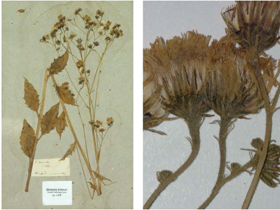
Fig. 13 Hieracium approximatum JORD., Cat. Gr. Jard. Dijon, 20 (1848) – Ind. loc.: „in nemorosis argillosis praesertim regionum graniticarum prope Lyon; Dardilly! Charbonnière! Alix! (Rhône)”, Lectotypus, hoc loco designatus : „d r Alix, mon jardin, 25 juin 1845“, leg. et det. A. Jordan sub: Hieracium approximatum , LY-Hb.Jordan.