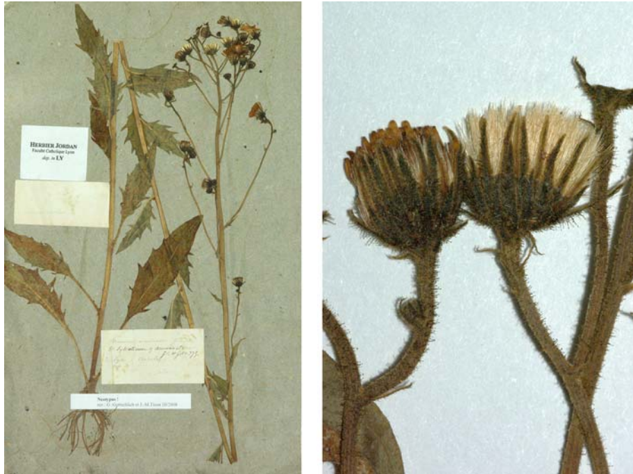
Fig. 3 Hieracium acuminatum JORD., Cat. Graines Jard. Bot. Grenoble, 17 (1849) – Ind. loc.: „Chasselay Quincieux etc. prope Lyon“, Neotypus, hoc loco designatus: „de Lyon à Chasselay, cult.“, leg. et det. A. Jordan sub: Hieracium acuminatum , LY-Hb.Jordan.