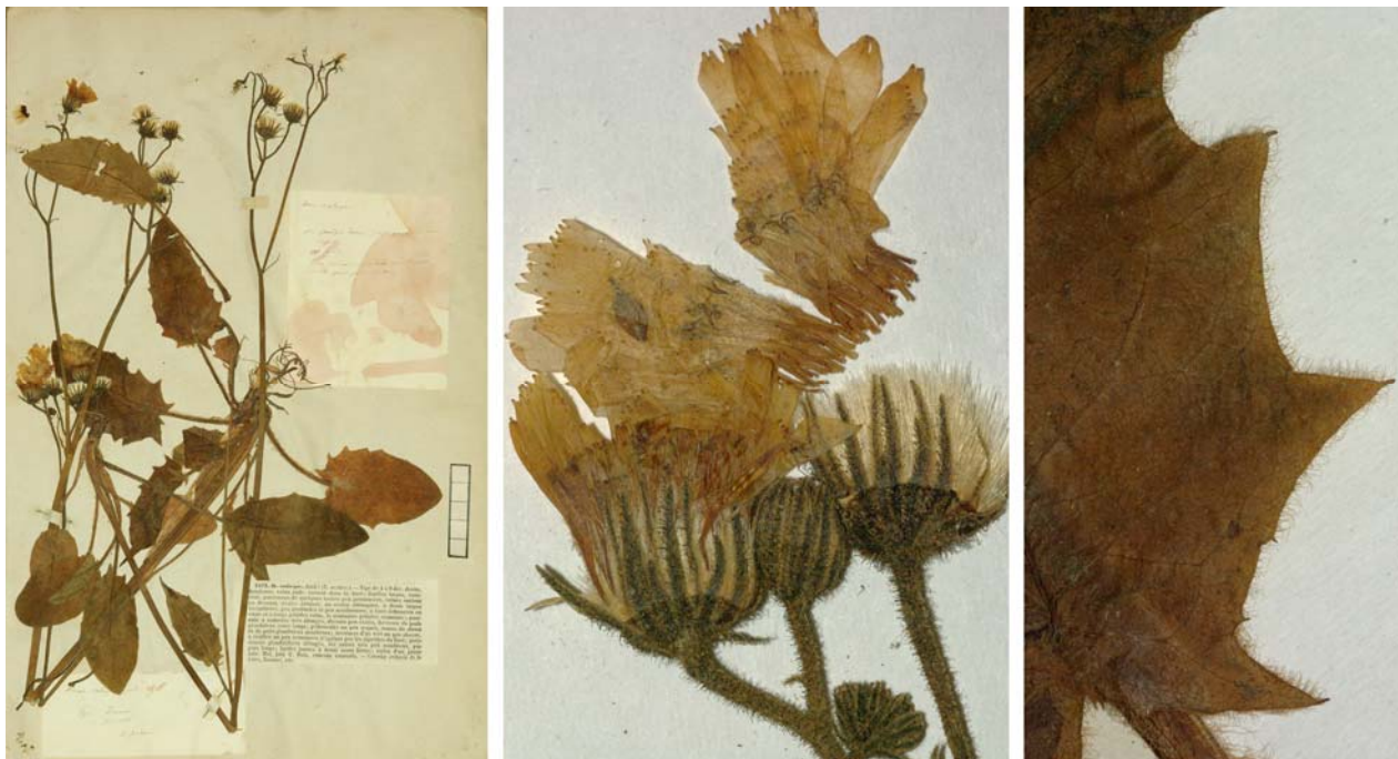
Fig. 170 Hieracium scabripes JORD. ex BOREAU, Fl. Centre France , ed. 3, 2: 415 (1857) – Ind. loc.: „Coteaux crétaqués de la Loire, Saumur, etc.“, Lectotypus, hoc loco designatus : „Lyon à Limonest, juin 1850“, leg. et det. A. Jordan sub: Hieracium scabripes , ANG-Hb.Boreau.

≡ Hieracium urticaceum f. saxetorum ZAHN in ENGLER, Pflanzenr. 77: 741 (1921)