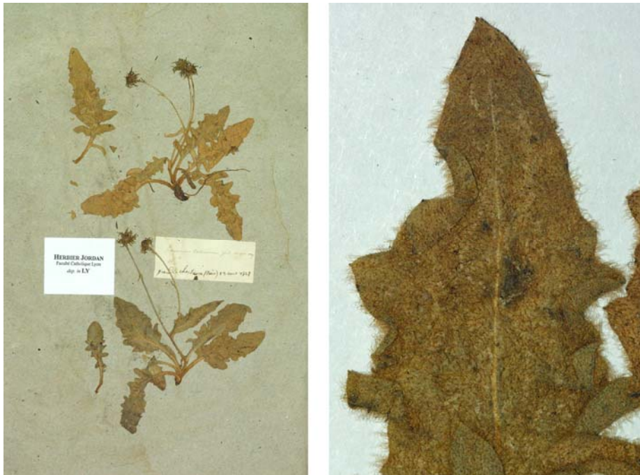
Fig. 102 Hieracium kochianum JORD., Cat. Graines Jard. Bot. Grenoble , 19 (1849) – Ind. loc.: „in rupestribus calcareis montium Delphinatus: Grande-Chartreuse! Col-de-l’Arc (Verlot)“, Lectotypus, hoc loco designatus: „Grande Chartreuse (Isère), 23 août 1849“, leg. et det. A. Jordan sub: Hieracium kochianum , LY-Hb.Jordan.