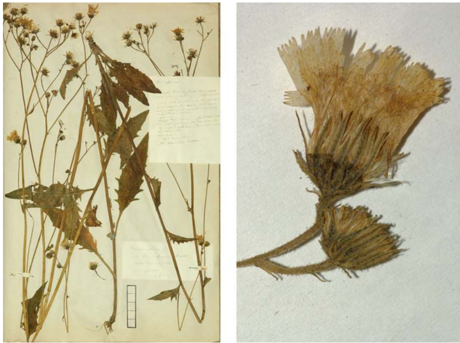
Fig. 1 Hieracium vulgatum [subsp. deductum mg. aurulentum var. perscissum ] subvar. abditum JORD. ex SUDRE, Hierac. Centre France, 58 (1902) – Ind. loc.: „Pont-à-Mousson (Jordan)“, Lectotypus, hoc loco designatus: „de Pont à Mousson (Meurthe), 2 juil. 1854, récolté dans mon jardin“, leg. et det. A. Jordan sub: H. abditum , ANG-Hb.Boreau.

≡ Hieracium abditum JORD. ex NYMAN, Consp. Fl. Eur. 2: 443 (1879) pro syn.