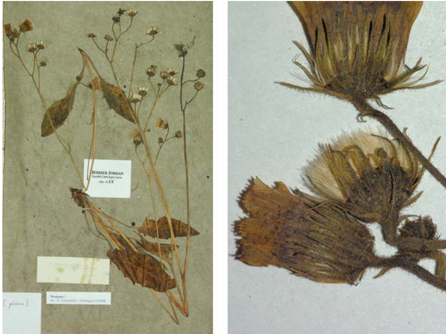
Fig. 139 Hieracium petiolare JORD., Cat. Graines Jard. Bot. Grenoble, 20 (1849) – Ind. loc.: „in sylvis et rupestribus montium graniticarum: Francheville! Dardilly! etc., prope Lyon“, Neotypus, hoc loco designatus : „St. Etienne prope Lyon, 12 jul. 49“, leg. A. Jordan, indet., LY-Hb.Jordan. [This specimen is included in the file „ Hieracium petiolare “ of the Jordan herbarium, fits with the description, and is the only one related with the locotypical indication: Saint-Etienne, like Francheville and Dardilly, belongs to the low granitic mountain region located west of Lyon. However, because of the lack of name, the link with the protologue is not fully certain.]

≡ Hieracium murorum var. petiolare (JORD.) GREN. & GODR., Fl. France, 373 (1850)