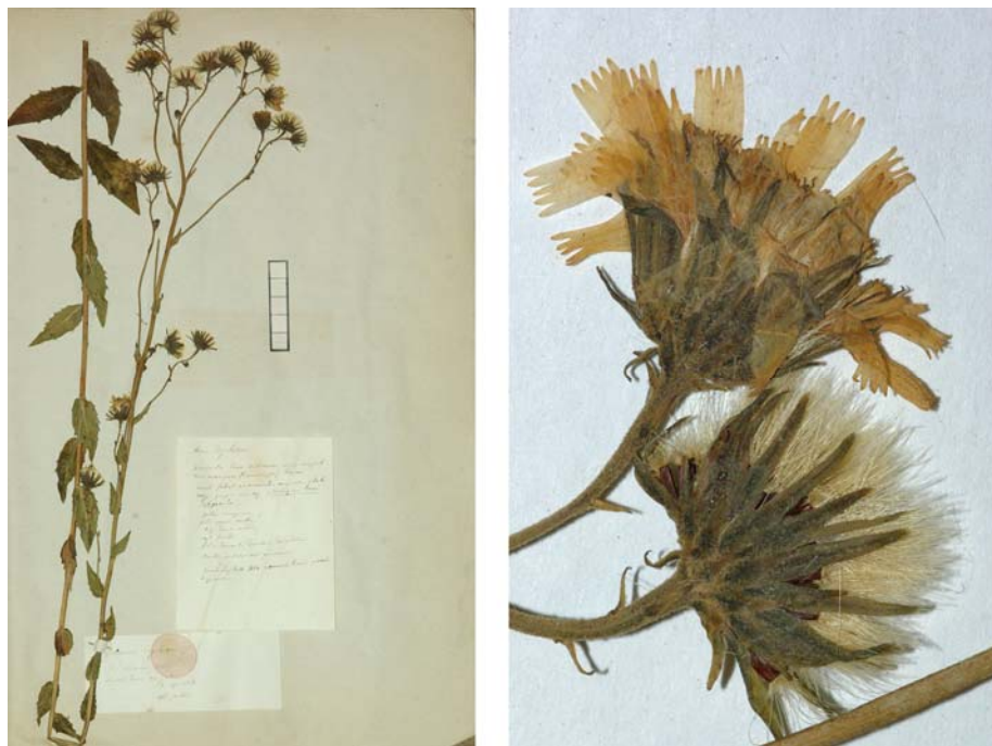
Fig. 52 Hieracium boreale [subsp. virgultorum mg. vagum var. subrectum ] subvar. depilatum JORD. ex SUDRE, Hierac. Centre France, 28 (1902) – Ind. loc.: „Isère: Crémieux (Jordan)“, Lectotypus, hoc loco designatus : „de Crémieux (Isère), récolté dans mon jardin, 8 sept. 1854“, leg. et det. A. Jordan sub: Hieracium depilatum , ANG-Hb.Boreau.

≡ Hieracium lycopifolium [subsp. vallesiicum ] subvar. depauperatum (JORD.) ZAHN in ENGLER, Pflanzenr. 79: 959 (1922)