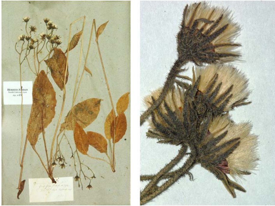
Fig. 197 Hieracium umbrosum JORD., Cat. Gr. Jard. Dijon, 24 (1848) – Ind. loc.: „in sylvis Alpium Delphinatus: Rabou! La Grangette! prope Gap, etc.“, Lectotypus, hoc loco designatus : „de Gap (H tes Alp.) Septemb. 1845“, leg. et det. A. Jordan sub: Hieracium umbrosum , LY-Hb.Jordan.

≡ Hieracium fastigiatum var. umbrosum (JORD.) NYMAN, Suppl. Syll. Fl. Eur., 9 (1865)