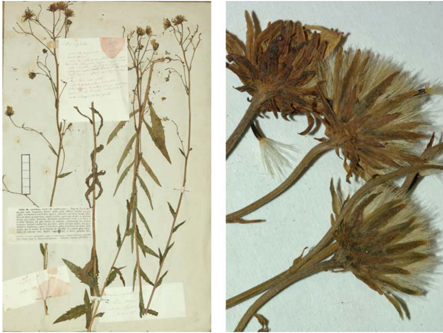
Fig. 163 Hieracium rigidulum JORD. ex BOREAU, Fl. Centre France, ed. 3, 2: 386 (1857) – Ind. loc.: „Rhône. Tarare (Jordan)“, Lectotypus, hoc loco designatus : „de Tarare (Rhône), récolté dans mon jardin, 30 août 1853“, leg. et det. A. Jordan sub: Hieracium rigidulum , ANG-Hb.Boreau.

≡ Hieracium rigidum [taxon] rigidulum (JORD. ex BOREAU) NYMAN, Suppl. Syll. Fl. Eur., 8 (1865)