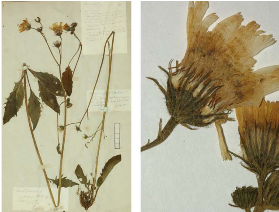
Fig. 128 Hieracium pallidifolium JORD. ex BOREAU, Fl. Centre France, ed. 3, 2: 407 (1857) – Ind. loc.: „Bois montueux“, Lectotypus, hoc loco designatus : „de Dardilly près Lyon, récolté dans mon jardin, 12 juin 1854“, leg. et det. A. Jordan sub: Hieracium pallidifolium , ANG-Hb.Boreau. [The herbarium page includes a second specimen from Loire which link with the protologue remains doubtful.]

≡ Hieracium glaucinum subsp. ovalifolium (JORD.) SOÓ, Acta Bot. Acad. Sci. Hung. 14: 154 (1968)