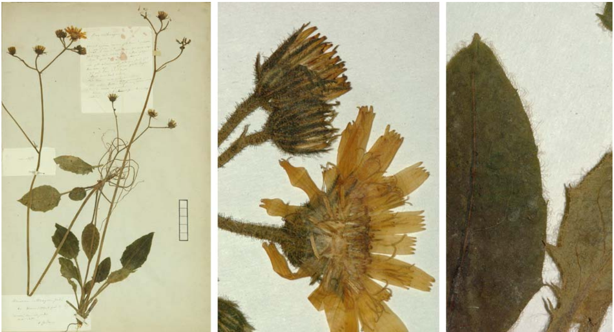
Fig. 40 Hieracium praecox [subsp. ovalifolium ] var. collivagum JORD. ex SUDRE, Hierac. Centre France, 81 (1902– Ind. loc.: „Isère: Verna (Jordan)“ Lectotypus, hoc loco designatus: „de Verna (Isère) près de Lyon, récolté dans mon jardin, mai 1853“, leg. et det. A. Jordan sub: Hieracium collivagum , ANG-Hb.Boreau.