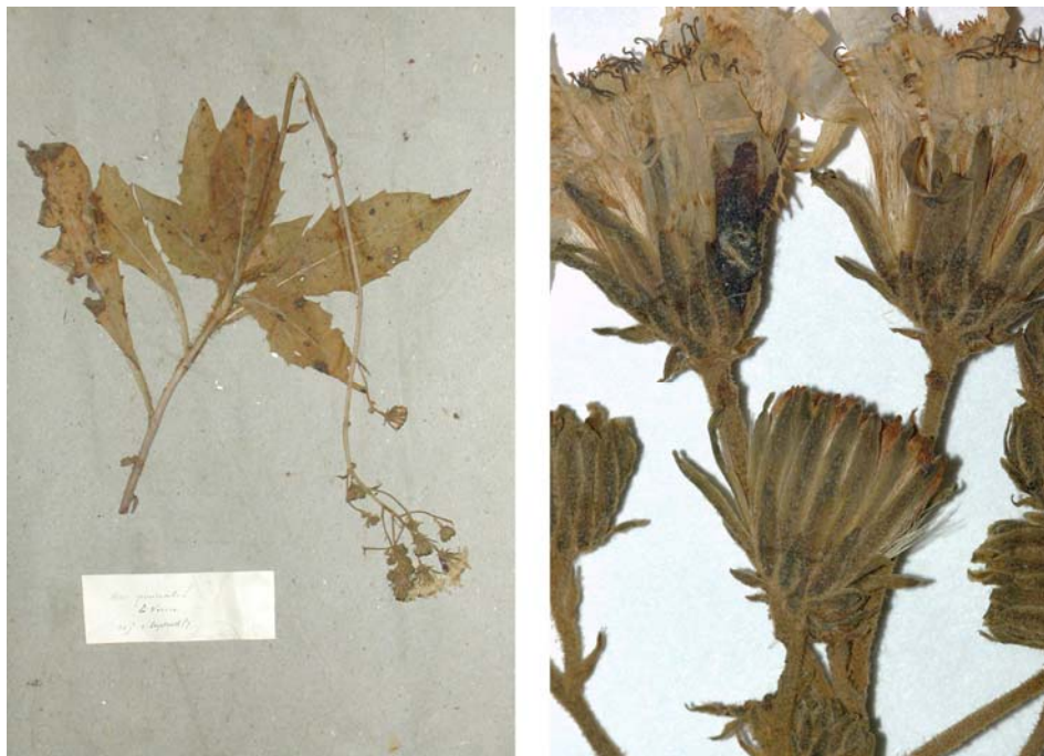
Fig. 148 Hieracium provinciale JORD., Obs. Pl. Crit. 7: 41 (1849) – Ind. loc.: „dans les bois et parmi les rochers des terrains primitifs, à la Chartreuse de la Verne (Var)“, Neotypus, hoc loco designatus : „La Verne, 2 sept. 1857“, leg. et det. A. Jordan sub: Hieracium provinciale , LY-Hb.Jordan.