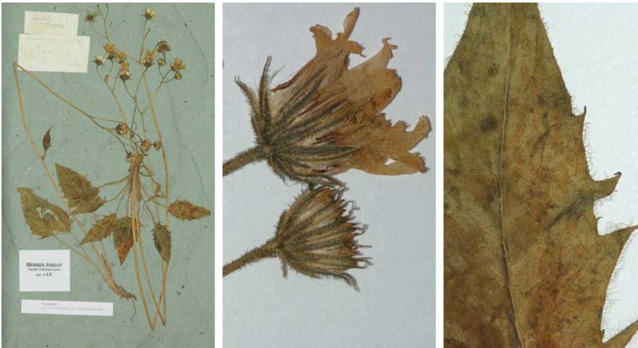
Fig. 89 Hieracium glaucinum JORD., Cat. Gr. Jard. Dijon, 22 (1848) – Ind. loc.: „in collibus et sylvis prope Lyon, et forsan ubique in Gallia orientali haud infrequens“, Neotypus, hoc loco designatus : „de Lyon à Vaugneray, colui 1849“, leg. et det. A. Jordan sub: Hieracium glaucinum , LY-Hb.Jordan.

≡ Hieracium fragile [taxon] glaucinum (JORD.) NYMAN, Suppl. Syll. Fl. Eur., 9 (1865)