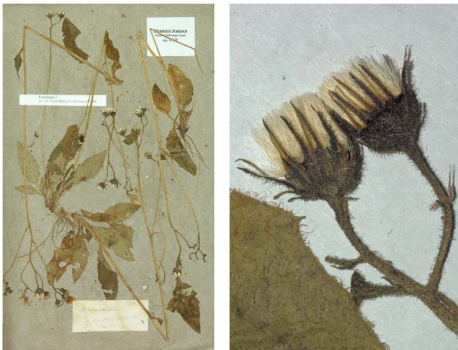
Fig. 122 Hieracium oblongum JORD., Cat. Graines Jard. Bot. Grenoble, 20 (1849) – Ind. loc.: „in sylvaticis argillosis montium Lugdunensium: Alix! prope Lyon, etc.“, Lectotypus, hoc loco designatus: „Lyon, Alix (Rhône), 18 juin 1848“, leg. M. Timeroy, det. A. Jordan sub: Hieracium oblongum , LY-Hb.Jordan.

≡ Hieracium murorum var. oblongum (JORD.) GREN. & GODR., Fl. France, 373 (1850)