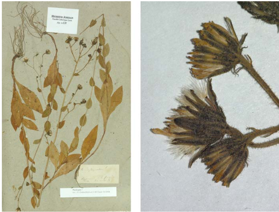
Fig. 51 Hieracium depauperatum JORD., Obs. Pl. Crit. 7: 38 (1849) – Ind. loc.: „à Briançon, à Suze, à Lans-le-Bourg“, Neotypus, hoc loco designatus : „Briançon, à le forêt du Puët [currently Poët], 31 août [18]51“, leg. et det. A. Jordan sub: Hieracium depauperatum , LY-Hb.Jordan.

≡ Hieracium lycopifolium „forme“ depauperatum (JORD.) ROUY, Fl. France 9: 412 (1905)