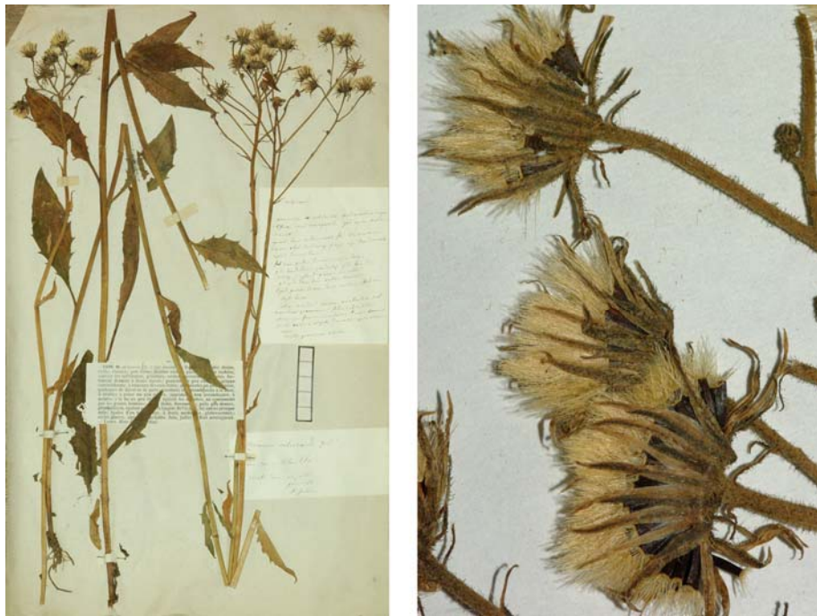
Fig. 35 Hieracium celsicaule JORD. ex BOREAU, Fl. Centre France, ed. 3, 2: 402 (1857) – Ind. loc.: „Loire: Mont-Pilat (Jordan)“ Lectotypus, hoc loco designatus: „du Mont-Pilat (Loire), récolté dans mon jardin, juin 1854“, leg. et det. A. Jordan sub: Hieracium celsicaule , ANG-Hb.Boreau.

≡ Hieracium vulgatum [subsp. approximatum mg. arrectariicaule ] var. celsicaule (JORD. ex BOREAU) SUDRE, Hierac. Centre France, 62 (1902)