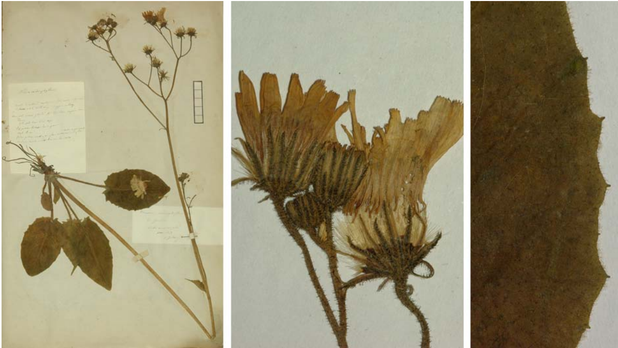
Fig. 33 Hieracium murorum [subsp. exotericum ] mg. cardiophyllum JORD. ex SUDRE, Hierac. Centre France, 75 (1902) – Ind. loc.: „Genève! (Jordan); Anjou: Gennes, Champigny-le-Sec (sub nom. H. similati ); Saumur, Bois de la Providence (Préaubert); Tarn: Albi, Durfort, le Sidobre, à Burlats; Haute-Marne: Bourbonne-les-Bains (Levent)“ Lectotypus, hoc loco designatus: „de Genève, récolté dans mon jardin, juin 1854“, leg. et det. A. Jordan sub: Hieracium cardiophyllum , ANG-Hb.Boreau.

≡ Hieracium murorum var. cardiophyllum (JORD. ex SUDRE) ROUY, Fl. France 9: 340 (1905)