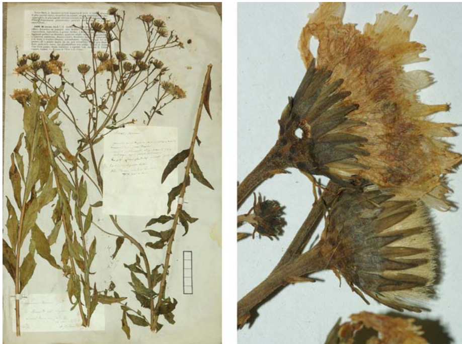
Fig. 172 Hieracium serum JORD. ex BOREAU, Fl. Centre France, ed. 3, 2: 388 (1857) – Ind. loc.: „Régions de l’Est et du Centre“, Lectotypus, hoc loco designatus : „de Bonand près Lyon, récolté dans m. jard., 14 oct. 1854“, leg. et det. A. Jordan sub: Hieracium serum , ANG-Hb.Boreau.

≡ Hieracium murorum subsp. serratifolium (JORD. ex BOREAU) ZAHN in SCHINZ & KELLER, Fl. Schweiz, ed. 3, 2: 419 (1914)