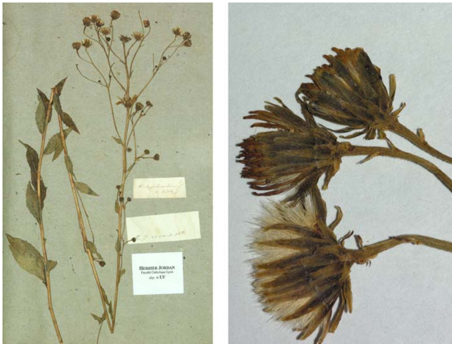
Fig. 93 Hieracium boreale [subsp. virgultorum mg. occitanicum ] var. hypselocaulon JORD. ex SUDRE, Hierac. Centre France, 23 (1902) „ hypselocaulon ” – Ind. loc.: „Patrie inconnue“, Neotypus, hoc loco designatus : „de Dardilly, m.j. [mon jardin], 21 août 1854“, leg. et det. A. Jordan sub: Hieracium hypselocaulon , LY-Hb.Jordan.

≡ Hieracium sabaudum [subsp. occitanicum ] var. hypselocaulon (JORD. ex SUDRE) ZAHN in ASCHERSON & GRAEBNER, Syn. Mitteleur. Fl. 12/3: 538 (1938)