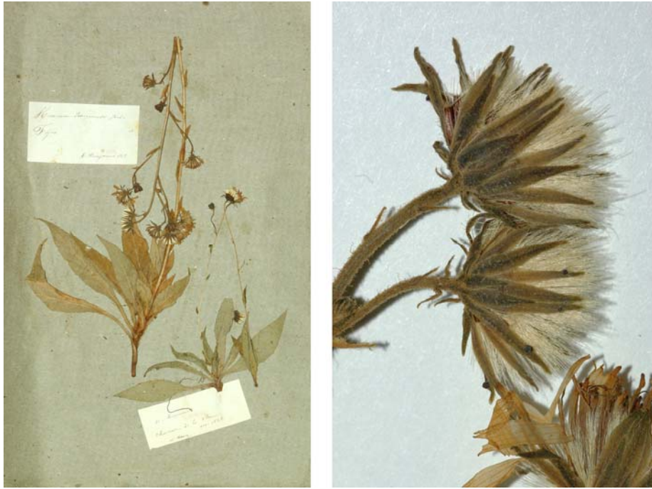
Fig. 137 Hieracium perreymondii JORD., Obs. Pl. Crit. 7: 42, in obs. (1849) „perreymondi“ – Ind. loc.: „près de Fréjus“, Lectotypus, hoc loco designatus : „Fréjus, M. Perreymond, 1843“, det. A. Jordan sub: Hieracium perreymondi , LY-Hb.Jordan.

≡ Hieracium racemosum [subsp. provinciale ] var. perreymondii (JORD.) ROUY, Fl. France 9: 408 (1905) „perreymondi“