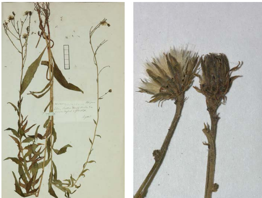
Fig. 56 Hieracium boreale [subsp. quercetorum var. quercetorum ] subvar. dissitum JORD. ex SUDRE, Hierac. Centre France, 29 (1902) – Ind. loc.: „Isère: Uriage!; Tarn“, Neotypus, hoc loco designatus : „Loire, Salt en Donzy, bords des bois de Sapins, 7 bre 1871, leg. A. Legrand“, indet., ANG-HB.Boreau. [No suitable original material was traced in the Jordan, Boreau or Sudre herbaria. Although the designated sample is not determined, it indirectly linked to H. dissitum because it was included in a sheet bearing this name, probably by Sudre during the re-arrangement of Boreau’s herbarium.]

≡ Hieracium maculatum [subsp. pilatense ] var. dissidens (JORD. ex BOREAU) ZAHN in ENGLER, Pflanzenr. 76: 519 (1921)