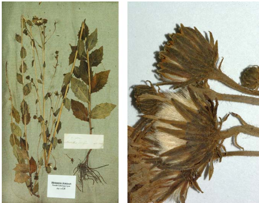
Fig. 87 Hieracium gallicum JORD., Cat. Graines Jard. Bot. Grenoble, 19 (1849) – Ind. loc.: „in sylvaticis argillosis: Charbonnière! Montriblound! etc., prope Lyon“, Lectotypus, hoc loco designatus : „Montriblound près Lyon, août 1849“, leg. et det. A. Jordan sub: Hieracium gallicum , LY-Hb.Jordan.

≡ Hieracium sabaudum var. gallicum (JORD.) ARV.-TOUV., Bull. Soc. Dauph. Éch. Pl. 1880: 291 (1880)