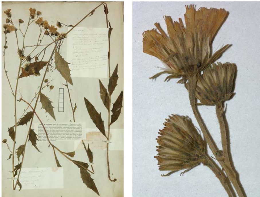
Fig. 203 Hieracium viretorum JORD. ex BOREAU, Fl. Centre France, ed. 3, 2: 395 (1857) – Ind. loc.: „Loire. Mont-Pilat (Jordan)“, Lectotypus, hoc loco designatus : „du Mont Pilat (Loire), récolté dans mon jardin, 13 jul. 1854“, leg. et det. A. Jordan sub: Hieracium viretorum , ANG-Hb.Boreau.

≡ Hieracium conspicuum [taxon] viretorum (JORD. ex BOREAU) NYMAN, Suppl. Syll. Fl. Eur., 8 (1865)