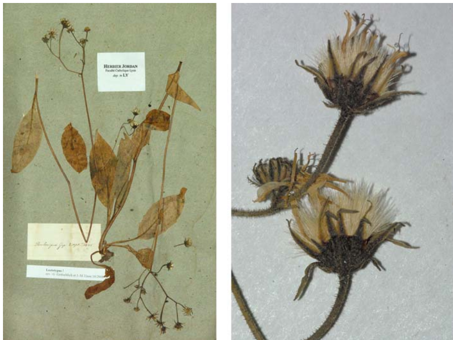
Fig. 186 Hieracium sylvicola JORD., Cat. Graines Jard. Bot. Grenoble, 21 (1849) – Ind. loc.: „in sylvis Alpium Delphinatus: Rabou! prope Gap“, Lectotypus, hoc loco designatus: „Rabou près Gap, 2 sept. 1845“, leg. et det. A. Jordan sub: Hieracium sylvicola , LY-Hb.Jordan. ≡ Hieracium umbrosum var. sylvicola (JORD.) ROUY, Fl. France 9: 343 (1905) „ silvicolum “ ≡ Hieracium umbrosum subvar. sylvicola (JORD.) ZAHN in ASCHERSON & GRAEBNER, Syn. Mitteleur. Fl. 12/3: 348 (1937) „ silvicola “