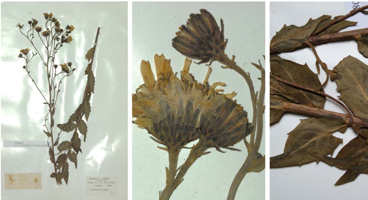
Fig. 198 Hieracium vagum JORD., Cat. Graines Jard. Bot. Grenoble, 21 (1849) – Ind. loc.: „in sylvaticis montium graniticarum lugdunensium et vivariensium, praesertim inter castaneas; Chassagny! Givors! prope Lyon; Mayre etc. (Ardèche)“, Neotypus, hoc loco designatus : „de Mayre (Ardèche). Colui ex semin., 2 Sept. 1852“, leg. et det. A. Jordan sub: Hieracium vagum , LY-Hb.Jordan.

≡ Hieracium vulgatum var. umbrosum (JORD.) ARV.-TOUV., Ann. Soc. Linn. Lyon, sér. 2, 34: 85 (1888)