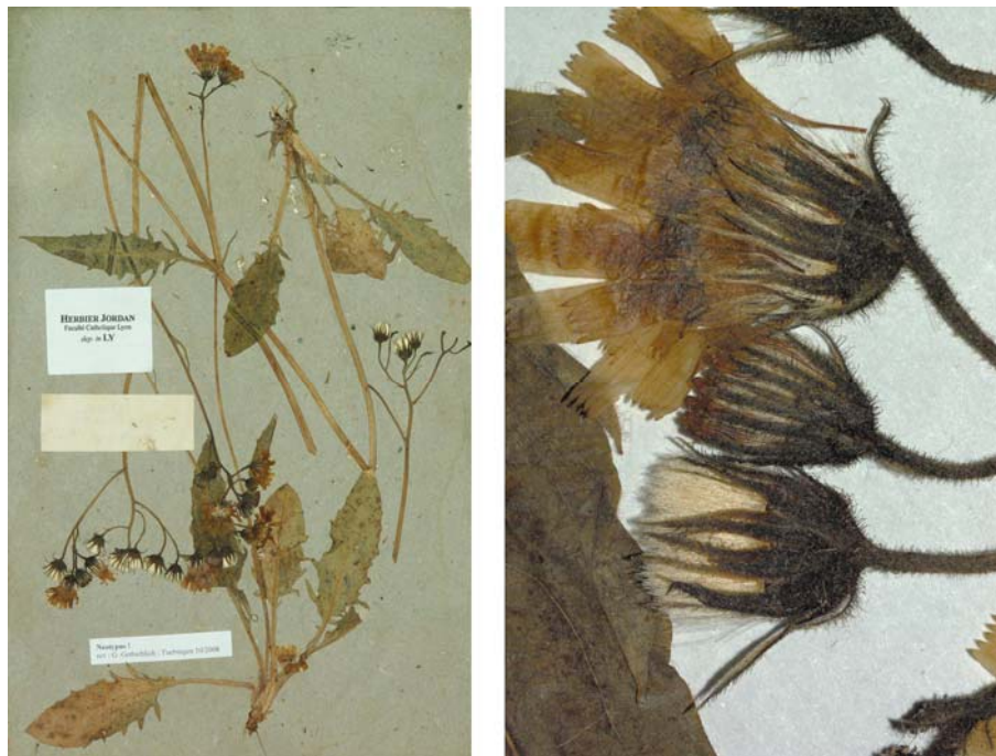
Fig. 112 Hieracium medium JORD., Cat. Graines Jard. Bot. Grenoble 19 (1849) – Ind. loc.: „in sylvis montium Delphinatus: Gap (Hautes-Alpes)“, Neotypus, hoc loco designatus : „Gap, m.j. [mon jardin], 18 jun. [18]51“, leg. et det. A. Jordan sub: Hieracium medium , LY-Hb.Jordan.

≡ Hieracium lachenalii [subsp. jaccardii ] var. medioximum (JORD. ex BOREAU) ZAHN in ASCHERSON & GRAEBNER, Syn. Mitteleur. Fl. 12/2: 539 (1934)