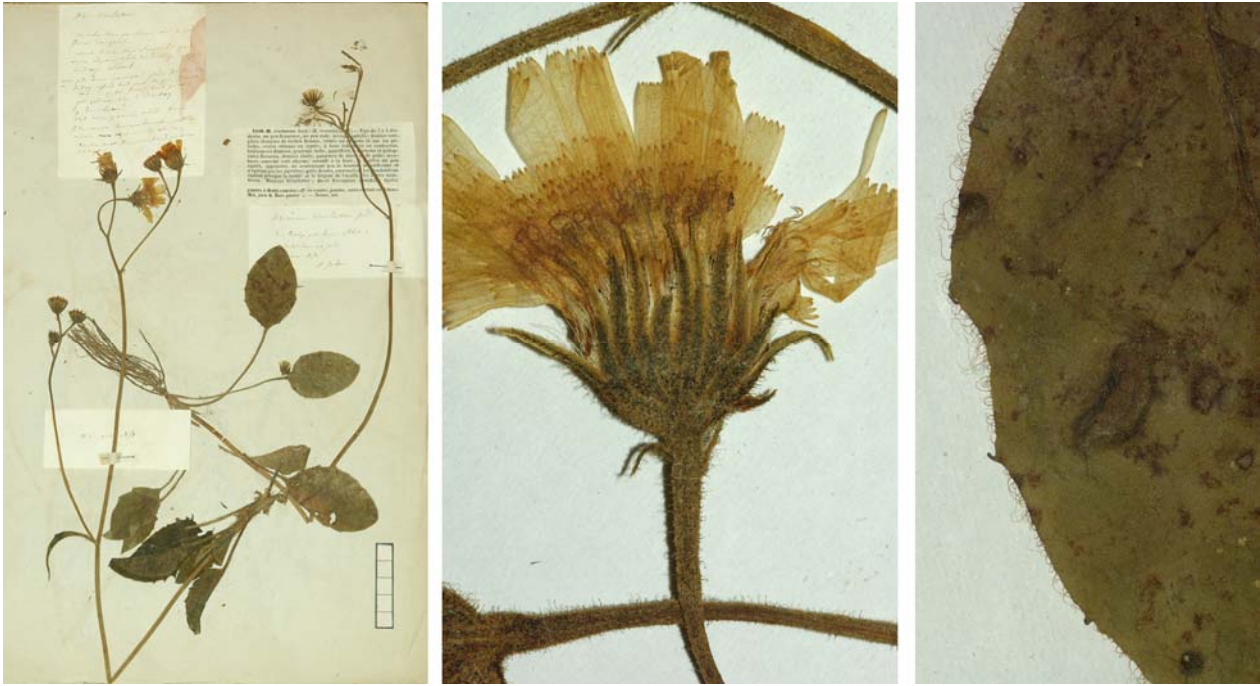
Fig. 173 Hieracium similatum JORD. ex BOREAU, Fl. Centre France, ed. 3, 2: 411 (1857) – Ind. loc.: „Nevers, etc.“, Lectotypus, hoc loco designatus: „de Marcy près Lyon (Rhône), récolté dans mon jardin, mai 1854“, leg. et det. A. Jordan sub: Hieracium similatum , ANG-Hb.Boreau. [The herbarium page includes a second specimen probably from the same locality (no indication) but collected in October 1851.]