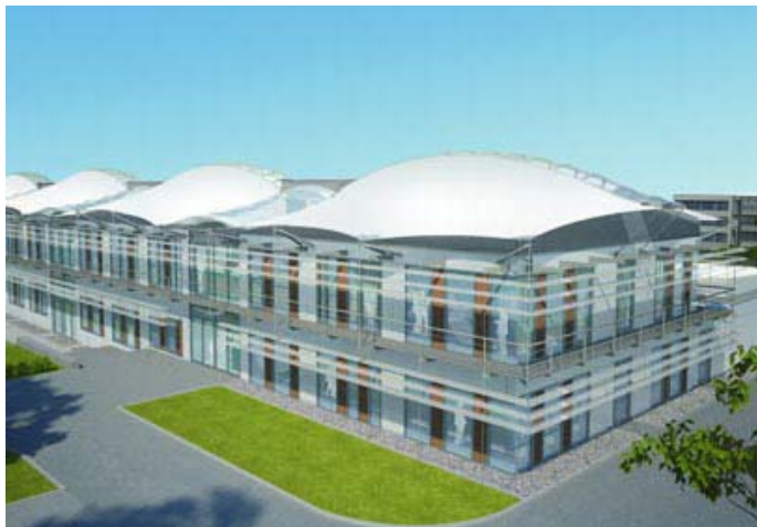
Das zukünftige Forschungsgebäude „Energy Efficiency Center“ des Bayerischen Zentrums für angewandte Energieforschung (ZAE Bayern) in Würzburg. Bild: Lang Hugger Rampp GmbH

Auf zwei Stockwerken mit insgesamt rund 3400 Quadratmetern Geschossfläche entstehen Labore, ein Technikum, Büros und ein öffentlich zugängliches Infocenter. Die Baukosten belaufen sich auf 10,4 Millionen Euro, die Fertigstellung des Gebäudes ist für Ende 2012 geplant. Finanziell gefördert wird das Projekt vom Bundesministerium für Wirtschaft und Technologie, vom Bayerischen Staatsministerium für Wirtschaft, Verkehr, Infrastruktur und Technologie sowie von Industriepartnern.