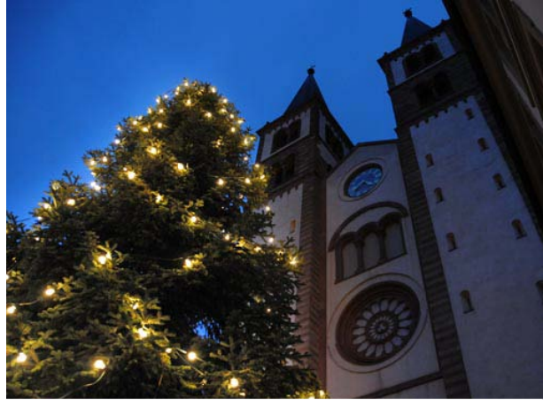
Weihnachten und Advent in der katholischen Kirche. Vor 50 Jahren lief das noch ganz anders ab als heute.

Rorate-Messe: Der Name ist abgeleitet von dem ersten Wort des Eingangsgesangs jeder dieser Messen. „Tauet, ihr Himmel, von oben. Ihr Wolken, regnet herab den Gerechten.“ Eine Textstelle aus dem Alten Testament, die den Messias herbeiruft. Tauet – auf Lateinisch „Rorate“. Zentrales Motiv der Messen war die Verkündigung des Engels an die Jungfrau Maria: „Da sagte der Engel zu ihr: Fürchte dich nicht, Maria; denn du hast bei Gott Gnade gefunden. Du wirst ein Kind empfangen, einen Sohn wirst du gebären: dem sollst du den Namen Jesus geben.“