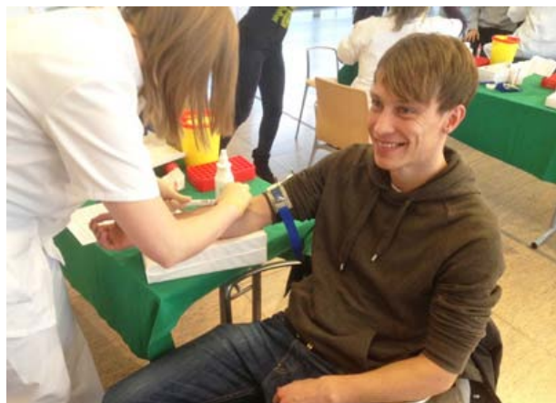
Für eine Stammzelltypisierung muss der potenzielle Spender nur eine kleine Blutprobe abgeben.

Der Bedarf an Stammzellspendern ist nach wie vor groß: Jährlich erkranken in Deutschland etwa 11.000 Menschen an Leukämie oder ähnlichen Bluterkrankungen. Viele von ihnen benötigen zur Heilung eine Stammzelltransplantation. „Für diese Patienten ist es lebensnotwendig, dass sich möglichst viele Menschen typisieren und registrieren lassen“, so Student Christian Leonhardt vom Vorstand des Vereins „Unterwegs ge-