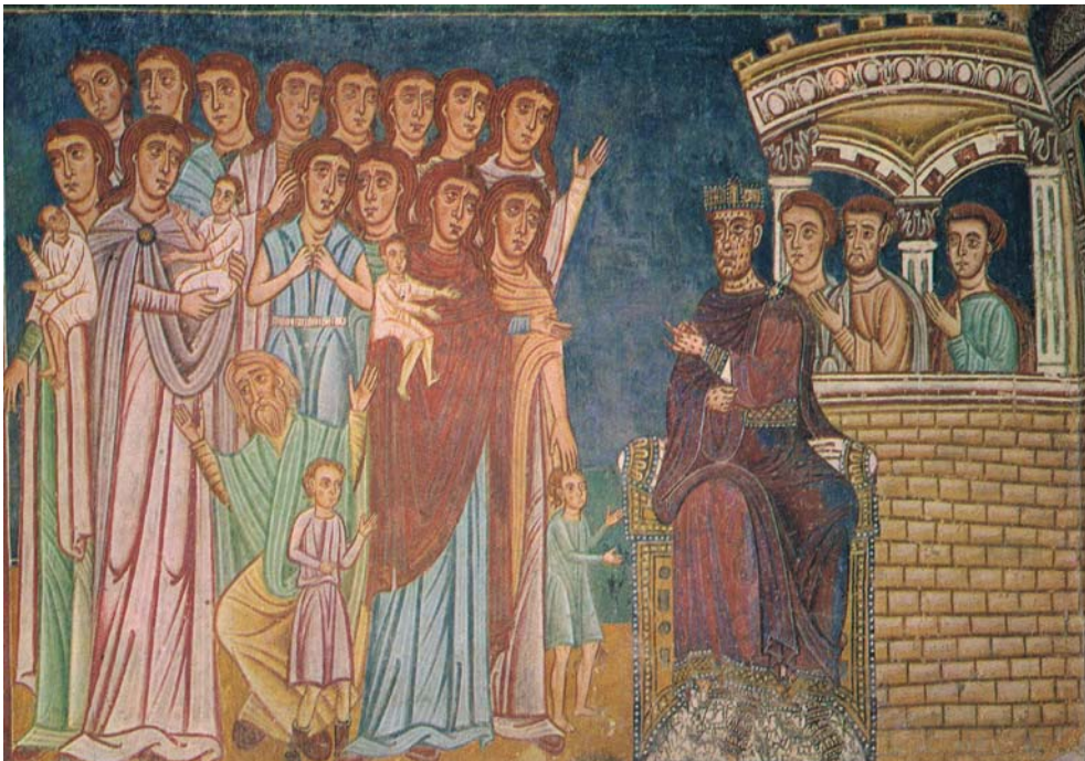
Abb. 1: Die klagenden Mütter