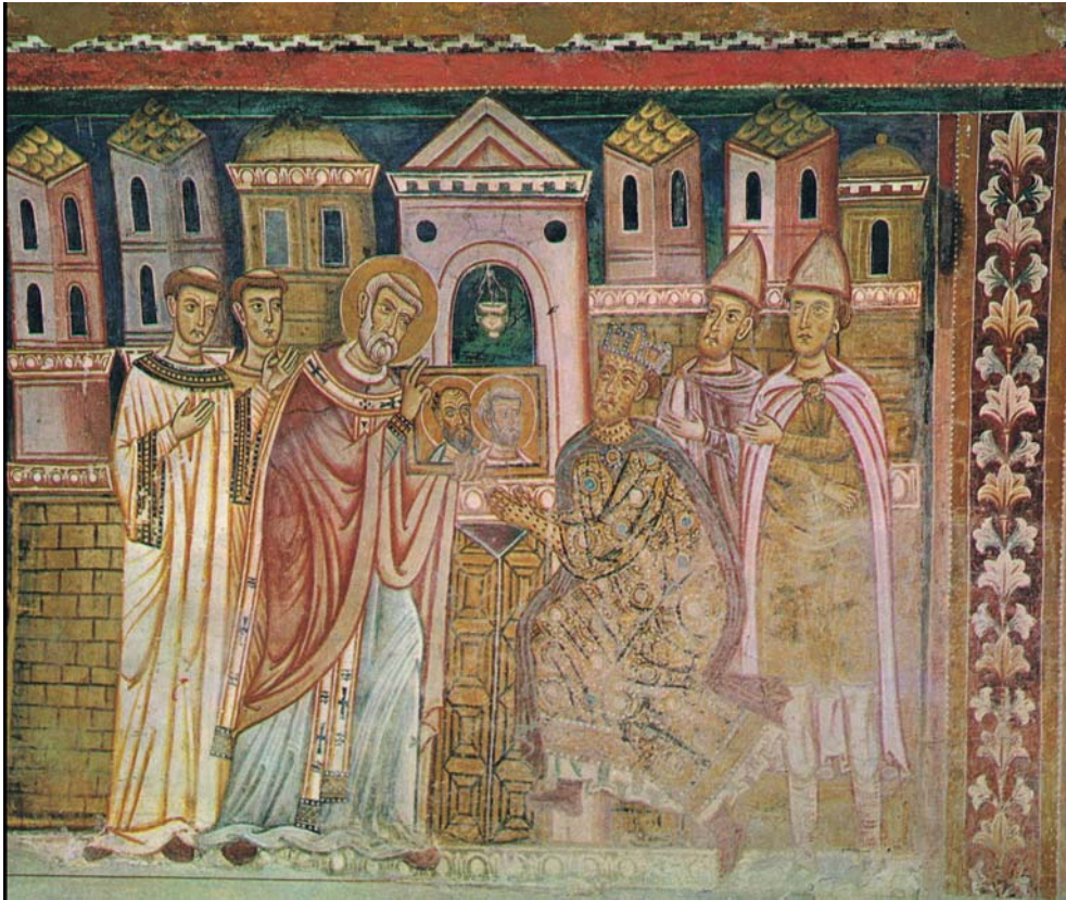
Abb. 4: Weisung der Apostelbildnisse