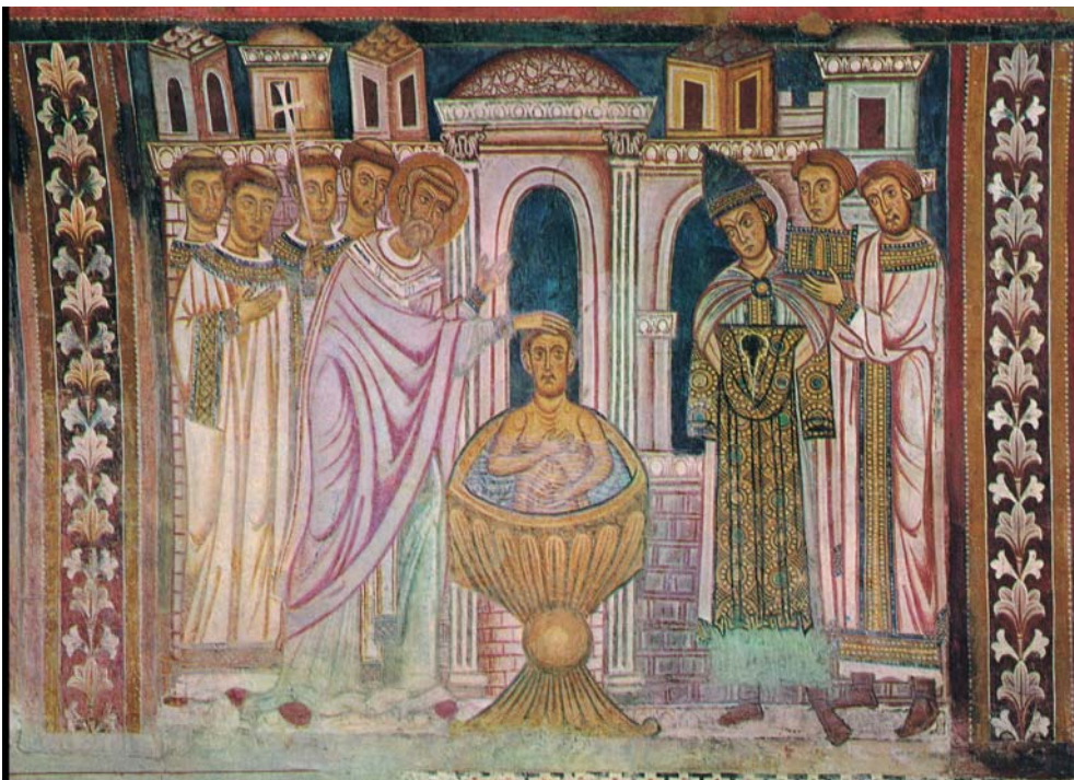
Abb. 5: Taufe