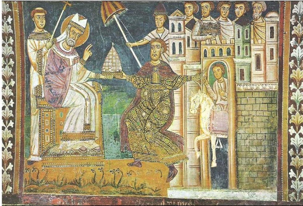
Abb. 6: Schenkung