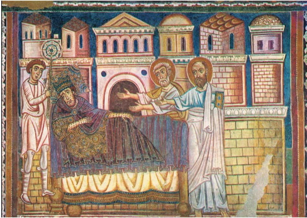
Abb. 2: Erscheinung der heiligen Petrus und Paulus