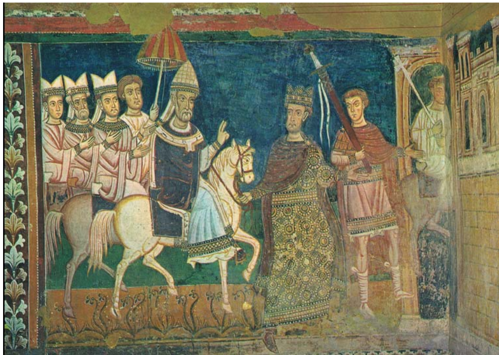
Abb. 7: Einzug in Rom