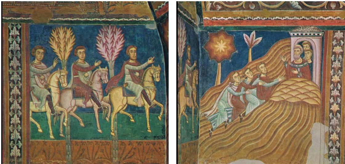
Abb. 3: Botschaft zum Monte Soratte