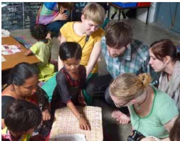
Studierende der Sonderpädagogik informieren sich im Rishi Valley über inklusive Bildungspraxis.