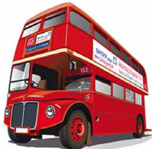
Ein Info-Bus zur Schlaganfall-Kampagne wird in über 40 Städten in Bayern die Bevölkerung über Schlaganfälle aufklären.

Am Info-Bus bieten die Neurologischen Kliniken des Universitätsklinikums und des Juliusspitals ein vielfältiges Programm mit Informationsständen, Expertengesprächen und Beratungen an. Die Experten zeigen, auf welche Zeichen man achten sollte und was im Notfall zu tun ist. Außerdem können Interessierte einen Schlaganfall-Risiko-Check machen und ihr Wissen über den Schlaganfall in einem Quiz mit Preisverlosung unter Beweis stellen.