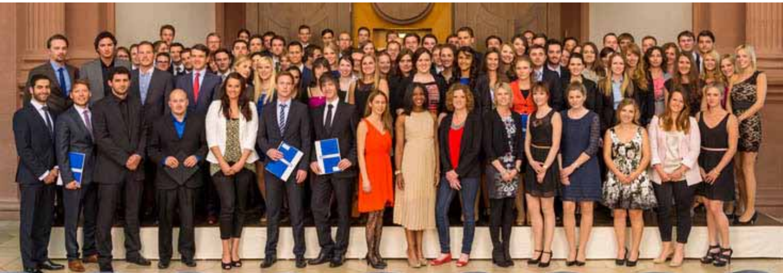
Die Absolventinnen und Absolventen der Wirtschaftswissenschaftlichen Fakultät.