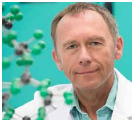
Wolfgang Schnick hat den Lehrstuhl für Anorganische Festkörperchemie an der Münchner Ludwig-Maximilians-Universität inne. Jetzt ist er zu Gast in Würzburg.

Die neuen LED-Leuchtstoffe basieren auf außerordentlich stabilen synthetischen Netzwerkstrukturen von Elementen wie Silizium und Aluminium sowie Stickstoff. Das Element Stickstoff bewirkt dabei die hohe Stabilität und Robustheit der Leuchtstoffe. Zudem ist es dafür verantwortlich, dass das blaue Licht der Primär-LEDs in alle anderen Farbkomponenten des sichtbaren Spektrums umgewandelt werden kann.