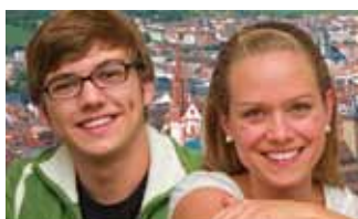
Titelbild des Gutscheinehefts für Studierende.

Neben dem Zuschuss zum Semesterticket gibt es ein komplett überarbeitetes Gutscheineheft mit vielen Rabatten und kostenlosen Eintritten im Wert von über 100 Euro. 42 Unternehmen aus Würzburg und der Region – darunter Einzelhändler, Bars, Restaurants, Kultur- und Sporteinrichtungen – bieten Preisnachlässe oder kostenlose Leistungen. Das sind über 40 Prozent mehr als beim Start des Angebots 2011.